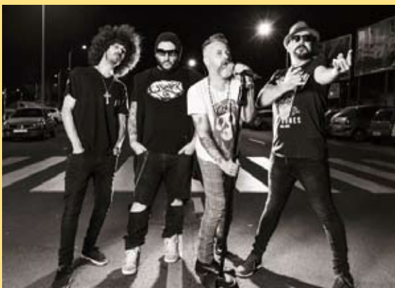
Viernes 7. 01:30 - Dr. Diablo