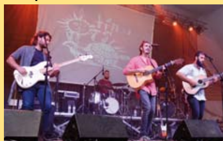
La Tribu del Caracó