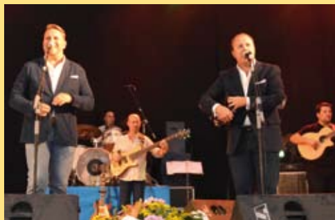
Jueves 6. 00:10 - Serva-Labari