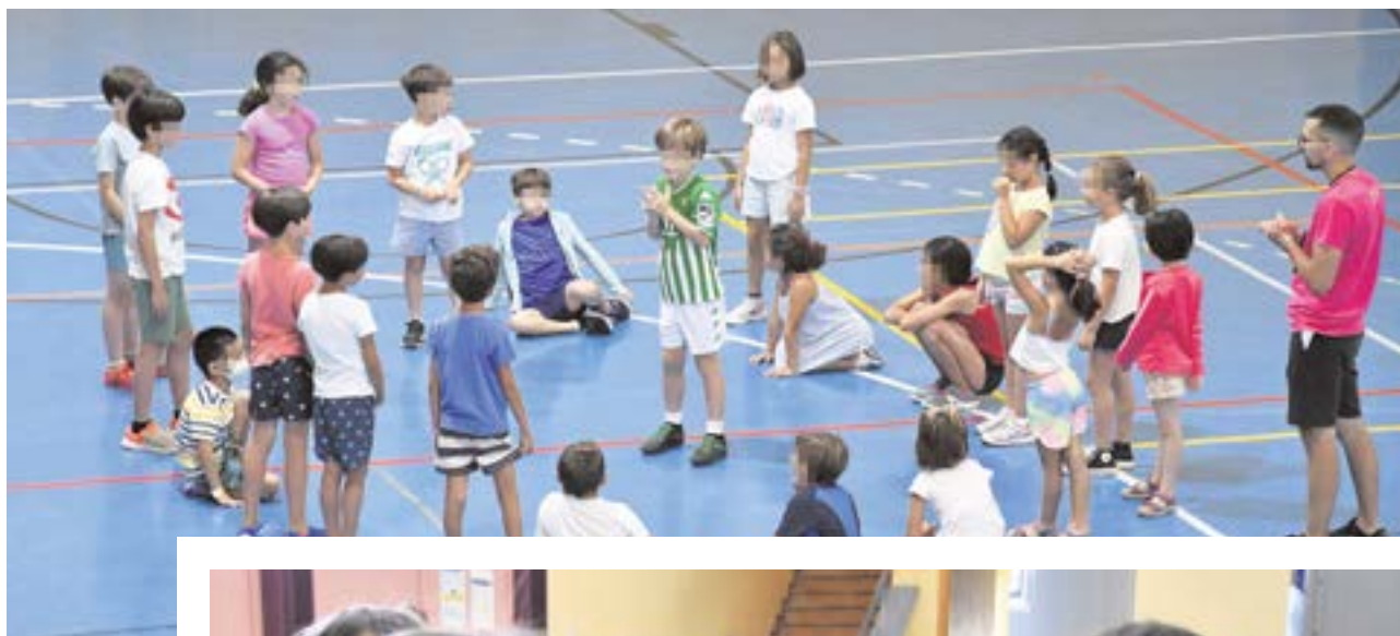
Tres imágenes de jóvenes tomareños disfrutando del primer día de los campus y talleres de verano

Por otro lado, se han organizado 23 Campus Innova, campamentos urbanos orientados a niños y jóvenes entre los 3 y 16 años, centrados en actividades encaminadas al fomento de la creatividad, el conocimiento de las nuevas tecnologías y la innovación. Según las edades, se ofertan dos propuestas dentro de los Campus Innova: Por un lado, el Innova Kids - Proyec-