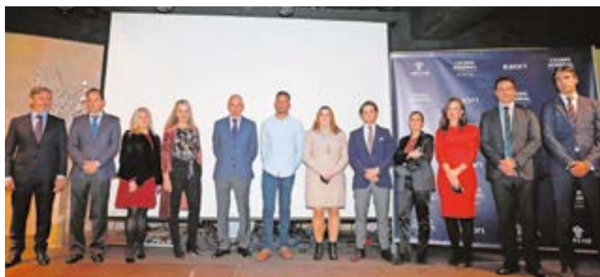
Foto de familia con los galardonados en la anterior edición de los premios

El Círculo de Empresarios (CIRE) y el Ayuntamiento de Tomares han convocado la segunda edición de los Premios a la Excelencia Empresarial "Ciudad de Tomares" 2022, tras el éxito y la buena acogida el año pasado. El certamen, que fue pionero en el municipio y contó con gran participación por parte de los empresarios tomareños, tiene como objetivo premiar y distinguir el buen hacer y la excelencia empresarial de las empresas de Tomares.