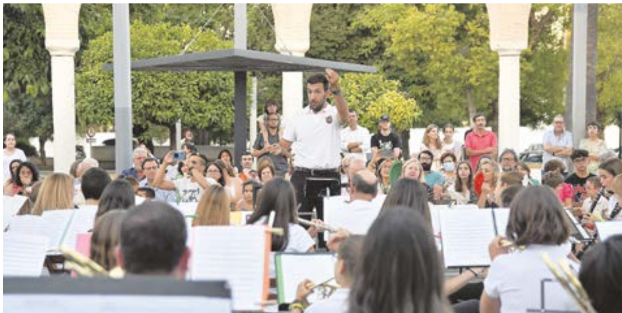
Concierto conjunto de la BSMT y la Banda de Iniciación en la Plaza de la Constitución el pasado 28 de junio

LA BANDA SINFÓNICA MUNICIPAL CIERRA EL CURSO CON DIVERSAS ACTUACIONES COMO EL CONCIERTO CONJUNTO CON LA BANDA DE INICIACIÓN EL PASADO 28 DE JUNIO EN LA PLAZA DE LA CONSTITUCIÓN