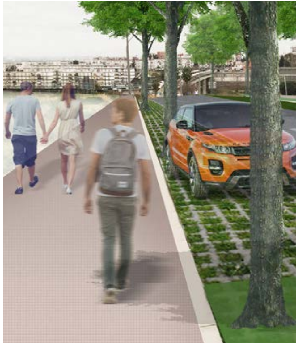
Recreación de la urbanización de la calle Isadora Duncan, que permitirá la conexión rodada y

E l Ayuntamiento de Tomares ha iniciado las obras que conectarán de manera directa y segura a los vecinos del municipio, a través de la