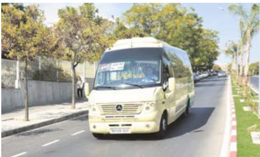
Tras las obras, se pondrá en marcha la primera lanzadera circular urbana del Aljarafe