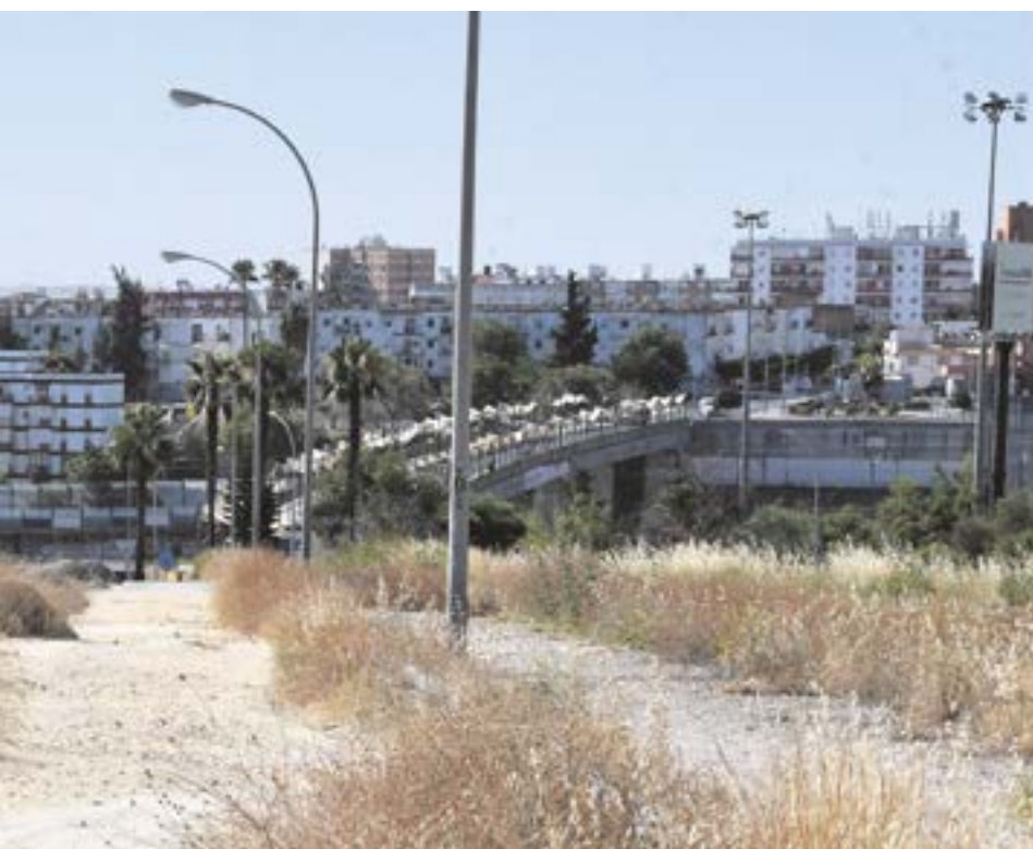
Castilla en el municipio vecino de San Juan de Aznalfarache

LAS ACTUACIONES SE EJECUTARÁN ATENDIENDO A LOS PARÁMETROS MEDIOAMBIENTALES ACTUALES, CONTANDO CON UN ESTUDIO DE GESTIÓN DE RESIDUOS Y REUTILIZACIÓN DE MATERIALES