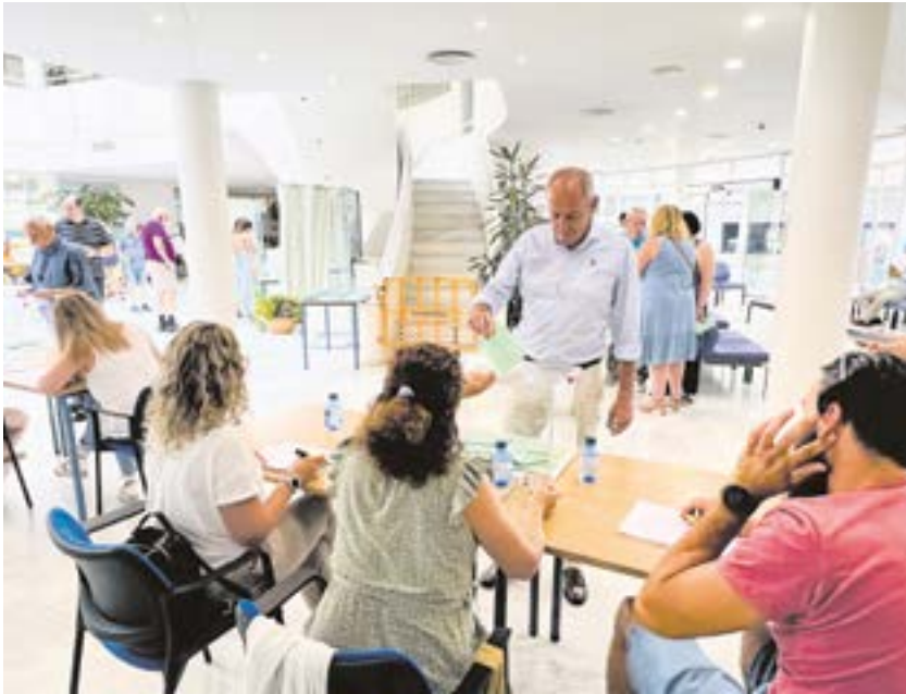
El alcalde votando en las pasadas elecciones al Parlamento de Andalucía