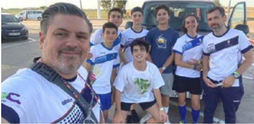
Tiradores y entrenadores de la EDM de Esgrima de Tomares