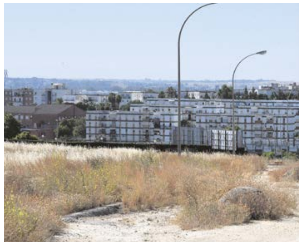
La calle Isadora Duncan desemboca en el límite municipal de Tomares uniéndose a la calle

CON ESTE PROYECTO, CUMPLIMOS CON EL COMPROMISO DE FACILITAR UN ACCESO SEGURO, RÁPIDO Y DIRECTO DESDE TOMARES HASTA LA PARADA DE METRO DE SAN JUAN ALTO", SEÑALÓ EL ALCALDE DE TOMARES, JOSÉ MARÍA SORIANO