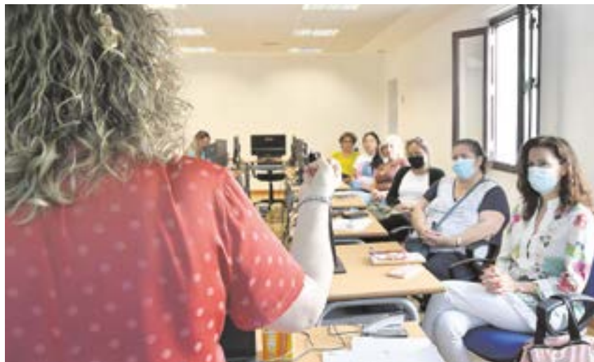
Tomareños formándose en uno de los cursos gratuitos de la ADL para desempleados

Otros 20 tomareños están terminando las dos ediciones del Curso "Gestión administrativa con Simulación de Empresas" de 4 meses de duración cada uno, puesto en marcha por el Ayuntamiento