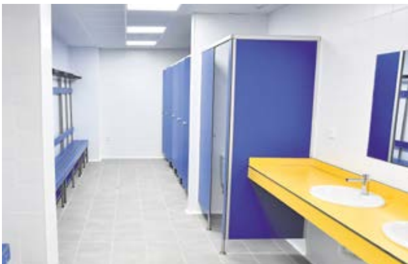
Uno de los nuevos vestuarios del Estadio Municipal de Fútbol “San Sebastián”