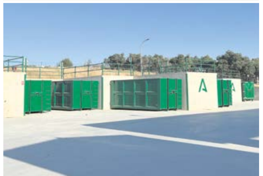
Varios de los contenedores del nuevo punto limpio donde se depositarán los residuos