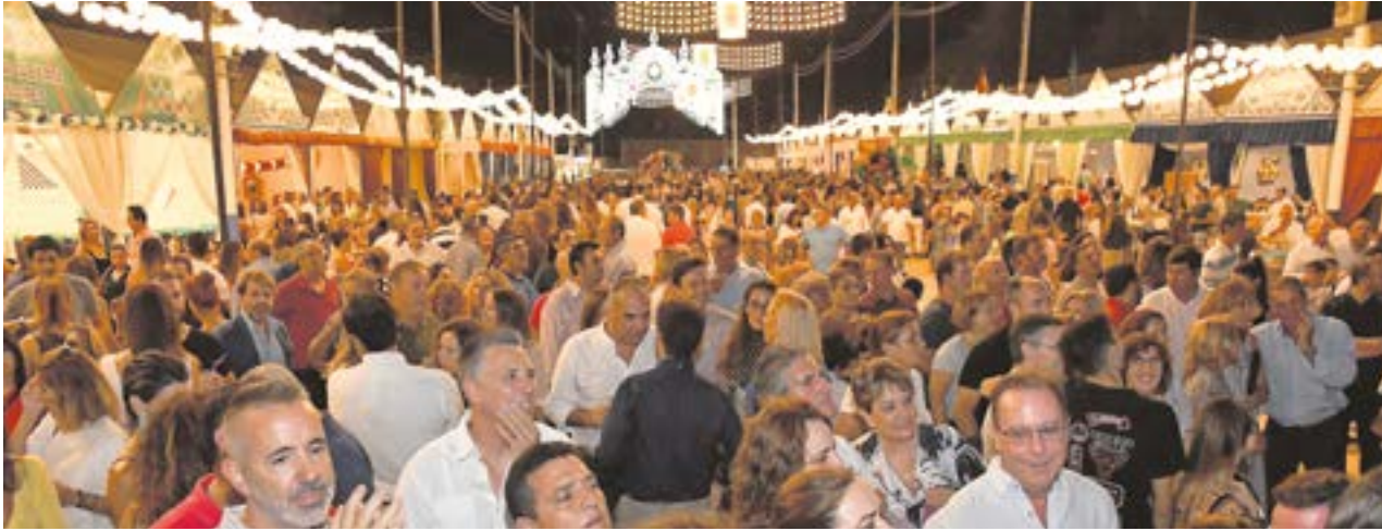
Las calles del Real se volverán a llenar de vida y buen ambiente con la celebración de la tradicional Feria de Tomares