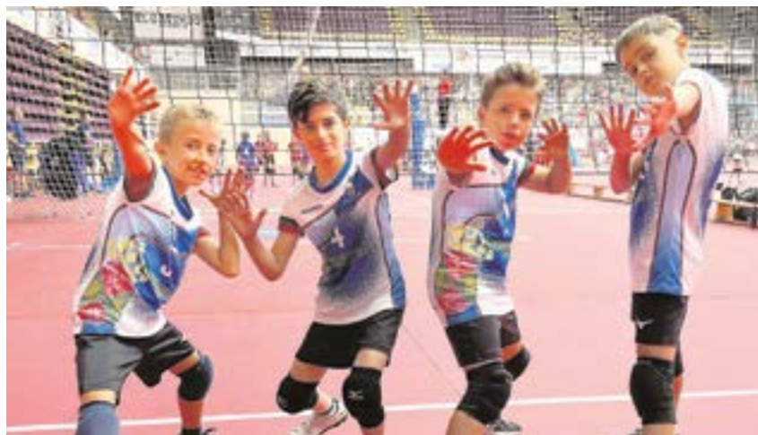
El equipo benjamín masculino consiguió un meritorio quinto puesto de España