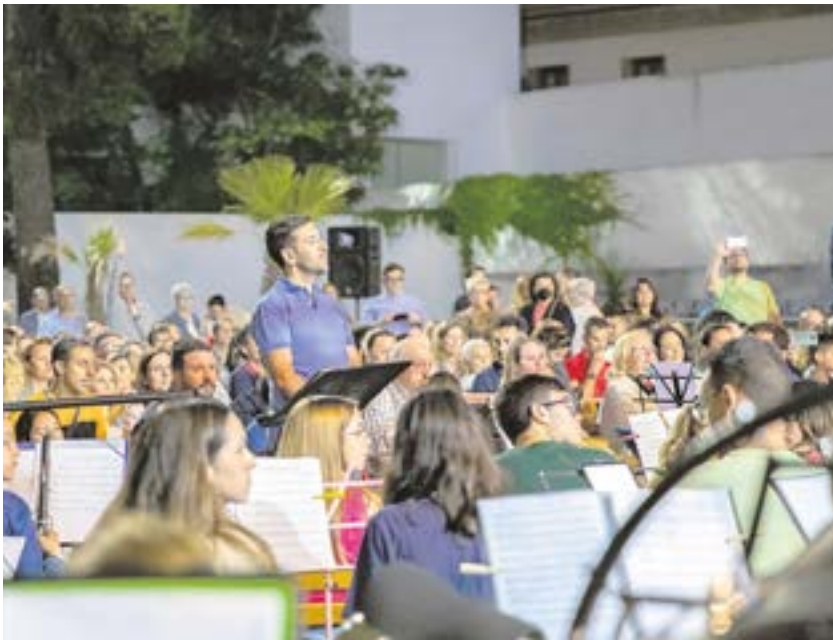
Imagen de uno de los últimos conciertos de la Banda Sinfónica Municipal de Tomares

Para lo que necesites, contacta con Melero directamente en el 625881901