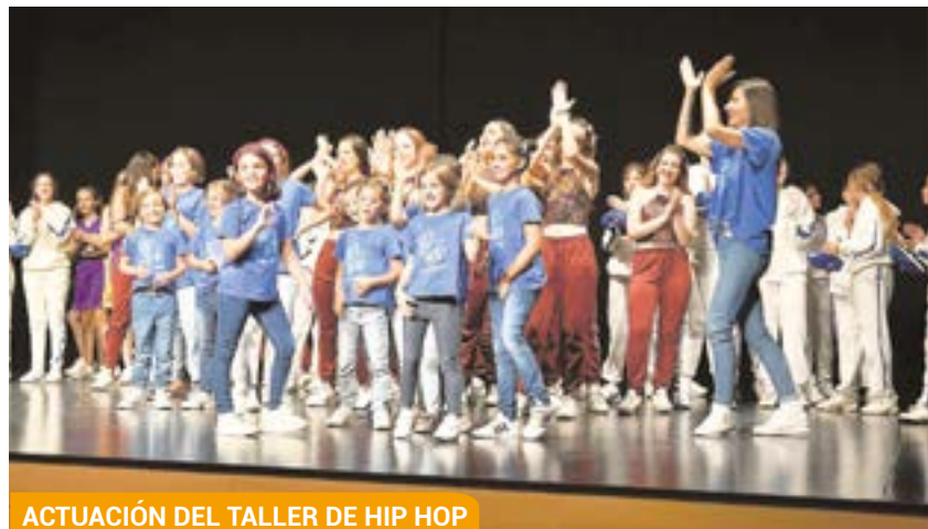
ACTUACIÓN DEL TALLER DE HIP HOP