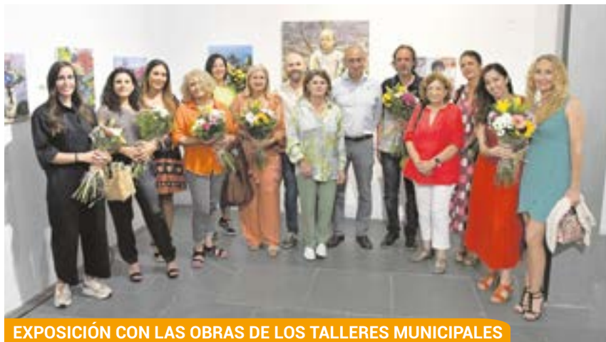
EXPOSICIÓN CON LAS OBRAS DE LOS TALLERES MUNICIPALES