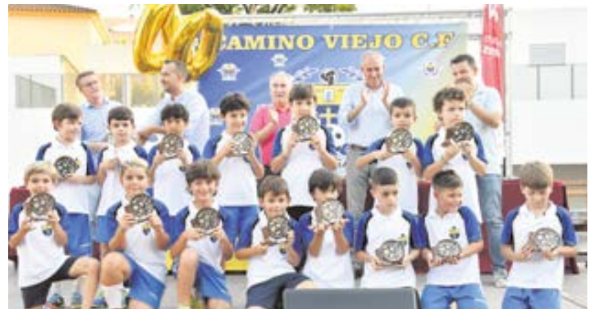
Los más pequeños del Camino Viejo también recibieron un trofeo