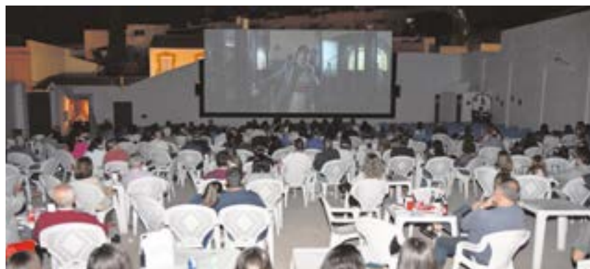
Vecinos disfrutando de una película al aire libre en Cinema Tomares

Situado en la calle Navarro Caro, 50, el cine de verano de Tomares es una experiencia inigualable para volver a vivir el séptimo arte en estado puro. Sus mil metros cuadrados de patio enladrado y su pantalla gigante de 72 metros han vuelto, al igual que el ambigú, con sus tapas caseras, los veladores, las macetas con su amalgama de colores y sus sillas azules de hierro. Durante este mes podrán verse películas como “El mundo es vuestro” (2, 3, y 4 de julio), “El bebé jefazo 2” (6 de julio) o “Muerte en el Nilo” (7 y 8 de julio).