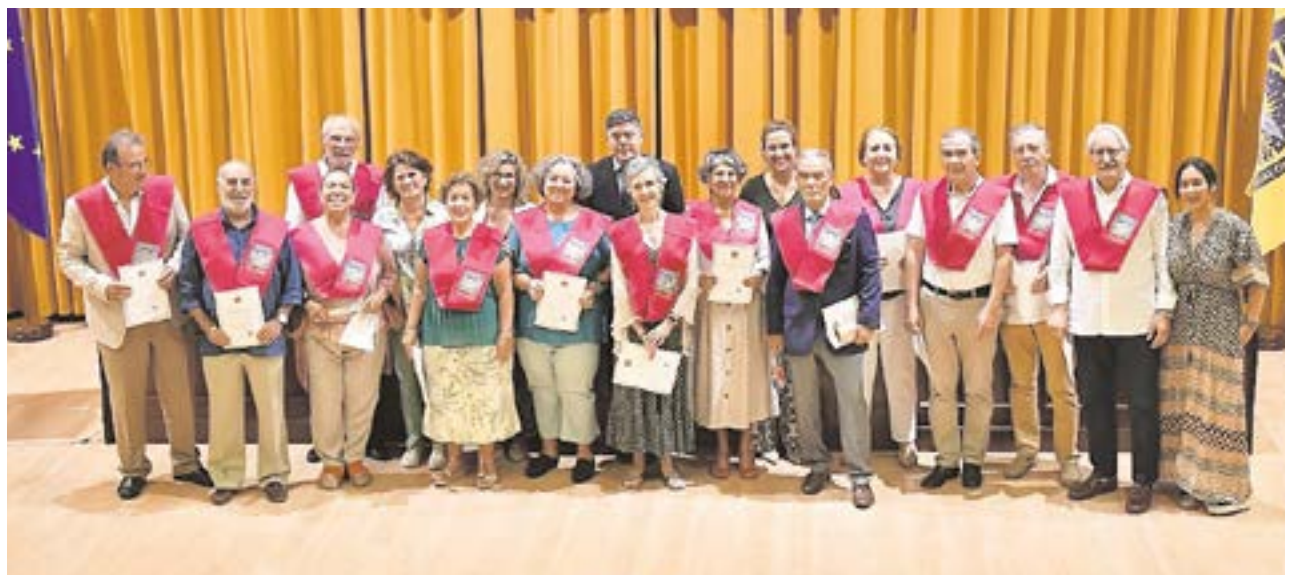
Alumnos del Aula Abierta de Mayores de la UPO tras recibir sus becas y diplomas que los acreditan como graduados

El Ayuntamiento también celebró el 9 de junio el acto de clausura de este curso 2021-2022.