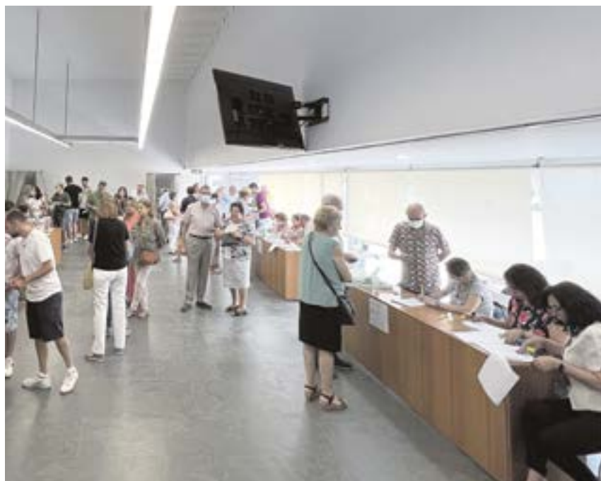
Tomareños votando en el colegio electoral en el Salón de Plenos del Ayuntamiento

Saca más de 28 puntos de diferencia con la segunda lista más votada