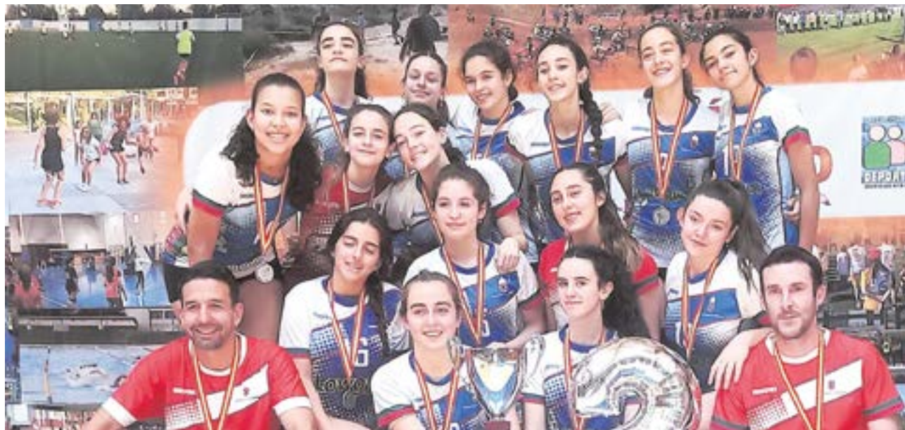
Jugadoras del equipo cadete femenino de la EDM Voleibol Tomares celebrando el subcampeonato junto a sus entrenadores

EL VOLEIBOL TOMAREÑO HA HECHO HISTORIA ESTA TEMPORADA AL SER EL ÚNICO CLUB ANDALUZ EN ESTAR PRESENTE EN TODAS LAS CATEGORÍAS DE LOS CAMPEONATOS DE ESPAÑA