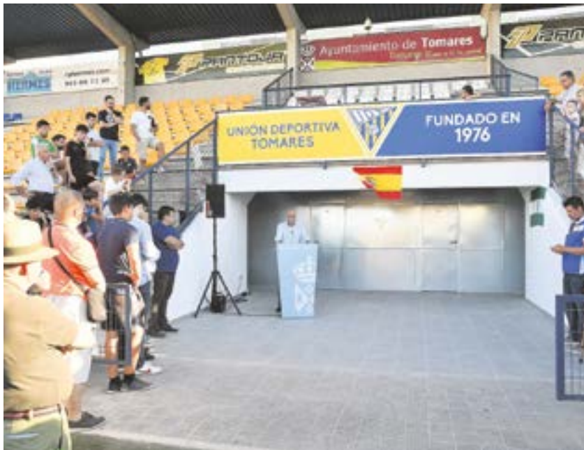
Acto de inauguración de los vestuarios y del nombre de la grada

Las instalaciones, con 248,92 metros cuadrados útiles, para las que se ha tenido en cuenta la sostenibilidad funcional y medioambiental, por primera vez están climatizadas con equipos