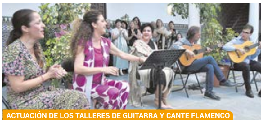
ACTUACIÓN DE LOS TALLERES DE GUITARRA Y CANTE FLAMENCO

Además, los alumnos del Taller Municipal de Hip Hop, iniciativa que causa furor entre los jóvenes del municipio, quisieron sorprender al público con una actuación en el Auditorio