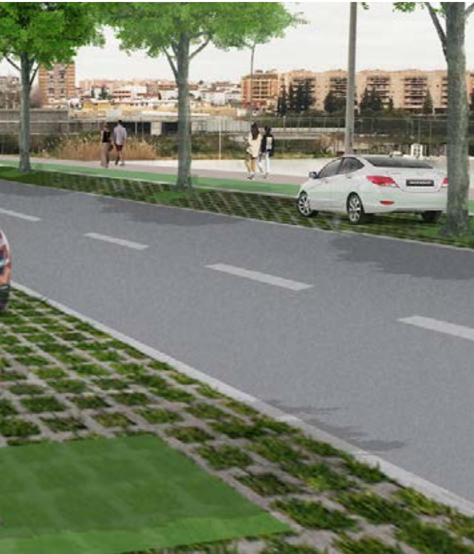
peatonal entre Tomares y San Juan a través del Puente de los Derechos Humanos