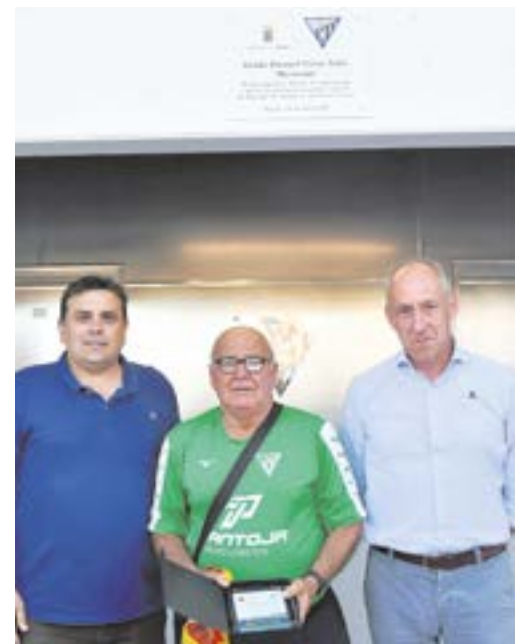
La grada del estadio con el nombre de “Mestraña”