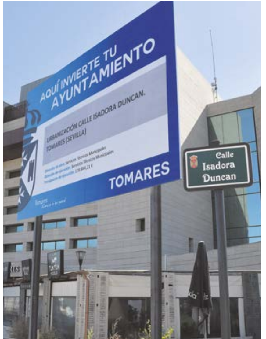
Este plan mejorará las comunicaciones entre Tomares y San Juan de Aznalfarache

“Con este proyecto cumplimos con el compromiso adquirido con los vecinos de facilitar un acceso seguro, rápido y directo desde Tomares hasta la parada de metro de San Juan Alto, con el objetivo de seguir mejorando las conexiones de