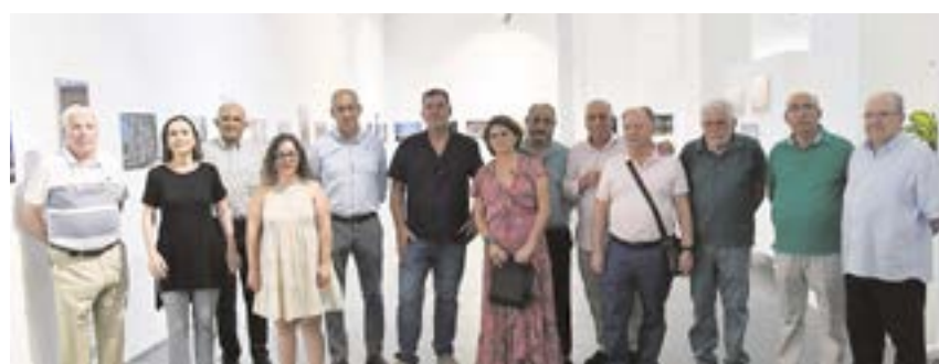
Foto de familia con artistas y autoridades municipales en la inauguración de la muestra

de Cultura de la temporada 2022/2023 tanto para adultos como niños y jóvenes, podrán hacerlo a partir del lunes 5 de septiembre, de forma presencial, mediante cita previa, en el Servicio de Atención al Ciudadano (SAC), de lunes a viernes, de 8:30 a 14:30 horas. Las plazas se adjudicarán por orden de llegada.