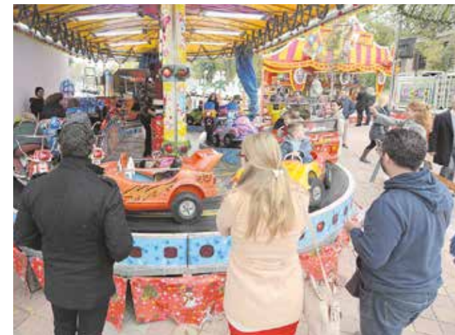
Cacharritos para los más peques