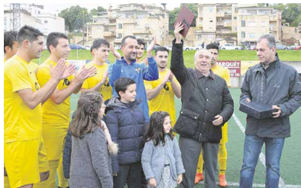
El presidente del Camino Viejo agradece la placa de reconocimiento a su labor entregada por el alcalde

Un club que empezó con tan sólo dos equipos, el senior y el juvenil, y que hoy es toda una escuela de fútbol por la que pasan todas las semanas más de 400 jugadores de los cer-