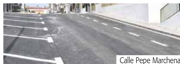
Calle Pepe Marchena