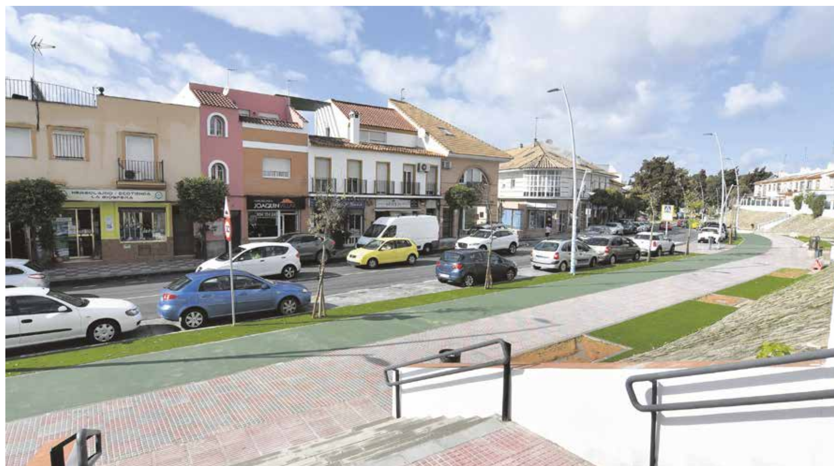
La calle Alameda de Santa Eufemia tras su reforma cuenta con carril bici, entre otras mejoras