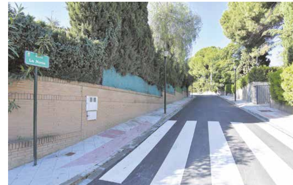
Nueva imagen de la calle La Noria tras su remodelación

Gracias al Plan de Reurbanización se han arreglado ya más de 100 calles