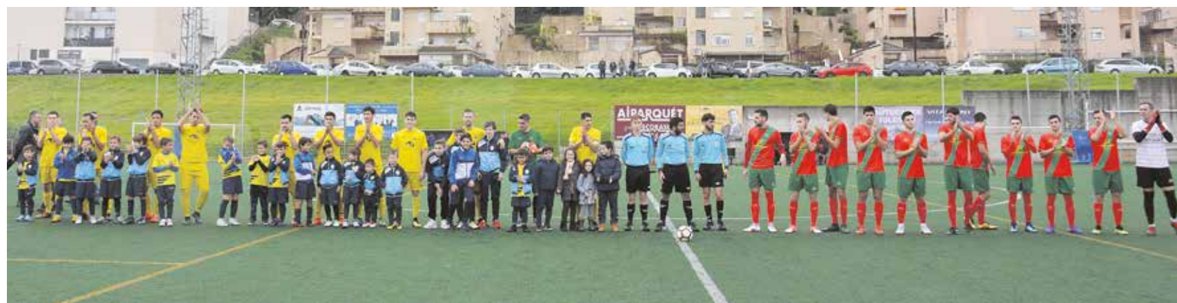
El Camino Viejo y la UD Tomares se volvieron a encontrar en un derby local ocho años después