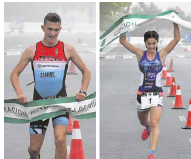
Ganadores cadetes del Duatlón

Organizado por el Ayuntamiento de Tomares y la empresa DOC 2001 SL, en