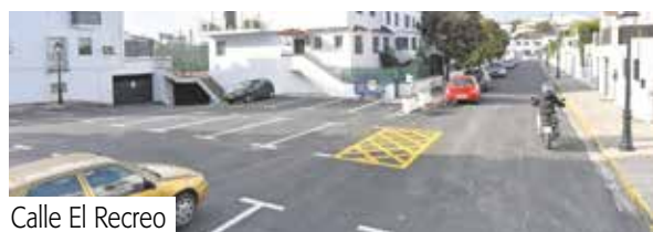
Calle El Recreo