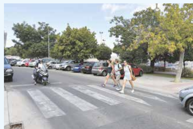
El paso de cebra frente al Polideportivo Mascareta será uno de los pasos de cebra inteligente en un futuro

El Ayuntamiento va a mejorar la señalización vial del municipio, así como la seguridad de los cruces peatonales no regulados por semáforos en las zonas de mayor afluencia de tráfico. En éstos se van a implantar pasos de peatones inteligentes luminosos, una intervención que se hará a través del Plan Supera VI de la Diputación. Se trata de una medida pionera que acerca a Tomares a su proyecto de «smart city» o ciudad inteligente.