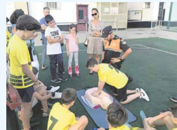
Los jóvenes, aprendiendo a hacer RPC

La actividad, impartida por el FISEM 112 e instructores de RCP (respiración cardiopulmonar), con la colaboración del Ayuntamiento de Tomares, Protección Civil, Policía Local, la Clínica Quirón Salud y el Centro de Salud de Tomares, enseñó con maniqués a los alumnos de la escuela de los equipos benjamines, alevines, infantiles y cadetes a cómo deben de actuar ante una emergencia sanitaria en la que haya una persona