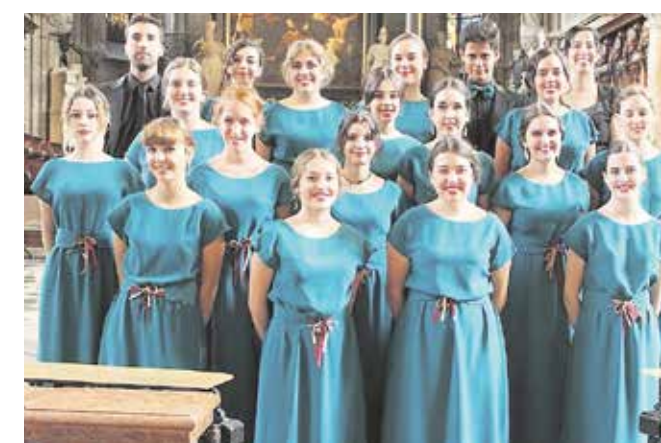
La Escolanía de Tomares ha sido uno de los participantes

ternacional de Tomares, organizado por la Coral Polifónica Tomares a través de su Asociación Coral «Vicente Sanchis», junto con el Ayuntamiento de Tomares, coloca cada año a nuestro municipio en el epicentro de la música polifónica más allá de nuestras fronteras.