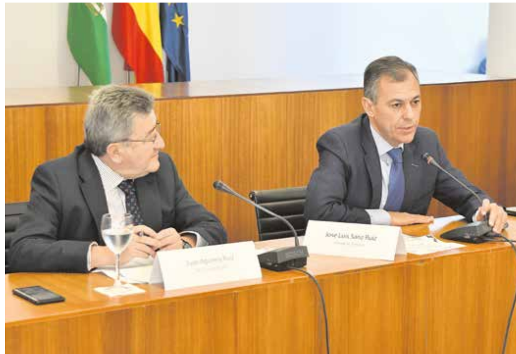
El alcalde de Tomares y el gerente de Gaesco en un momento de las jornadas

Estos retos pasan por potenciar el patrimonio histórico , rehabilitar los cascos históricos antiguos, la construcción sostenible y accesible con consumo energético casi nulo y la bioconstrucción