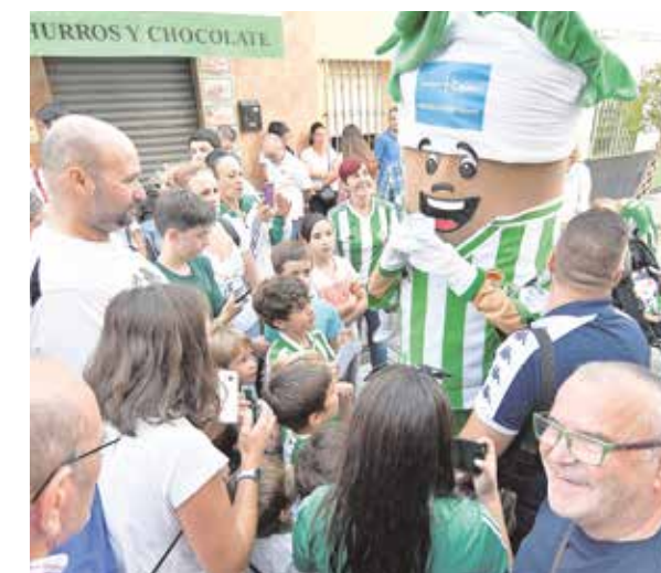
Palmerín amenizó la espera de los aficionados