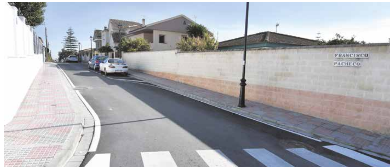
La calle Francisco Pacheco ha sufrido una intensa renovación

Las obras han consistido en la renovación de la red de saneamiento y abastecimiento, en la mejora del alumbrado público con farolas más eficientes energéticamente, en la eliminación de barreras arquitectónicas y en la repavimentación de los acerados. También se ha reasfaltado la calzada de la calle Francisco Pacheco, donde además se ha mejorado la señalización horizontal y vertical. En la calle Pablo de Rojas, se han renovado también las redes de saneamiento (imbornales nuevos) y abastecimiento de agua. Los trabajos han tenido como objetivo dejar estas calles como nuevas, para lo cual se