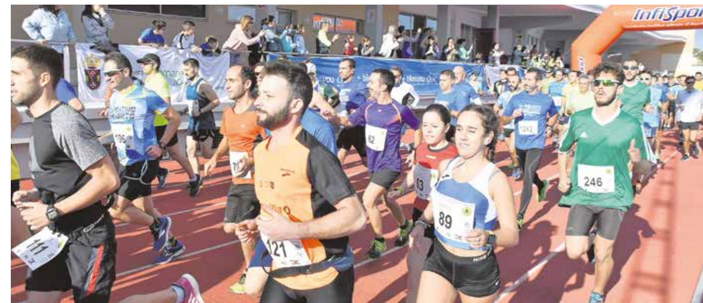
VII Carrera Popular «Ciudad de Tomares»