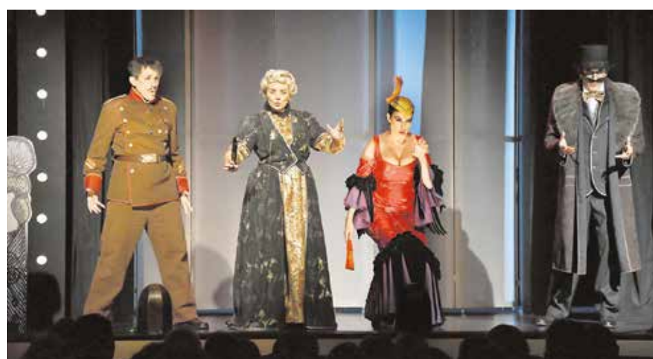
Un momento de la obra representada por Fundición Producciones