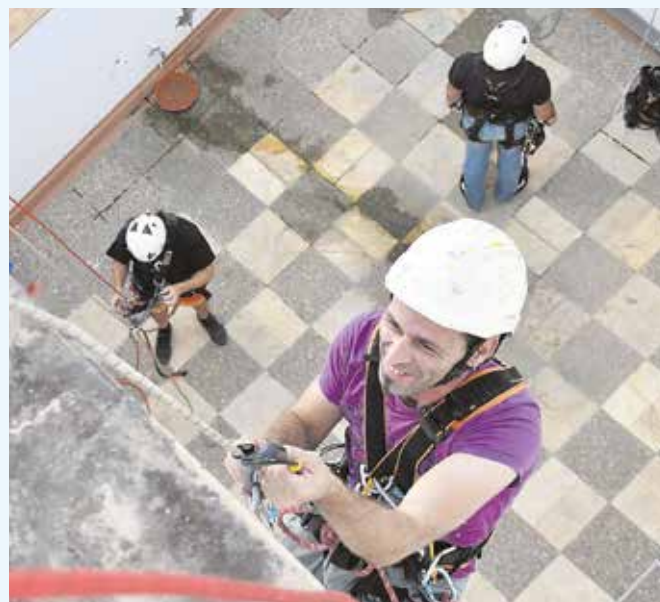
Alumnos del curso de Trabajos Verticales

Una treintena de vecinos de Tomares han ampliado sus posibilidades de encontrar un empleo gracias a los tres cursos organizados por el Ayuntamiento. En concreto, son alumnos del curso Dependientes de Grandes Superficies, en colaboración con Carrefour, que se ha celebrado del 17 de septiembre al 16 de noviembre, y en el que han participado cinco tomareños; del curso Gestión Administrativa de Operaciones Internacionales, en colaboración con Prodetur, en el que han participado 16 alumnos del 17 de septiembre al 11 de octubre; y del curso de Especialización de Trabajos Verticales, en el que han participado nueve tomareños.