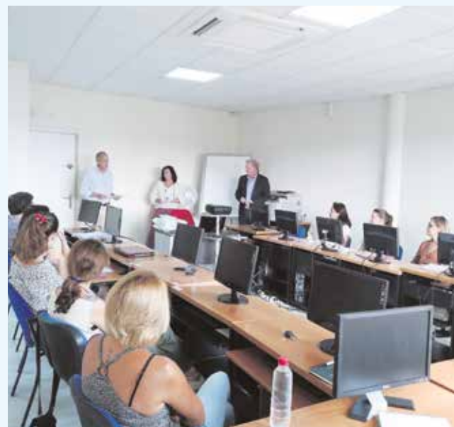
Curso de Gestión Administrativa de Operaciones Internacionales