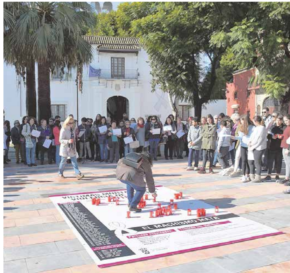
Los participantes en el acto colocando las velas por las víctimas en el mapa de España

A continuación, los alumnos de Secundaria y del Centro de Educación Permanente de la localidad leyeron un manifiesto de rechazo a la violencia contra las mujeres y guardaron un minuto de silencio.