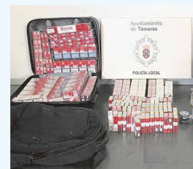
Algunas de las cajetillas requisadas por la Policía