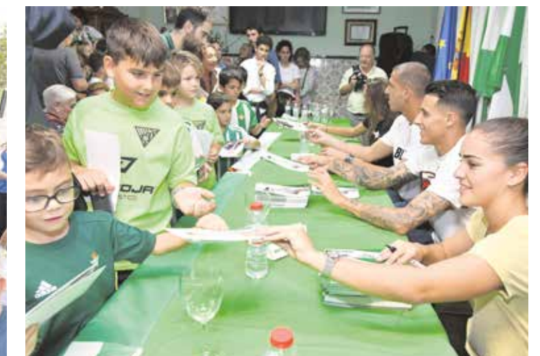
Los jugadores del Betis firmaron autógrafos a los más pequeños