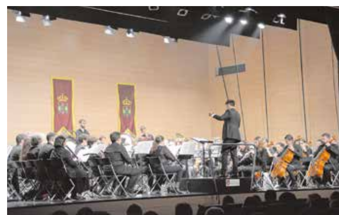
La Sinfónica de Tomares, durante el concierto de Santa Cecilia

La Banda Sinfónica Municipal de Tomares, en su permanente labor de acercar la música a todo el mundo, acudió también, el pasado 21 de noviembre, al