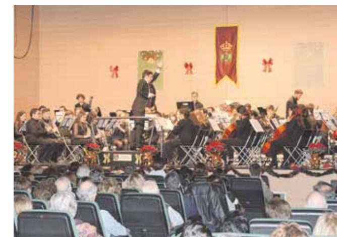
Banda Sinfónica Municipal de Tomares

El domingo, 16 de diciembre, la Parroquia de Santa Eufemia acogerá, a las 18.30 horas, el Concierto Navideño de la Banda de Iniciación, en el que los jóvenes músicos de la cantera de la Banda Sinfónica Municipal interpretarán divertidas piezas musicales y villancicos. Entrada libre hasta completar aforo.