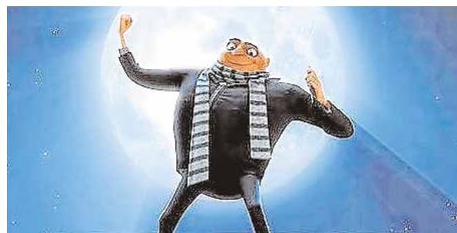
Gru, mi villano favorito 3