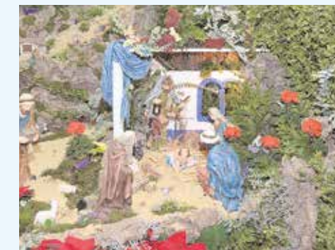
Belén del Ayuntamiento