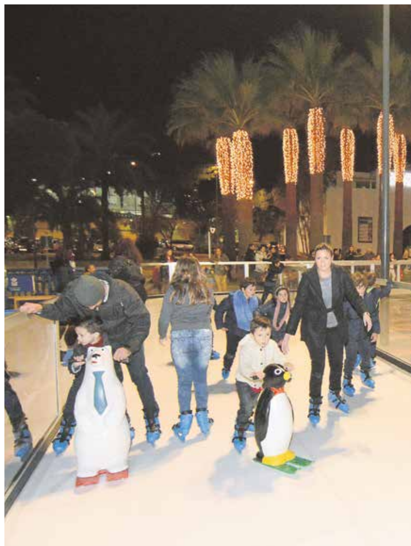
La pista de hielo, una de las grandes atracciones