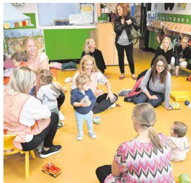
Con esta metodología los niños son protagonistas de su aprendizaje