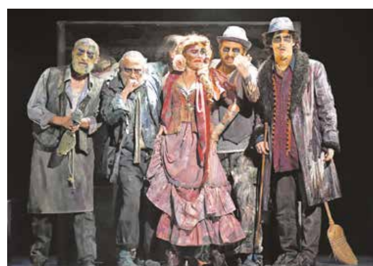
«Luces de Bohemia», de Valle-Inclán, por la Compañía de Teatro Clásico