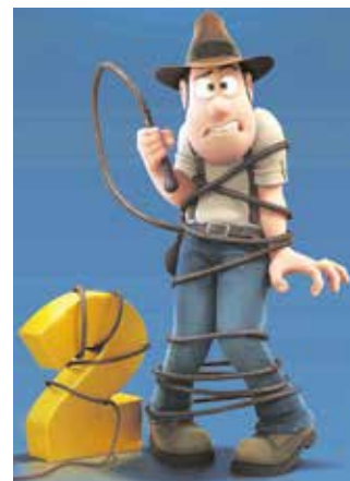
Tadeo Jones 2