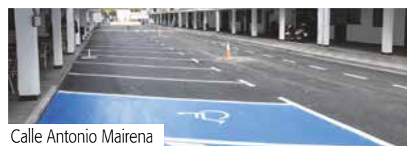
Calle Antonio Mairena

Las obras han requerido un presupuesto total de 34.983,52 euros que han sido financiados con fondos propios del Ayuntamiento.