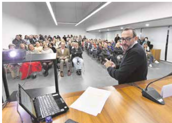
Un momento de la inauguración del nuevo curso de la UPO

Tomares abrió el pasado 30 de octubre el nuevo curso de esta institución que cumple 7 años en la localidad