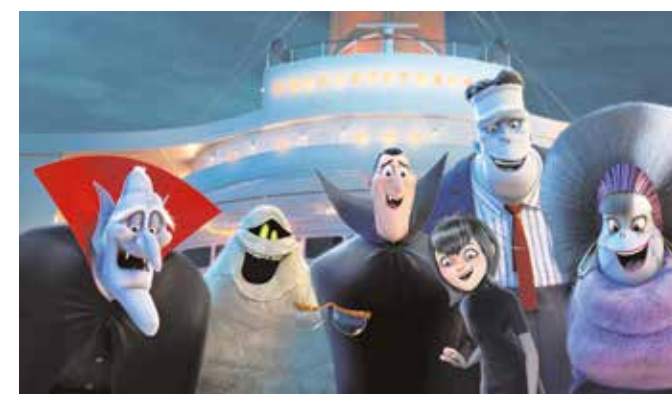
Hotel Transilvania 3