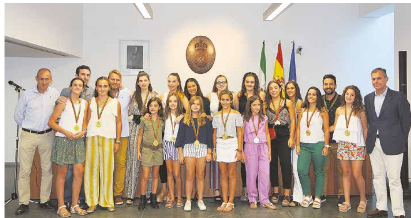
Recepción de los integrantes de los equipos de voleibol femenino alevín y juvenil

Ayuntamiento a la mejor generación de deportistas del municipio, las chicas que componen