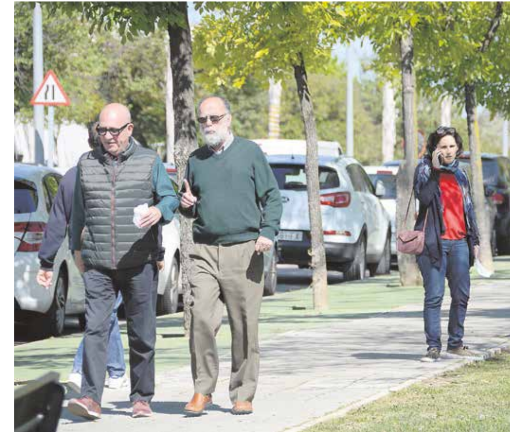
Entre los diez primeros municipios de Andalucía, hay ocho sevillanos

Tomares ha aumentado su distancia respecto al segundo municipio