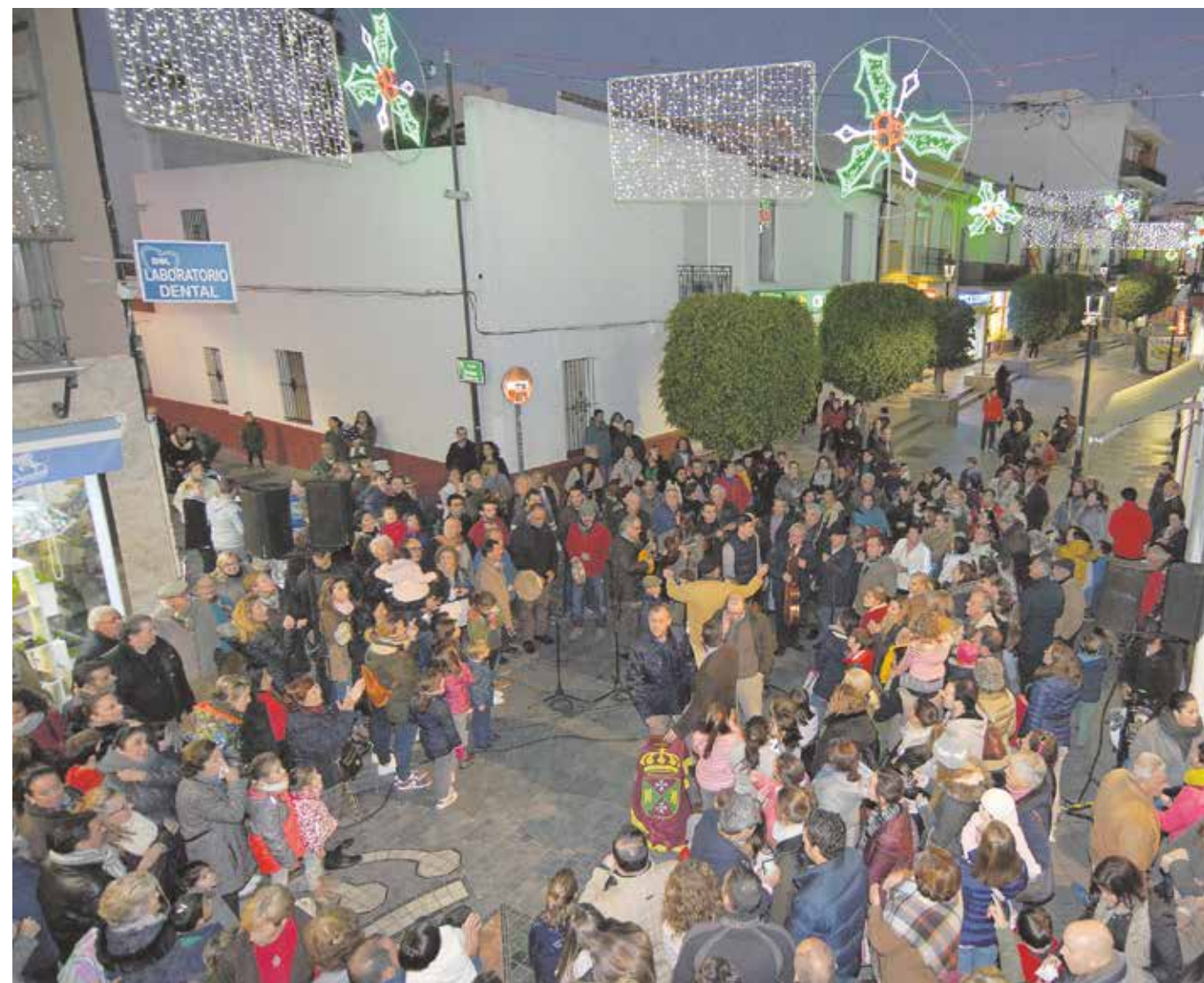
La iluminación navideña se inaugura el 5 de diciembre

antiguo ambulatorio (calle Príncipe de Asturias), un belén de gran belleza que impresiona a todo el que lo visita.