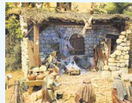
Belén de los Campanilleros