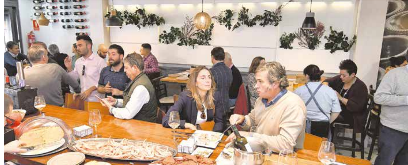
Centenares de personas han podido degustar deliciosas tapas en la VII edición de la Ruta de la Tapa

También su atractiva oferta ha tenido mucho que ver. En esta ruta se han probado platos elaborados al gusto de los