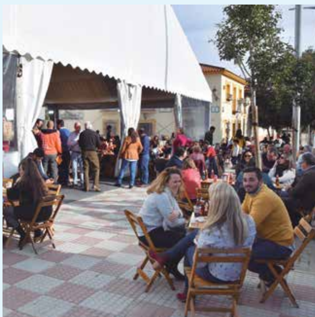
Muchos tomareños disfrutaron de dos días de convivencia