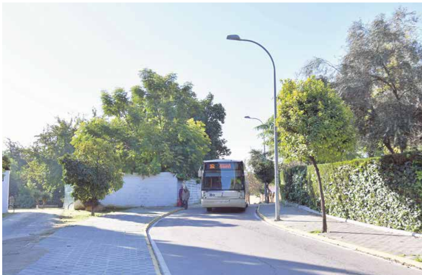
La calle Molino, en la actualidad, con un solo sentido de circulación

Tomares padece una situación de aislamiento en el transporte público al haber visto durante estos años cómo se le ha negado la conexión por metro con Sevilla o cualquier otra propuesta, por lo que el Ayuntamiento aprobó en 2016 redactar un plan de ordenación entre Tomares y San Juan para, al menos, facilitar el acceso a la parada de metro.