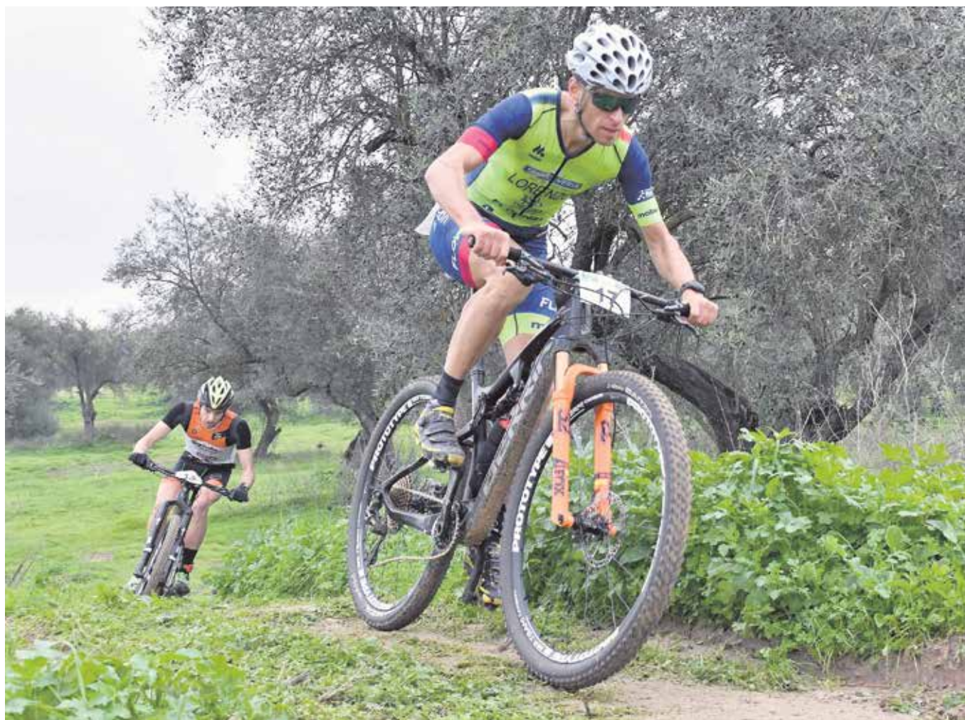
Dos participantes en el Duatlón Cros «Ciudad de Tomares» atraviesan a toda velocidad el Parque del Olivar del Zaudín

Con esta prueba, Tomares ha vuelto a ser sede de una competición de primer nivel, puntuable para el Campeonato de Andalucía.