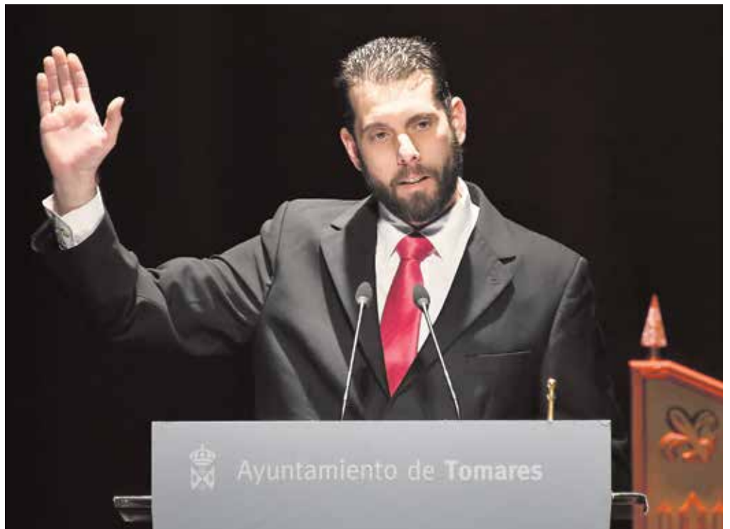
El pregonero tuvo palabras de agradecimiento para la Asociación de Reyes Magos Plaza de la Alegría

—Salud. Es lo más importante de todo, de nada sirve tener dinero y amor si no tienes salud.