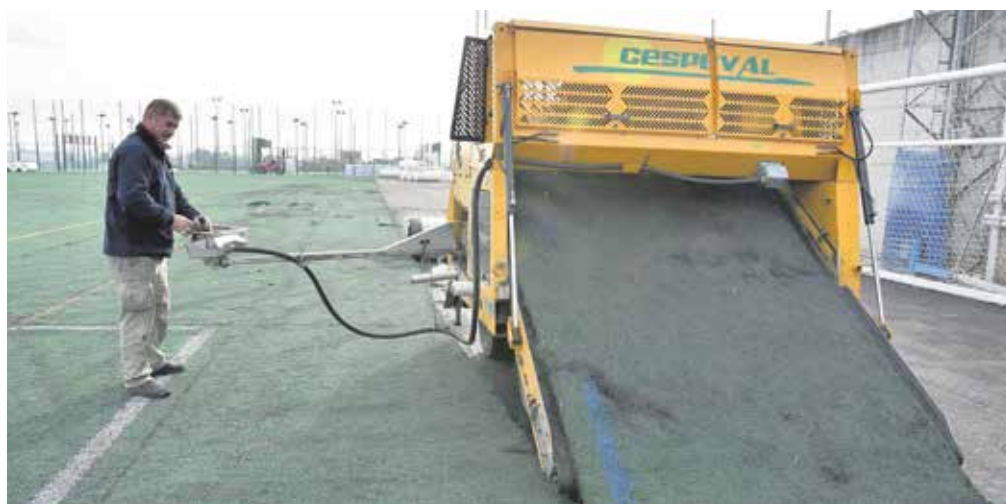
Procedimiento por el que se retira el césped antiguo

El proyecto tiene un presupuesto que ronda los 200.000 euros