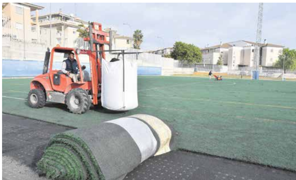
El nuevo césped artificial se coloca sobre una base elástica de 10 milímetros de espesor

El Estadio José Moreno «Pepillo» se encuentra dentro del Polideportivo Municipal Camino Viejo, fue inaugurado en febrero de 2009, convirtiéndose junto al de Mascareta, en el segundo del municipio, y con el objetivo de ampliar la oferta deportiva y ofrecer a los vecinos de Ciudad Parque y Santa Eufemia unas instalaciones cercanas a sus viviendas.