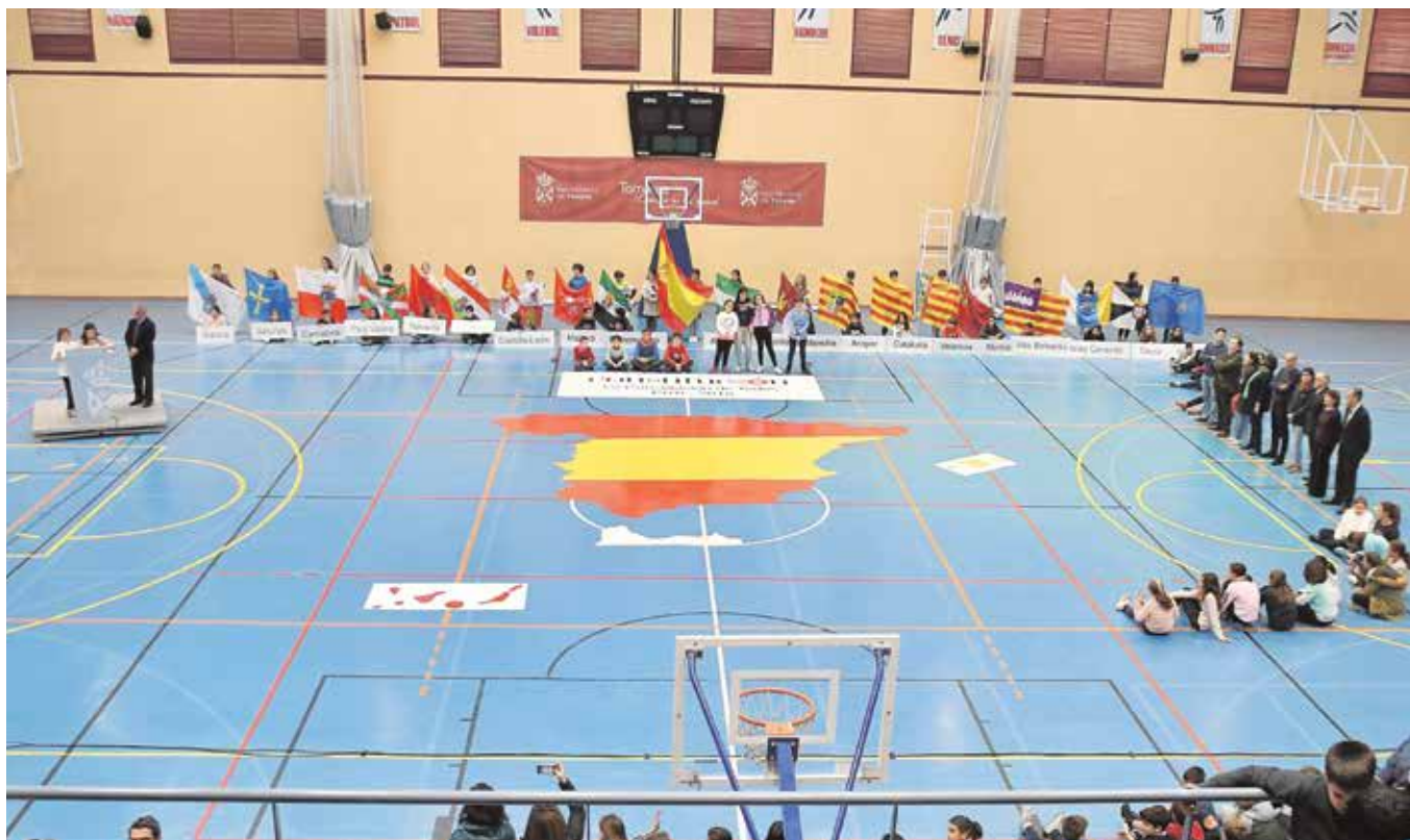
El Polideportivo Municipal Mascareta acogió el acto de conmemoración del 40 aniversario de la Constitución

Un gran puzle de enormes dimensiones, en el que los alumnos de los distintos centros educativos de Tomares fueron colocando las piezas de las 50 provincias españolas más Ceuta y Melilla, hasta formar el mapa de España con los colores de la bandera nacional, y donde también portaron las