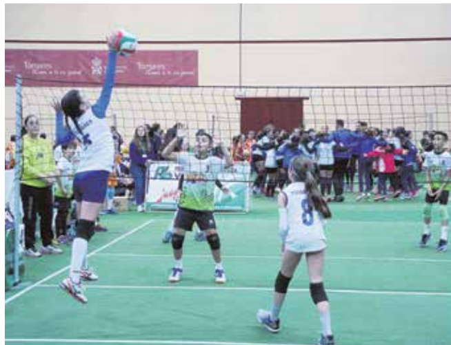
Campeonato de Andalucía Open Promesas disputado en Tomares

Con este fase final, Tomares vuelve a convertirse en el epicentro de este deporte en Andalucía, ya que en los últimos cuatro años, ha acogido hasta seis campeonatos de