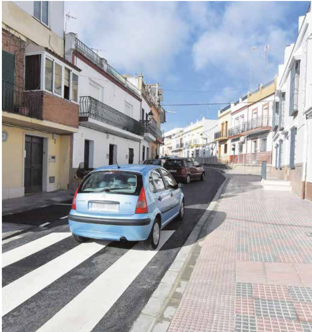
Reabierto al tráfico la calle Clara Campoamor, después de su renovación integral

También, se ha procedido al reasfaltado de la calzada con aglomerado asfáltico, se