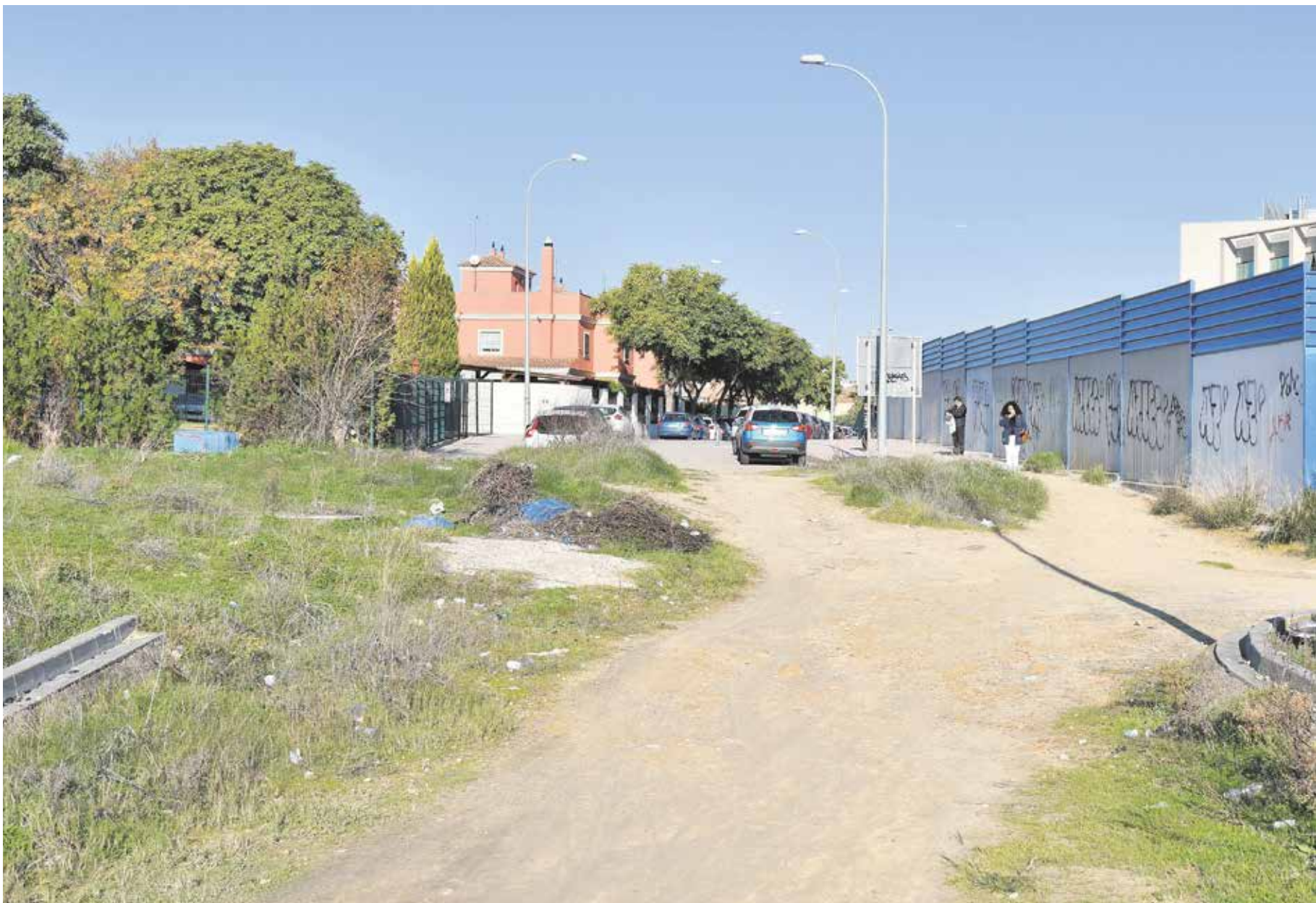
Estado actual de la zona que se reurbanizará para facilitar la conexión entre Tomares y la parada de metro de San Juan Alto, al final de la calle Isadora Duncan (Aljamar)

El proyecto prevé la urbanización de un tramo de 200 metros