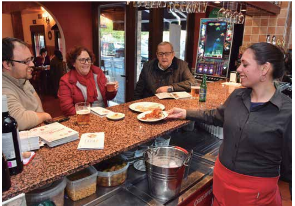
La cita goza de un gran prestigio en la provincia entre los amantes de la buena mesa

La cita, que goza de un gran prestigio en Sevilla entre los amantes de la buena mesa, y que es la más numerosa de la provincia por la gran cantidad de bares y restaurantes