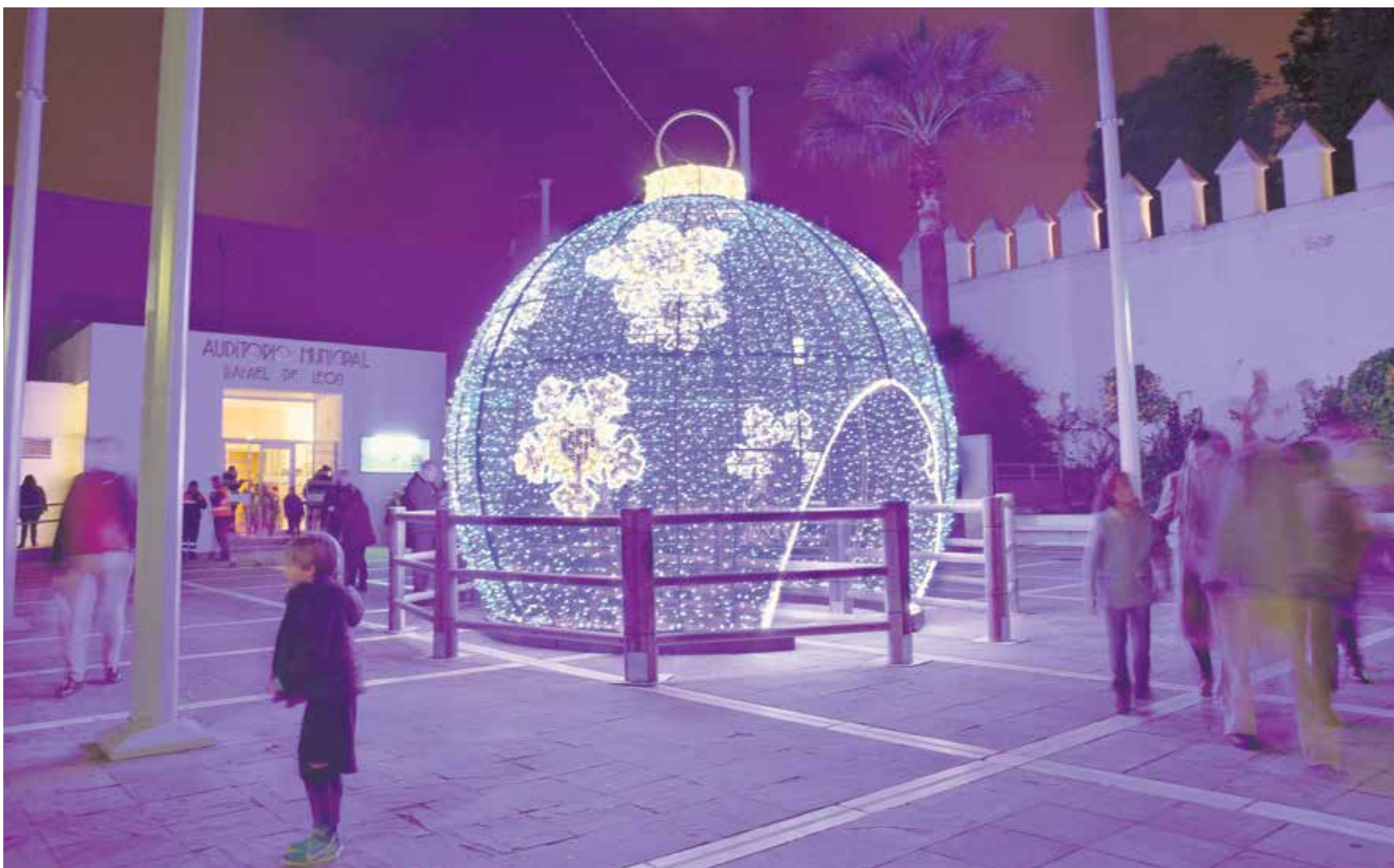
En la Plaza de la Constitución luce una gran bola transitable durante estas fiestas, una de las novedades de la iluminación navideña de este año