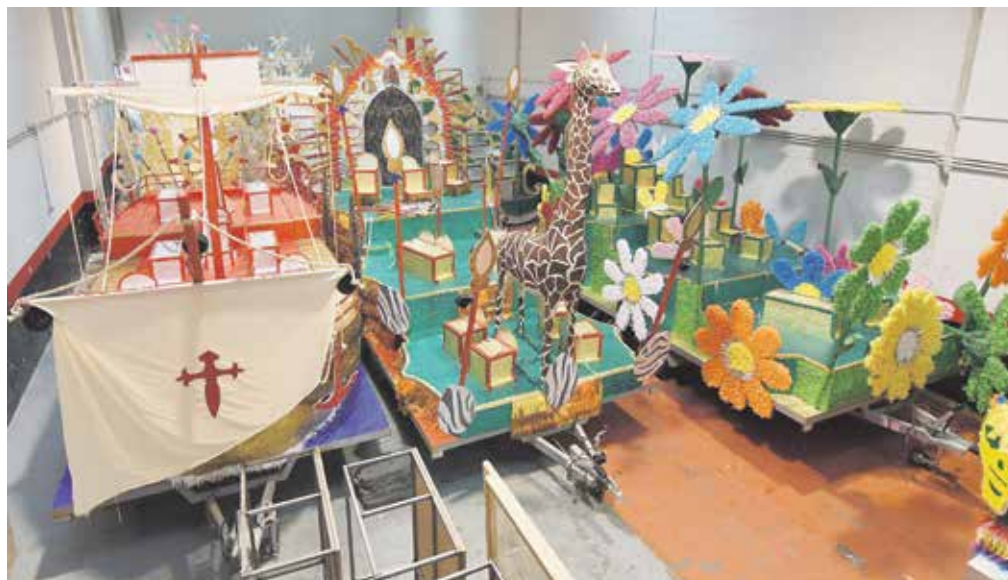
Una de las carrozas conmemorará la primera circunnavegación a la Tierra emprendida por Magallanes

que las carrozas estén todas preparadas para el gran día