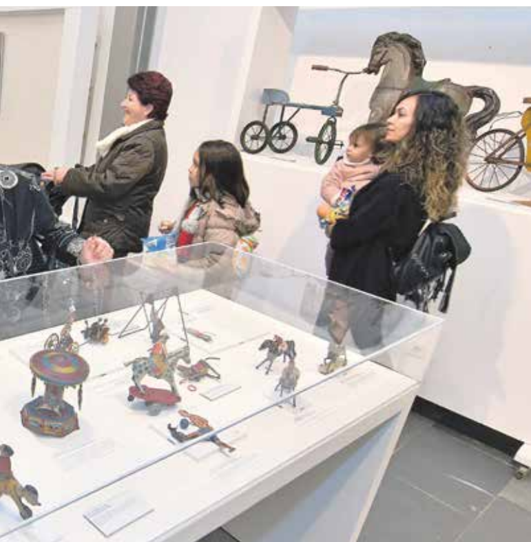
la Sala de Exposiciones del Ayuntamiento hasta el 10 de febrero