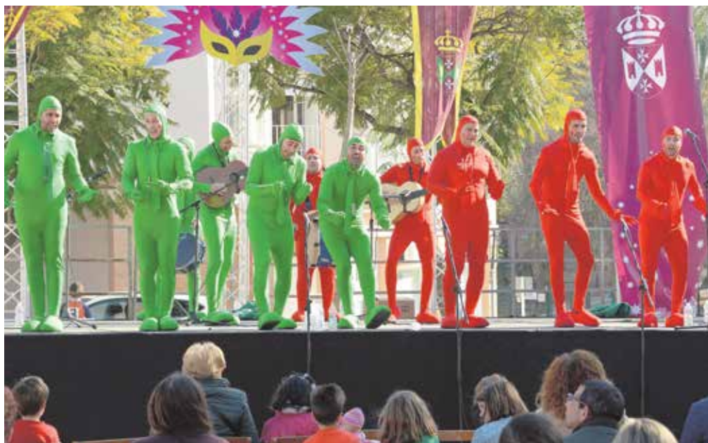
Actuación del año pasado de los chirigoteros tomareños «Ahora bajo que me estoy cambiando»