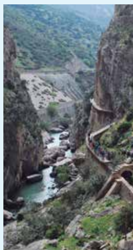
Caminito del Rey

Si quieres conocer uno de los paisajes más especta-