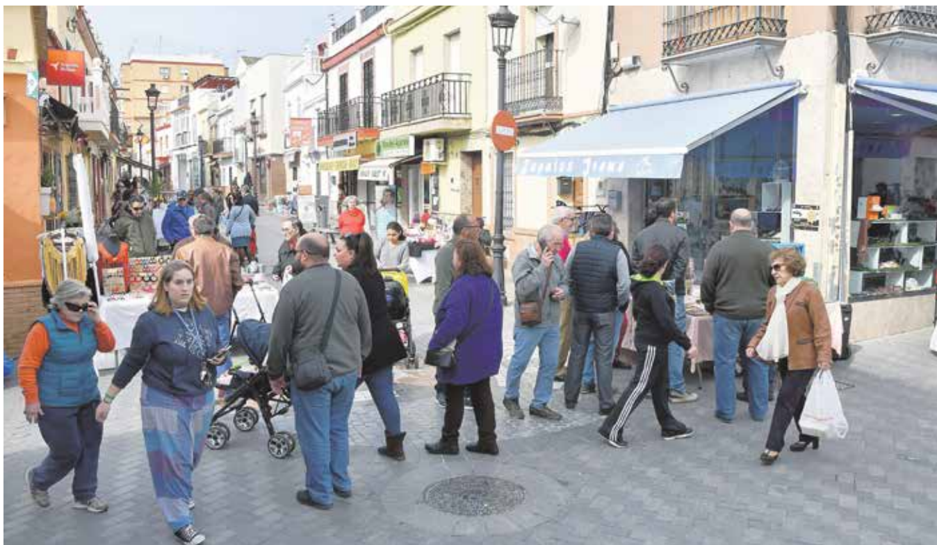
Concurrida vista de Las Cuatro Esquinas, centrica zona del municipio que se caracteriza por contar con muchos establecimientos