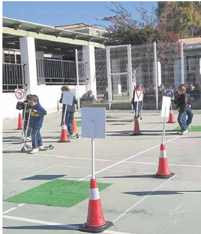
Los alumnos de un colegio practican las normas de circulación

Para hacer frente a este grave problema social y con el objetivo de prevenir los accidentes de tráfico, nace en Tomares hace dos años la empresa Street Smart con un proyecto pionero en España y Andalucía en educación vial bilingüe, un Plan Integral de Educación Vial para centros escolares que inserta la educación vial en el currículum académico de los niños desde Infantil y Primaria