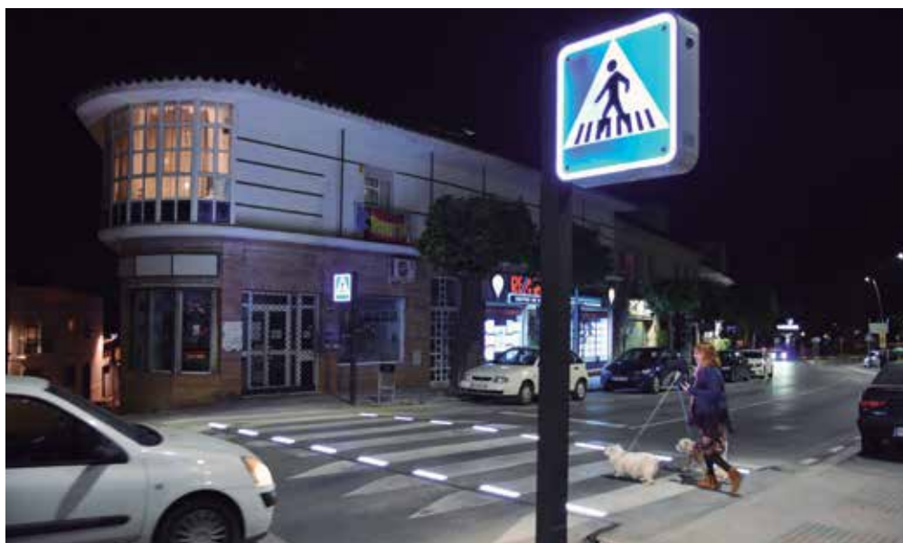
Uno de los nuevos pasos de peatones inteligentes luce ya iluminado en la Alameda de Santa Eufemia

El Ayuntamiento comenzó el lunes 25 de febrero las obras de los pasos de peatones inteligentes luminosos que se van a colocar en el municipio. Un proyecto con el que se pretende mejorar la señalización vial horizontal y vertical del municipio, incrementando la seguridad de los cruces peatonales no regulados por semáforos en las zonas de mayor afluencia de tráfico, con el objetivo de evitar accidentes.