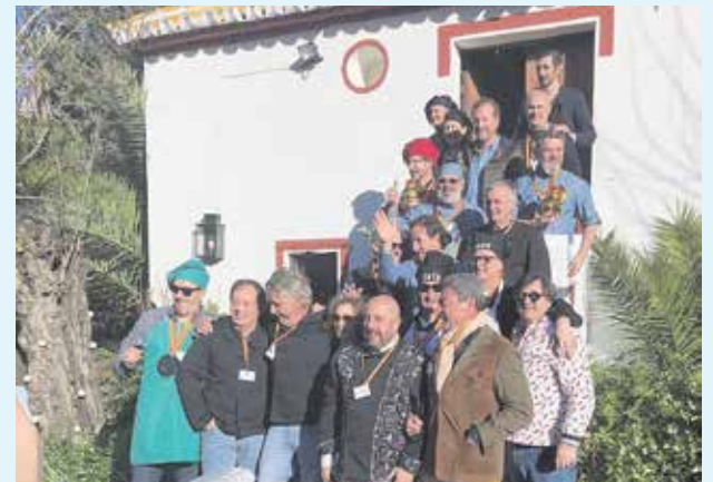
Miembros del jurado y los equipos participantes

Solo uno de los equipos participantes estuvo compuesto por mujeres, Rosana