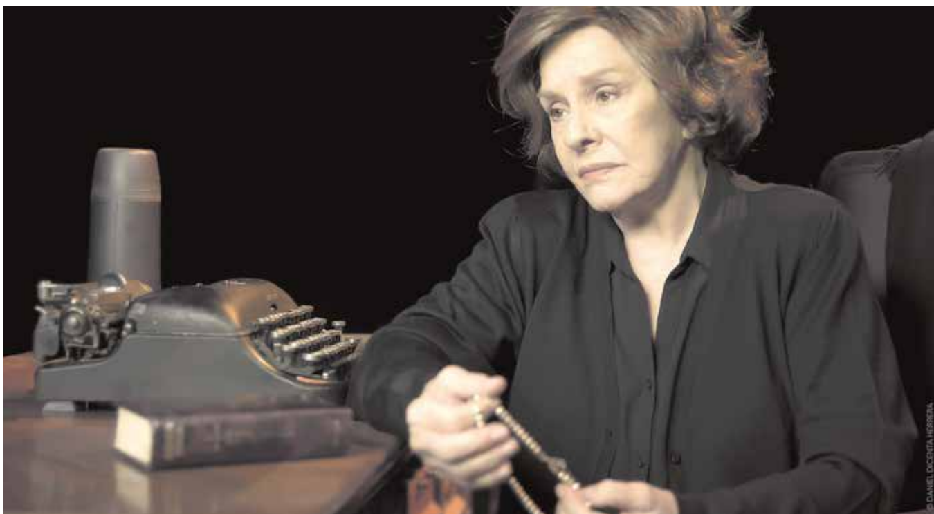
Lola Herrera, en el papel de Carmen Sotillo, en la obra «Cinco horas con Mario» con la que regresa a Tomares el próximo 9 de marzo