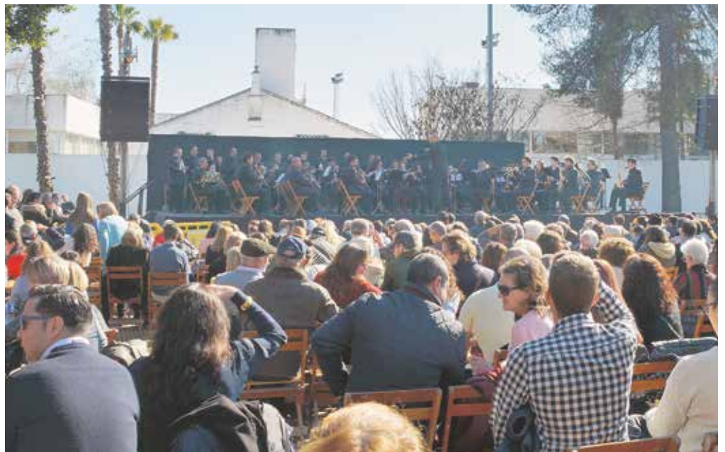
Ambiente que presentaban los Jardines del Conde el pasado 3 de

Por último, la encargada de cerrar el certamen fue la Banda de Cornetas y Tambores Ntra. Sra. de la Victoria, «Las Cigarreras». Además de la buena música, los asistentes pudieron disfrutar también de un ambigú con bebidas y viandas preparadas por miembros de la Cruz de Mayo de Tomares y de la Cruz de Mayo del Camino Viejo.