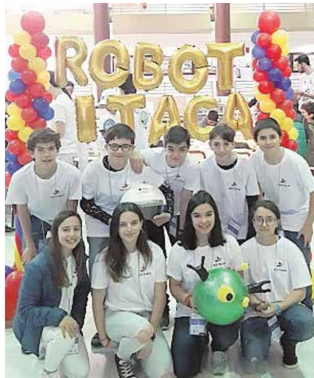
Los alumnos del equipo Robot Itaca in my Orbit

El instituto participaba con tres equipos en esta competición