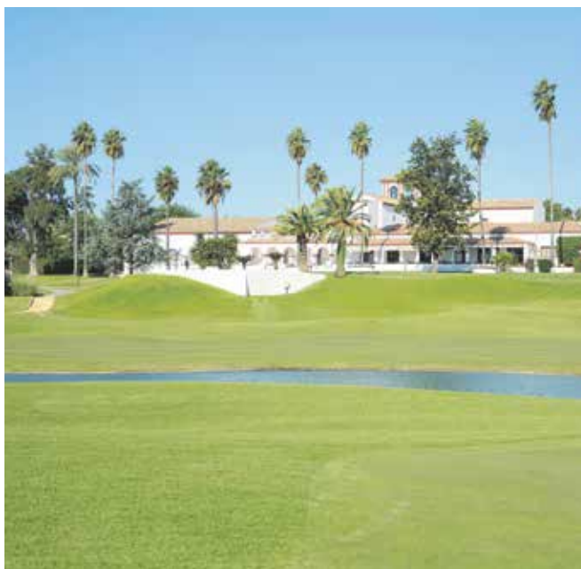
Vistas de las magníficas instalaciones del Club Zaudín Golf

La competición, puntuable para el Ranking Mundial Femenino y los Rankings Nacionales y Sub 18 Absoluto, no vio el asalto de la sueca Frida Kinhult