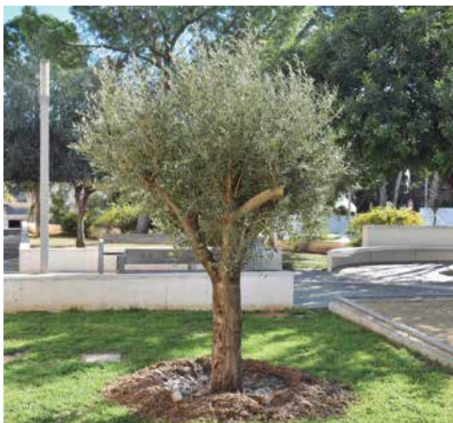
Olivo que se ha plantado en homenaje a las mujeres olivareteras