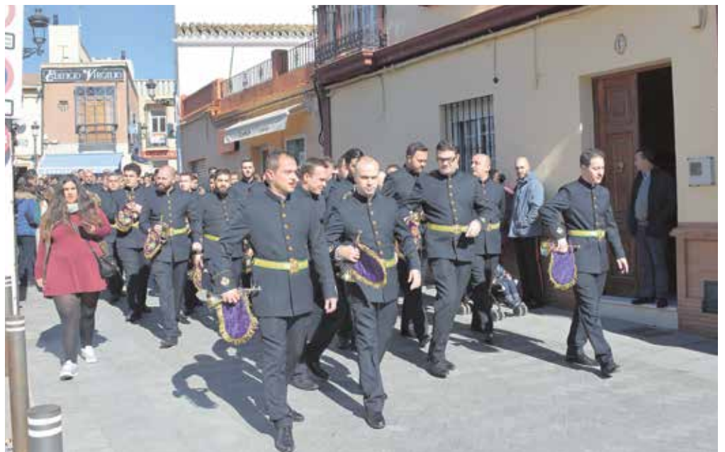
Desfile de una de las bandas participantes en el certamen por las calles de Tomares