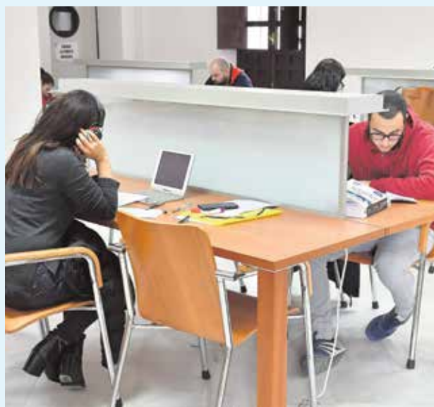
Varias personas disfrutando de las renovadas instalaciones

Precisamente, la envergadura y la antigüedad del edificio ha provocado que hayan aparecido complicaciones imprevistas. Mientras se prosiguen los trabajos de reforma que se esperan finalizar lo más pronto posible, el Ayuntamiento, en cuanto ha podido, ha abierto estas dos salas para facilitar el estudio a los vecinos de Tomares.