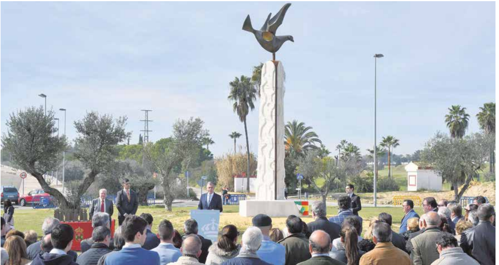
Numerosos vecinos y personas vinculadas con el Rocío acudieron al acto de inauguración de la escultura