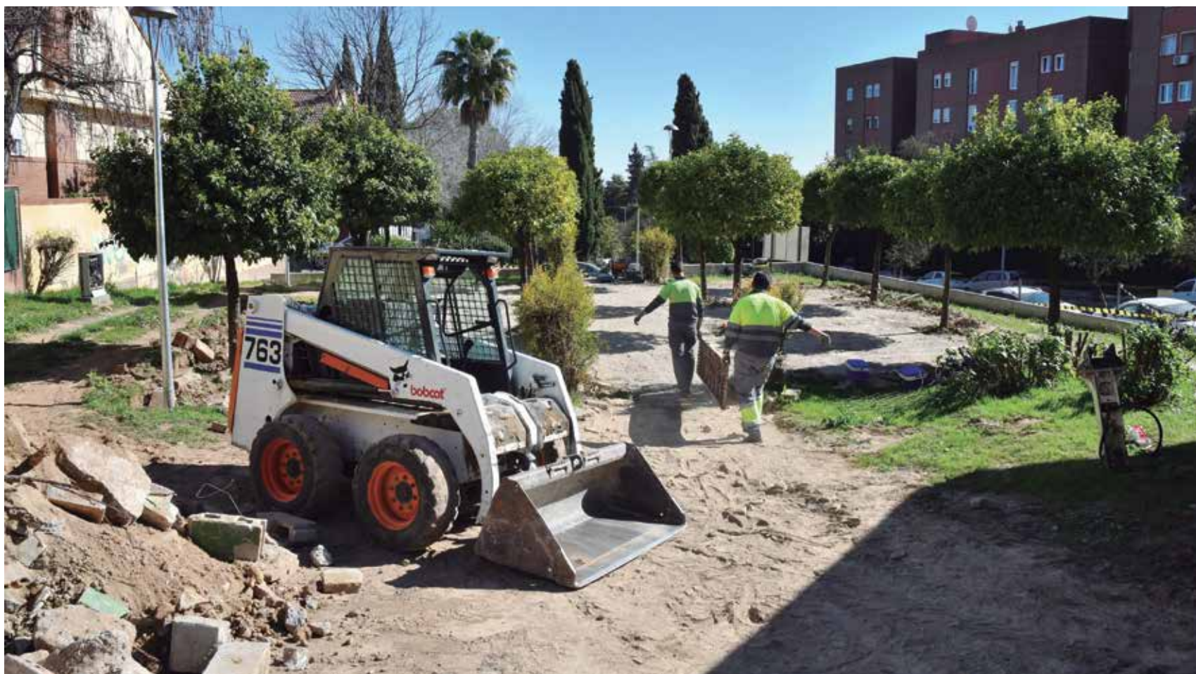
Ya han comenzado los trabajos de mejora en la plaza que llevará el nombre del artista plástico Félix de Cárdenas