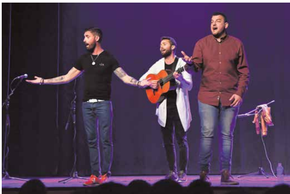
Un momento de la actuación de los carnavaleros gaditanos el pasado 15 de febrero

Presentado por el artista Paco Lola, reunirá sobre el escenario a las agrupaciones locales de Tomares: la chirigota de la Escolanía «Los que no se hartan de ABBA», la chirigota de la Grama «Sin ánimo de lucro», y las comparsas «Trece» y «Los veintegenarios». Actuarán la chirigota «La ciudad no es para mí» y el cuarteto del Morera «Aguita con nojotros», de Cádiz, y la chirigota de Alvarado «Los Dependientistas», de Sevilla.