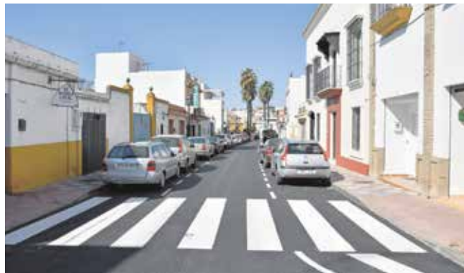
Vista de la calle Virgen de los Dolores, recientemente reasfaltada

pintura de la señalización horizontal de la calle Cordel Triana-Villamanrique y de la Rotonda Glorieta El Zaudín y Puerta de la Marisma, junto al Parque