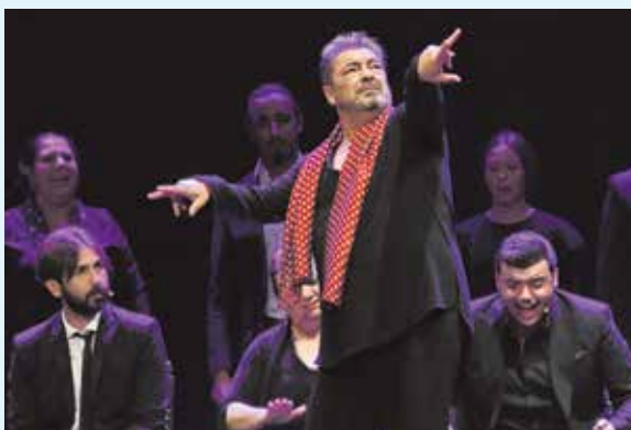
Antonio Canales, en un momento de su actuación