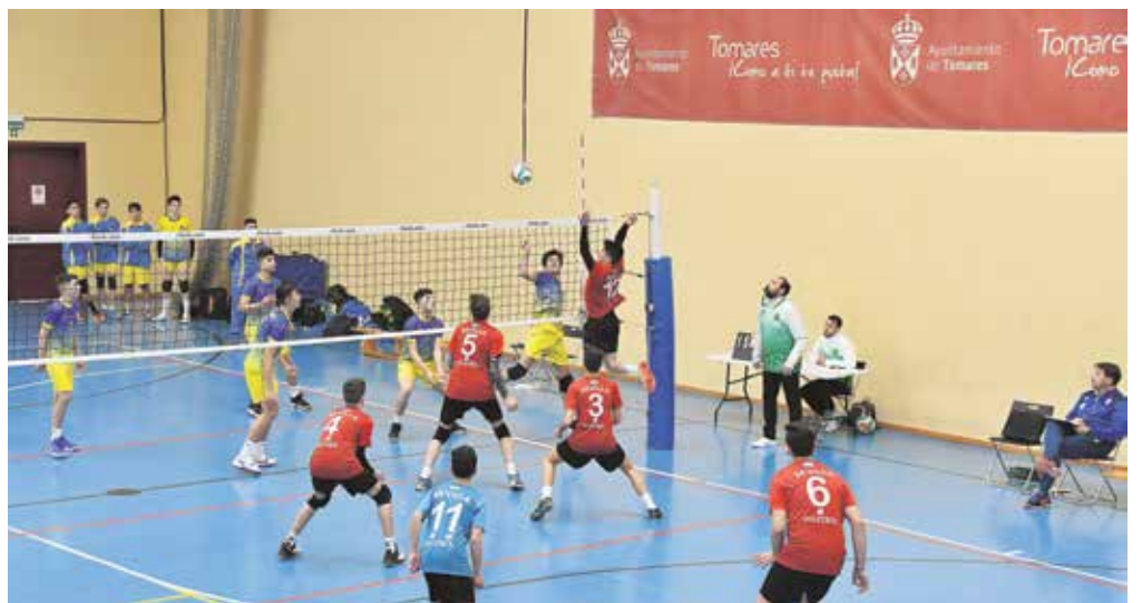
Uno de los partidos disputados en este torneo por la Selección Masculina de Sevilla