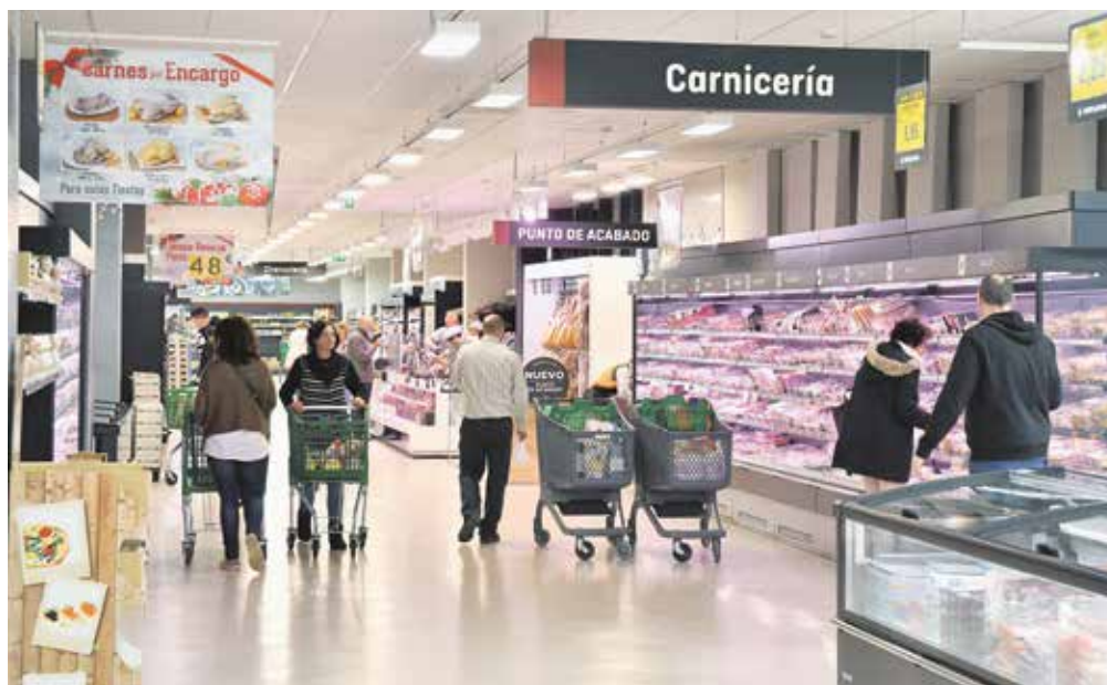
Interior reformado del supermercado Mercadona en Casino Aljarafe

Además, el supermercado de Tomares dispone, entre otras