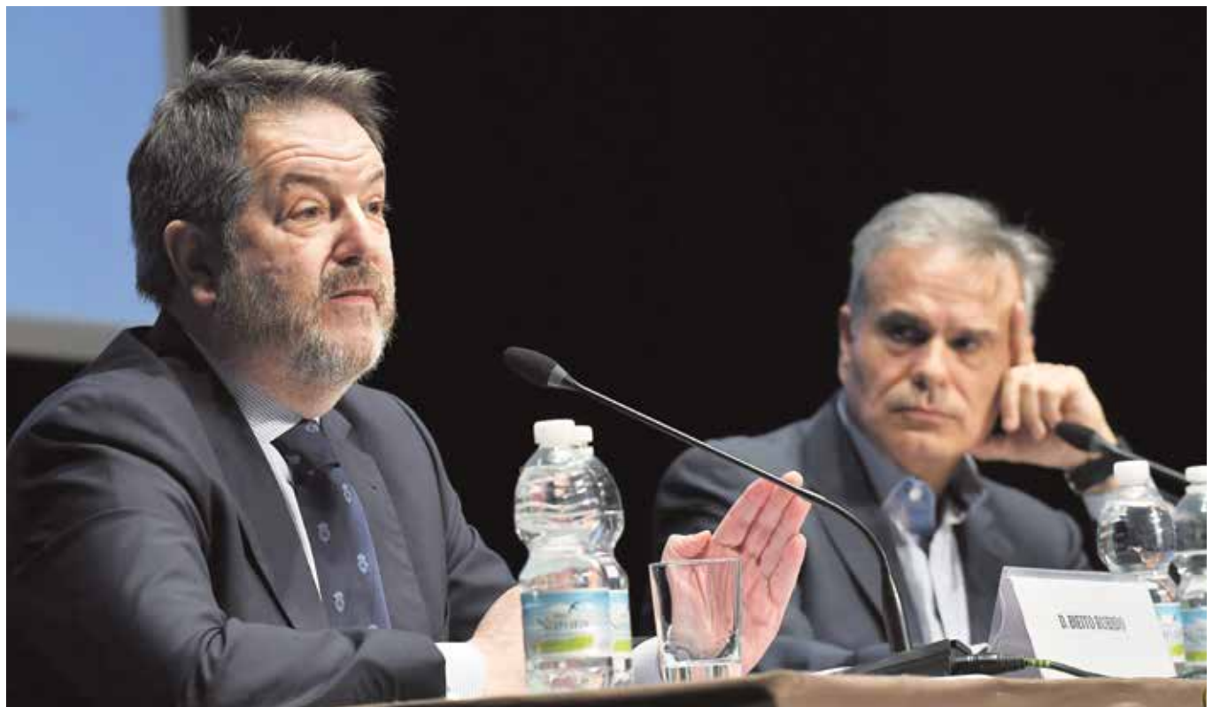
El director de ABC, Bieito Rubido, defendió en su intervención que España es un gran país