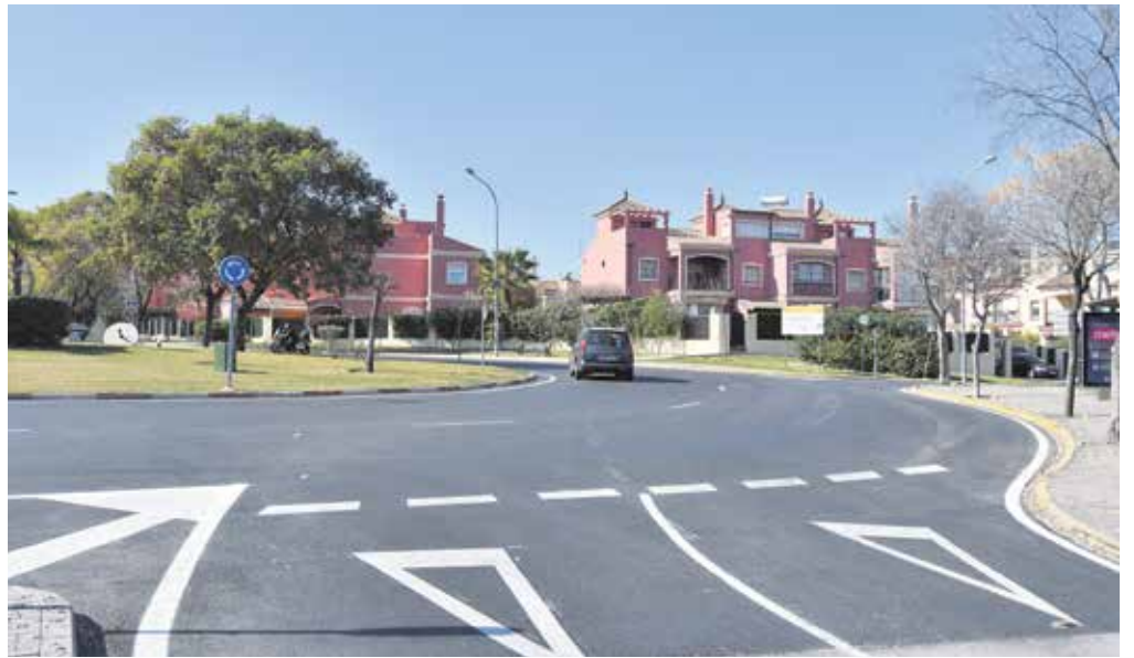
Estado actual de la Rotonda de la Luz, tras la intervención de mejora

La empresa adjudicataria del reasfaltado ha acometido también diversas mejoras como la