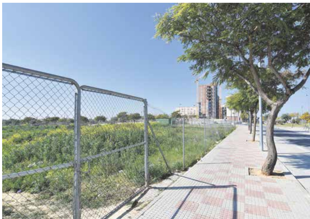
Terrenos en los que se construirá el nuevo colegio situados en la Avenida de la Aurora

El nuevo colegio, que debería entrar en funcionamiento en el curso 2020-2021, es la solución que necesita el municipio ante la falta de plazas escolares, ya que,