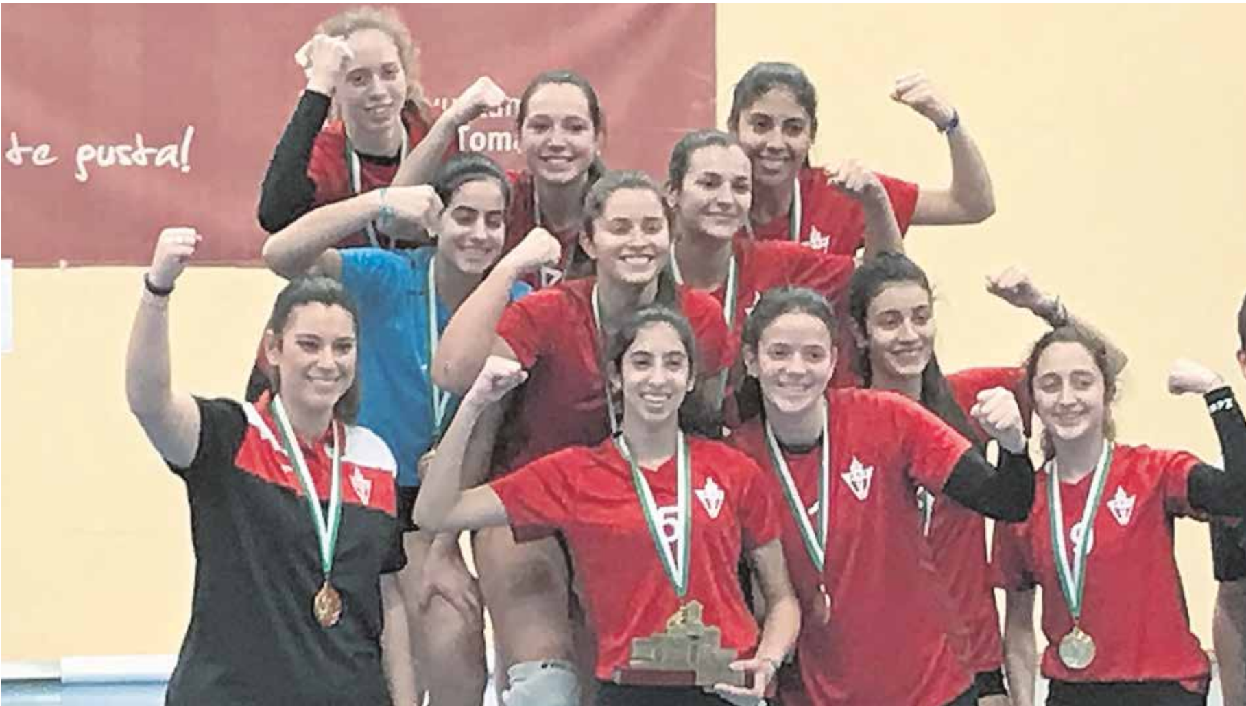
Las jugadoras y el primer entrenador del equipo femenino cadete de la Selección de Sevilla de voleibol celebran la victoria en el pódium