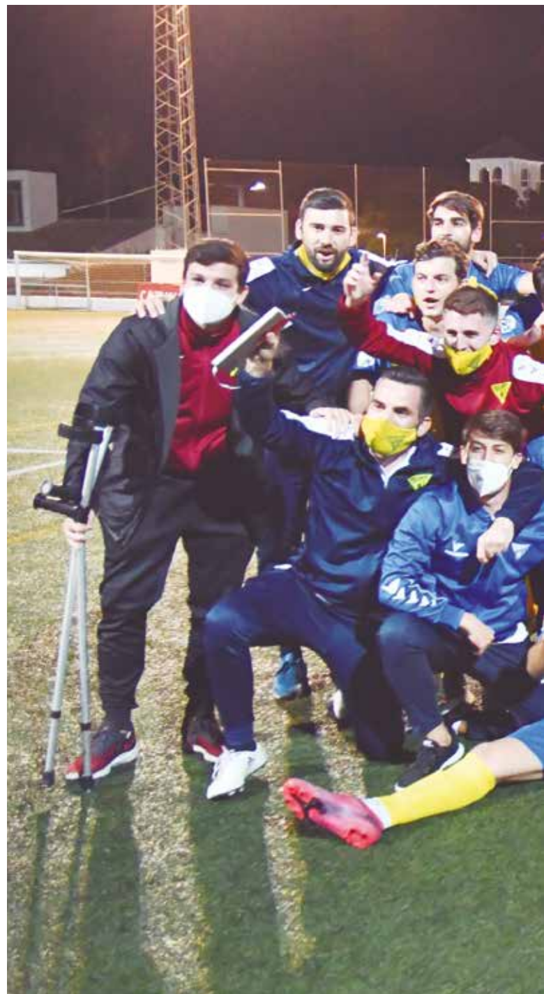
La plantilla completa de la Unión Deportiva Tomares celebró con gran euforia