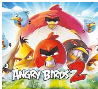
«Angry birds 2», el 19 de diciembre