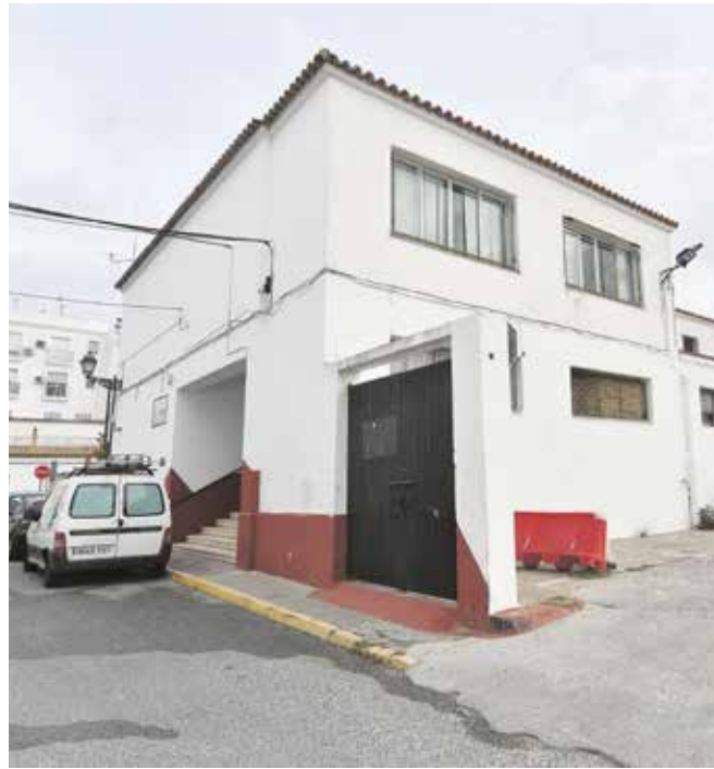
Aspecto actual del antiguo colegio Tomás Ybarra

La propuesta aprobada en el proyecto reúne dos requisitos muy importantes: uno, que