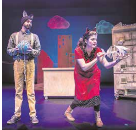
«Debajo del tejado», el 12 de diciembre