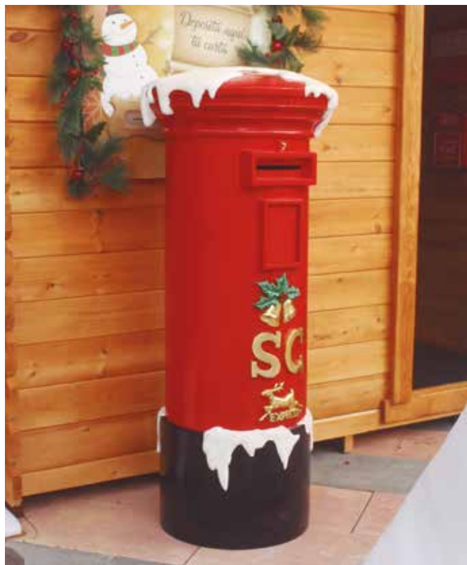
Buzón instalado en la Plaza del Ayuntamiento para las cartas a los Reyes

Se instalará un buzón para que los pequeños dejen sus cartas a los Reyes