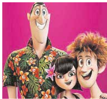
«Hotel Transilvania 2», el 8 de dic.