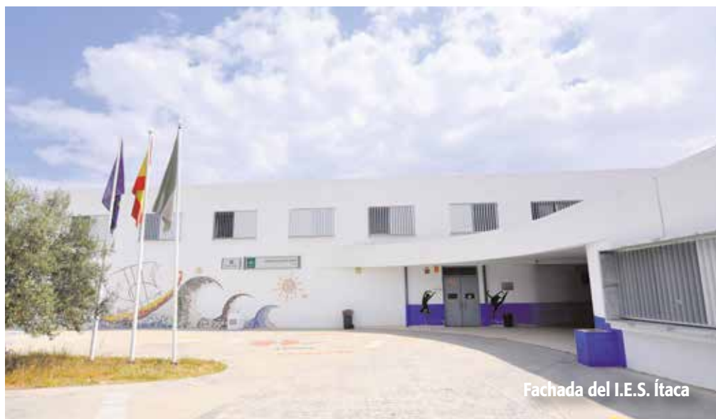
Fachada del I.E.S. Ítaca

La Ley Celaá ataca de manera muy grave a la libertad de los padres a la hora de elegir el centro educativo para sus hijos, discrimina la educación concertada porque no les gusta para los españoles, aunque sí para ellos o para sus hijos, acaba con la educación especial,