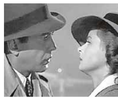
«Casablanca», el 21 de diciembre