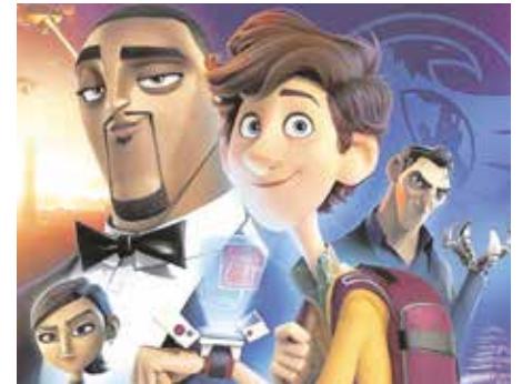
«Espías con disfraz», el 12 de diciembre