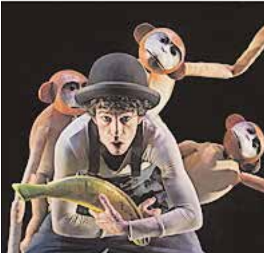
«Acróbata y arlequín», el 5 de diciembre