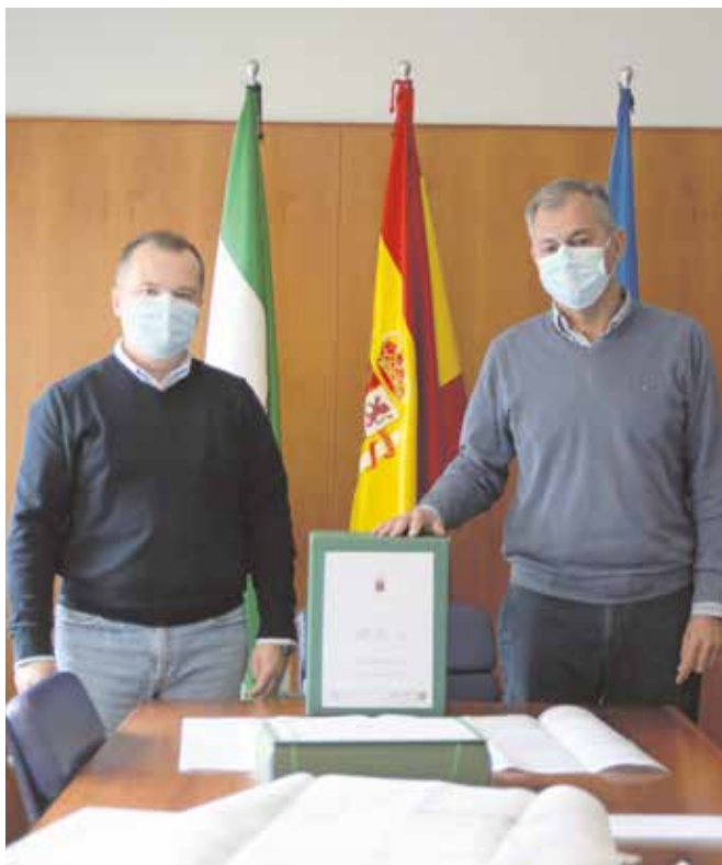
El concejal de Urbanismo y el alcalde presentando el proyecto

un año y medio, un proyecto que recupera dos edificios, el central del colegio, de dos plantas y que tiene una superficie construida de 1.855,33 m 2 , y el cubo, de tres plantas, de 562,74 m 2 , y el espacio abierto que al sumar las nuevas plazas públicas y calles adyacentes tendrá 4.000 m 2 .