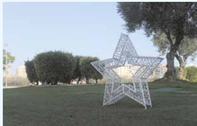
Decoración navideña ya instalada en la calle Aire

intensidad las principales calles. Además, 168 árboles y palmeras adornados con luces llenarán de alegría las principales avenidas, y se instalarán abetos de 10 metros de altura en las principales rotondas.