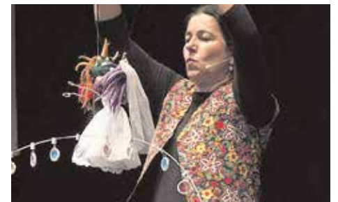
«La boda de la pulga y el piojo», el 28