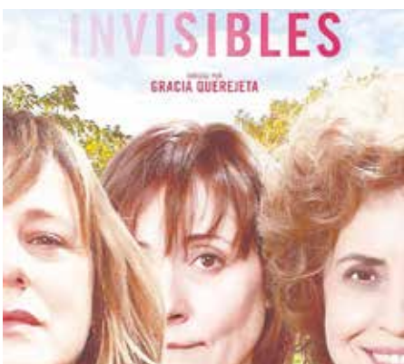
«Invisibles», el 15 de diciembre