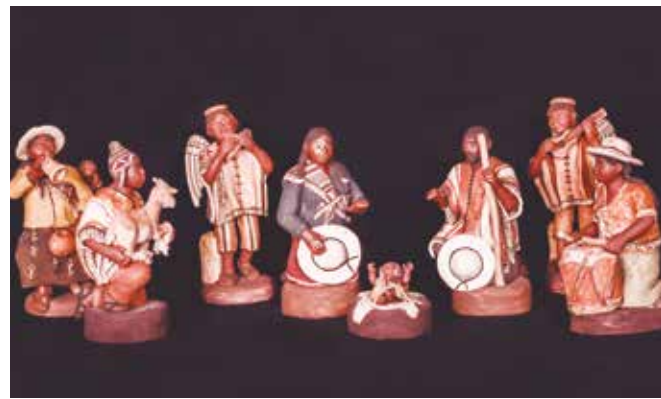
Uno de los 55 belenes internacionales que serán expuestos

Pertenecientes a una colección privada que trae la Fundación Educa, pocas veces vista