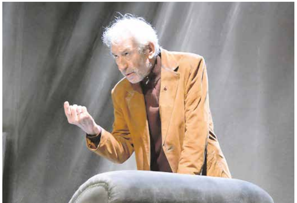
José Sacristán deslumbró sobre las tablas del Rafael de León con «Señora de rojo sobre fondo gris»

-Diversión, amigos, terracitas al solito, muchos parques, rotondas, zonas verdes, una calidad de vida maravillosa... Tomares ha pegado un cambiazo. Recuerdo también muchas ferias de Tomares muy divertidas. Le tengo un cariño importantísimo a Tomares. Vivo en Madrid por necesidades de la profesión, pero si pudiera viviría en Tomares. Tomares es calidad de vida. Cuando hablo de Tomares, solo me salen cosas buenas.