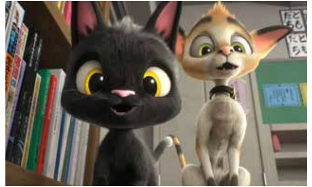
«Gatos. Un viaje de vuelta a casa», el 6 de diciembre