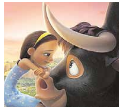
«Ferdinand», el 29 de diciembre