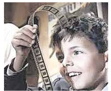
«Cinema paradiso», el 22 de dic.