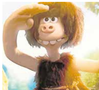
«Cavernícola», el 28 de diciembre