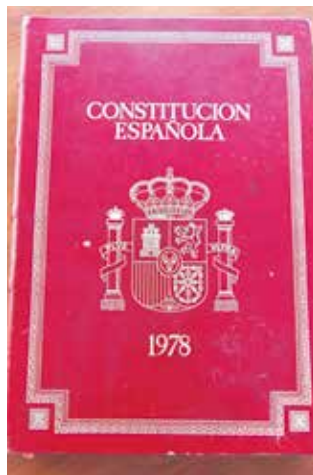
Constitución española de 1978

Los alumnos participarán mediante videoconferencias en tres concursos organizados en colaboración con Ciencia Divertida EdTech.