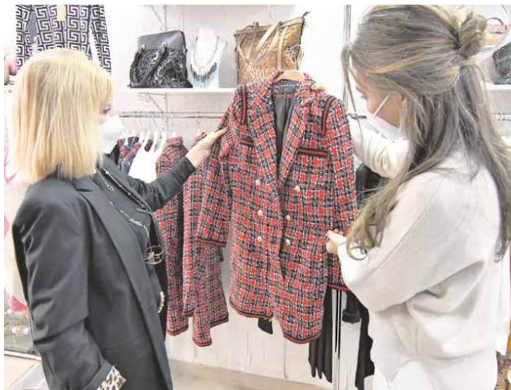
La campaña busca incentivar el consumo de comercios y servicios de los empresarios locales

Cada comercio o prestador de servicios podrá hacer una propuesta de su regalo o servicio estrella para esta Navidad, acompañada de una breve descripción de dicho producto o servicio, así como su precio. De este modo, los tomareños podrán disfrutar de los productos y servicios estrellas de