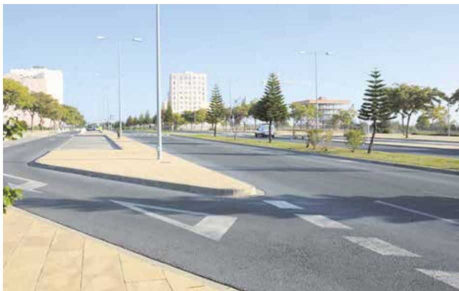
La calle Aire, en la imagen, es una de las que ha mejorado su iluminación

consistido en la renovación de todo el cableado por uno nuevo y en la puesta a punto de todas las luminarias de la zona. Por lo que, ya lucen completamente iluminadas las calles del Aire y de la Estrella, la Rotonda de la Malva, la Avda. del Lucero y la Rotonda de la Higuieruela.