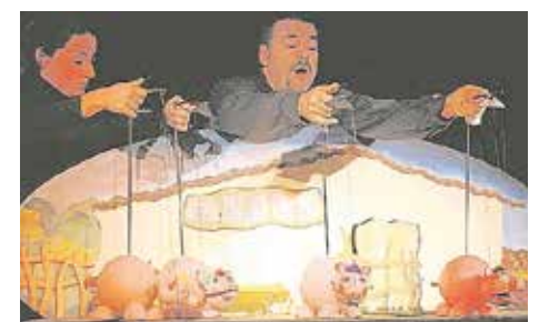
«Ópera en miniatura», el 4 de enero