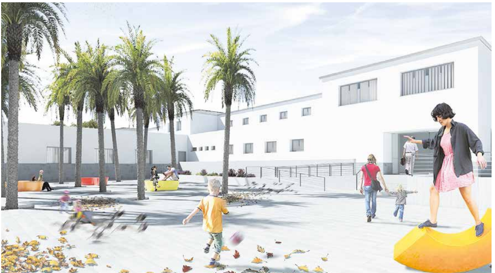
Recreación del aspecto que lucirá el antiguo colegio Tomás Ybarra tras su reforma integral y la reconversión de sus patios en plazas públicas

La rehabilitación del antiguo colegio Tomás Ybarra, cuya licitación e inicio de obra está prevista en 2021, tendrán un plazo de ejecución previsto de