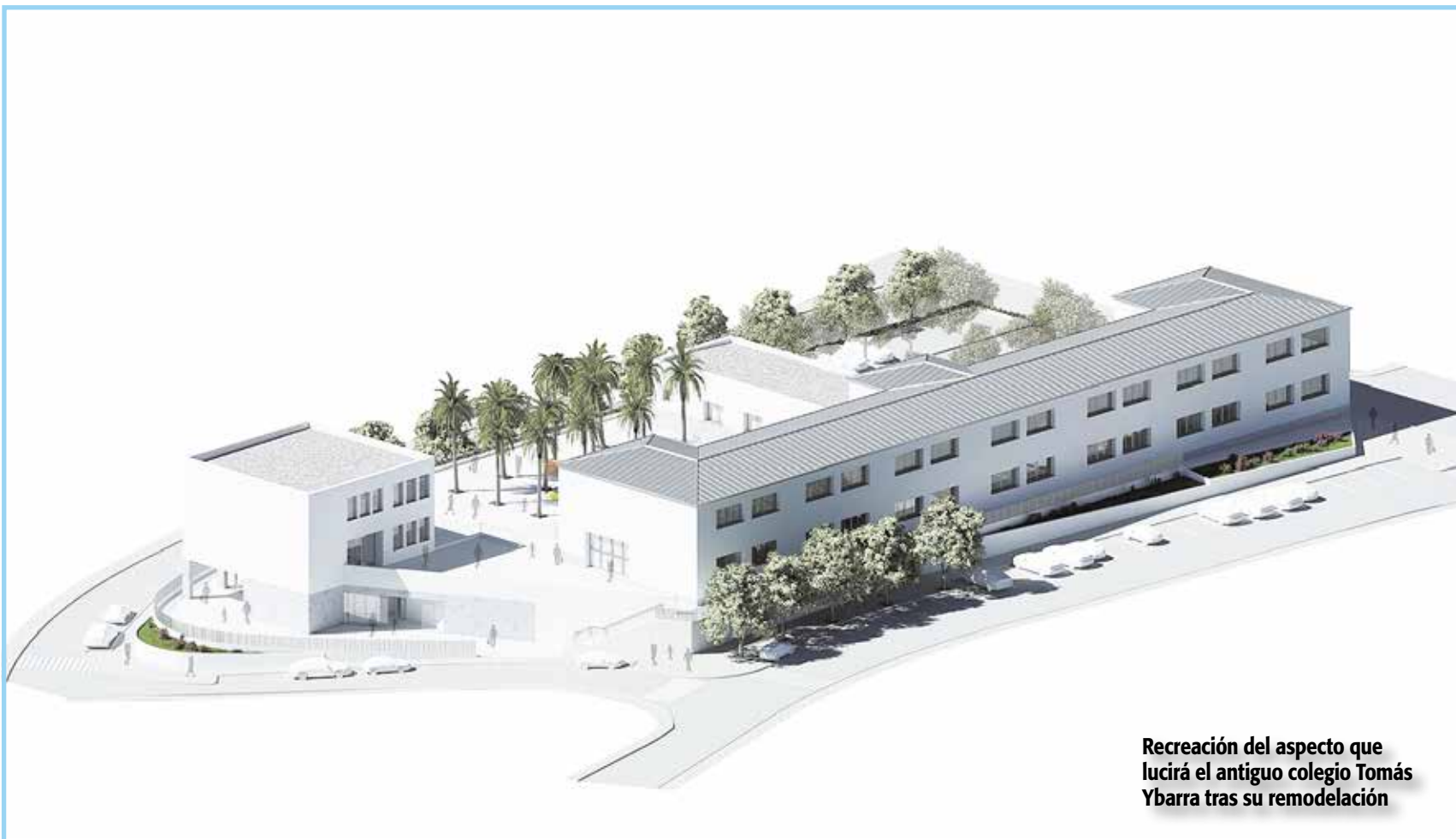
Recreación del aspecto que lucirá el antiguo colegio Tomás Ybarra tras su remodelación