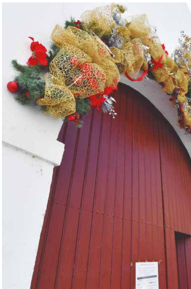
Fachada del Ayuntamiento, ya luciendo los adornos navideños, cuya plaza