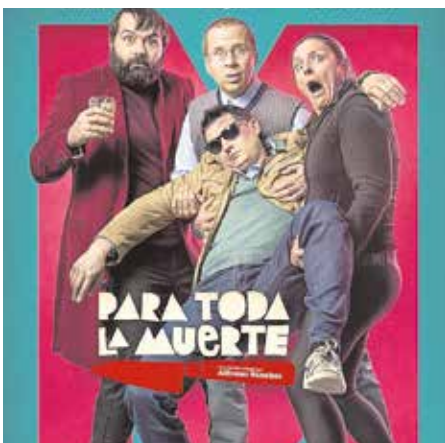
«Para toda la muerte», el 8 y el 16 de dic.

tura a los tomareños y fomentar el cine español y andaluz. Entrada: 2 euros, que se podrán adquirir en la taquilla del Auditorio Municipal (Plaza de la Constitución, s/n), de lunes a viernes, de 10 a 14 horas; y martes y jueves, también de 16 a 18 horas. Aforo limitado.