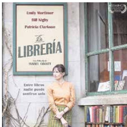
«La librería», el 14 de diciembre