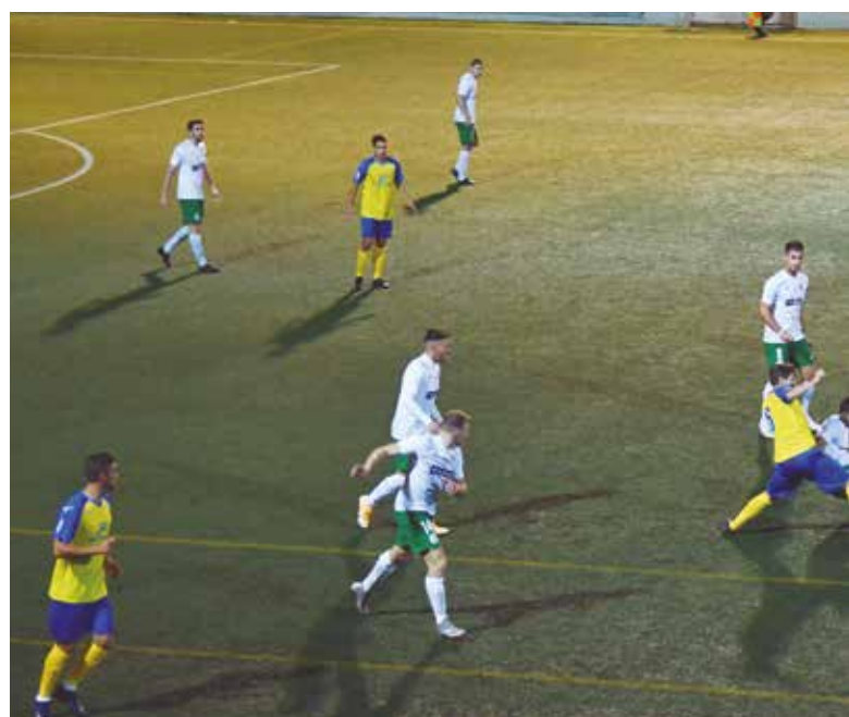
La UD Tomares mostró su superioridad en el terreno durante los 90 minutos