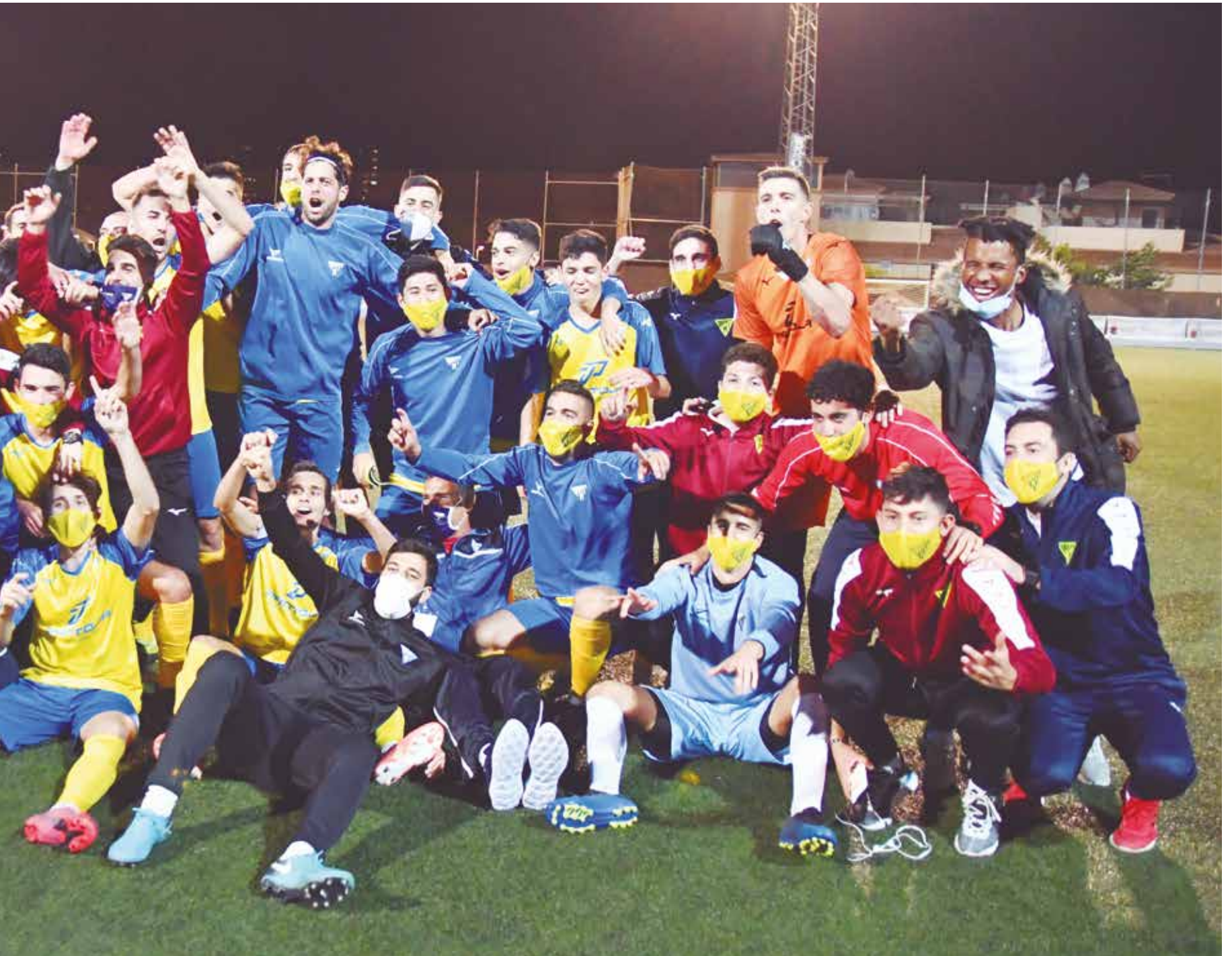
el importante triunfo ante el CP Chinato, que le permitirá, por primera vez en sus 44 años de historia, participar en esta importante competición de nivel nacional