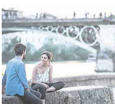
«Una vez más», el 17 de diciembre