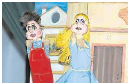
«Juancito y María», el 23 de diciembre

El divertido ciclo «Un mundo de títeres», llega por primera vez a Tomares, los días 23, 28 y 30 del mes de diciembre, y el 4 de enero, en el Patio de la Fuente del Ayuntamiento a las 12:30 horas, con un precio de entrada de un euro para niños y dos para adultos, y un aforo reducido a 60 plazas por las actuales condiciones sanitarias. La venta de entradas será dos horas antes del inicio de los espectáculos en la taquilla del Auditorio por riguroso orden de llegada. Podrán disfrutar de las mejores obras de títeres de compañías como Flash Teatro, La gotera de la azotea, Siesta Teatro o Búho Teatro.