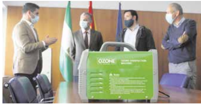
En primer plano, una de las máquinas donadas por Eviranspain