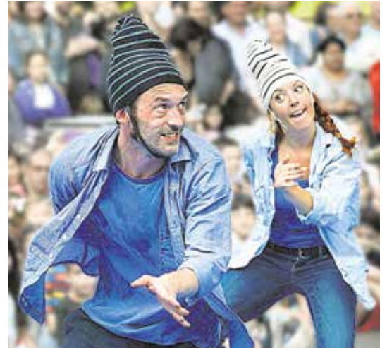
«Crusoe», el 19 de diciembre