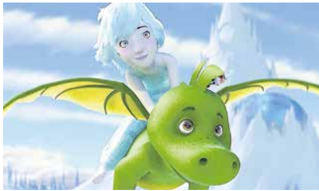
«Tabaluga y la princesa de hielo», el 5 de diciembre

El mejor cine infantil y familiar llega a Tomares, donde se proyectarán hasta diecisiete películas de gran calidad en el Auditorio Municipal Rafael de León, para el disfrute de los más pequeños y también mayores, con entrada gratuita. Desde el día 5 de diciembre hasta el 8, aprovechando el puente, las películas comenzarán en horario de 16 horas. A partir del 12 de diciembre, las películas se proyectarán en el mismo lugar pero comenzarán a las 17 horas. Además, los amantes del buen cine están de enhorabuena porque podrán ver grandes clásicos del séptimo arte, como Casablanca o Cinema Paradiso, los días 21 y 22, también en el Auditorio Municipal con entrada gratuita, a partir de las 18 horas.