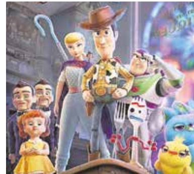
«Toy story 4», el 20 de diciembre