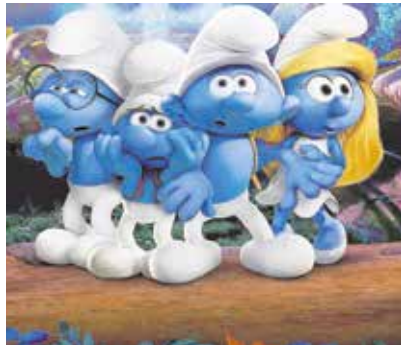
«Los pitufos. La aldea escondida», el 7