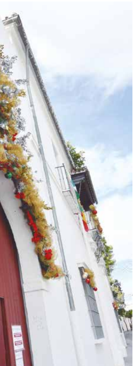
albergará diversas actividades