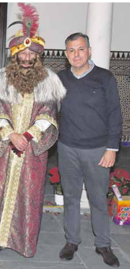
SS.MM. los Reyes Magos de 2019