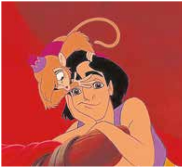
«Aladdín», el 13 de diciembre