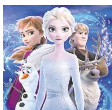
«Frozen II», el 3 de enero