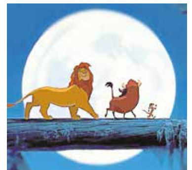
«El Rey León», el 30 de diciembre