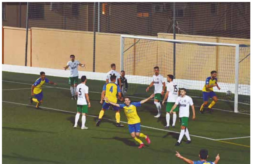
Los delanteros de la UD Tomares celebran uno de los tres goles que encajaron al CP Chinato

Falcón: «Cualquier cosa puede pasar en la siguiente ronda»