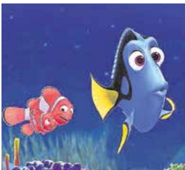
«Buscando a Dory», el 27 de dic.