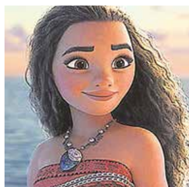
«Vaina», el 31 de diciembre