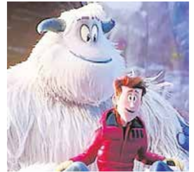
«Smallfoot», el 26 de diciembre