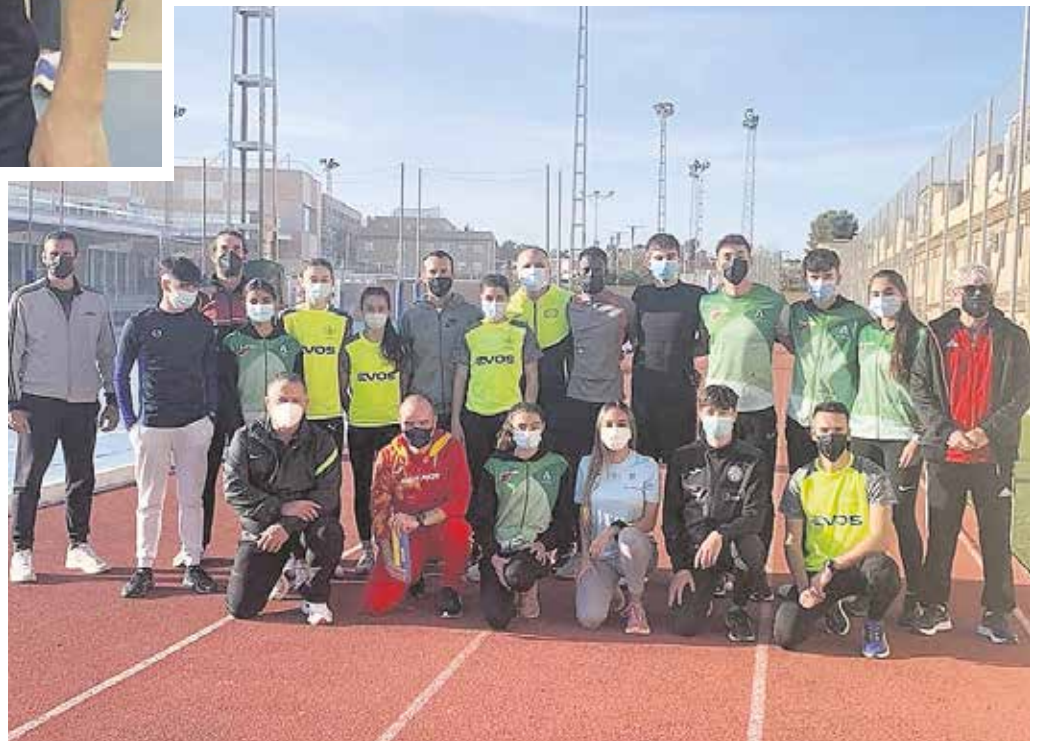
Deportistas en la concentración de velocidad del Programa de Tecnificación Deportiva

Éxitos importantes para el atletismo tomareño que demuestran el importante arraigo de este deporte en el municipio. Fruto de ello fueron las concentraciones de velocidad del Programa Nacio-