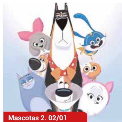
Mascotas 2. 02/01