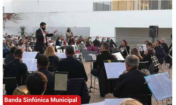
Banda Sinfónica Municipal

No ha faltado esta Navidad oportunidad para disfrutar del talento musical local gracias a los conciertos de la Banda de Iniciación, la Sinfónica Municipal, la Escolanía, la Polifónica y el Coro de Campanilleros.