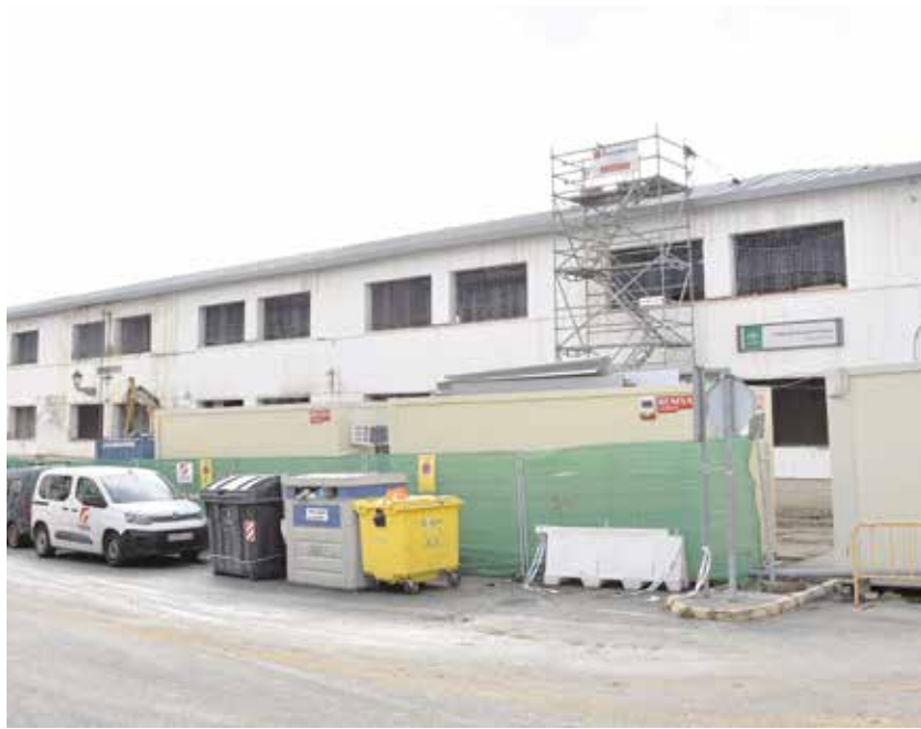
Aspecto actual de las obras en el antiguo colegio Tomás Ybarra