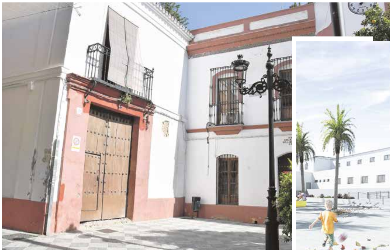
Hacienda Montefuerte y recreación del aspecto que lucirá el antiguo colegio Tomás Ybarra