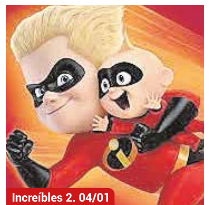
Increíbles 2. 04/01

El Auditorio Municipal Rafael de León seguirá acogiendo el mejor cine infantil a las 18:00 horas para entretener las tardes de los más pequeños y pasar un buen rato en familia. “Frozen II” (29 de diciembre), “La familia Adams” (30 de diciembre), “Mascotas 2” (2 de enero) y “Los Increíbles 2”