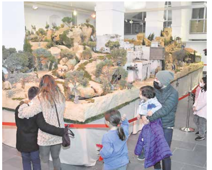
Imágenes con algunas de las actividades navideñas de este año: nieve simulada en la Plaza del Ayuntamiento, buñuelos, buzón para las cartas de los Reyes Magos y el Gran Belén Monumental que puede visitarse en la Sala de Exposiciones