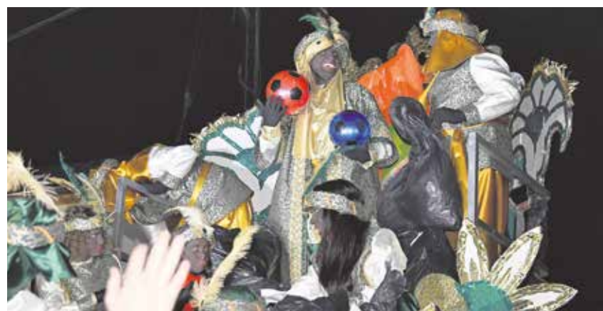
Los Reyes Magos irán por lugares amplios como la Avenida del Aljarafe

SS. MM. MELCHOR, GASPAR Y BALTASAR SALDRÁN AL ENCUENTRO DE LOS VECINOS TRAS UN AÑO SIN PODER PASEAR POR EL MUNICIPIO Y CON UNA DE LAS DIEZ CARROZAS DEDICADA A LOS HÉROES QUE HAN LUCHADO CONTRA EL COVID