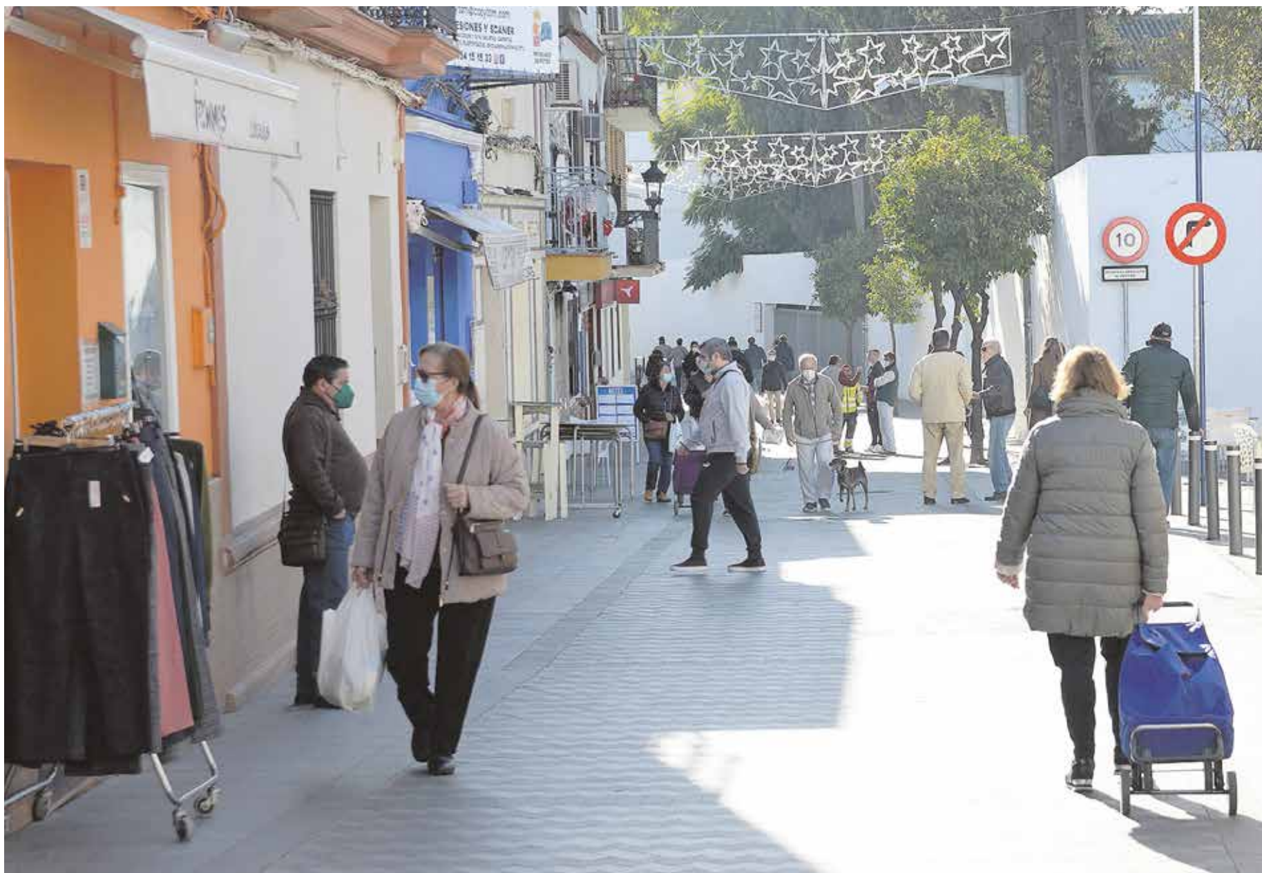
Vecinos del municipio pasean y realizan sus compras por el centro, en la calle De la Fuente