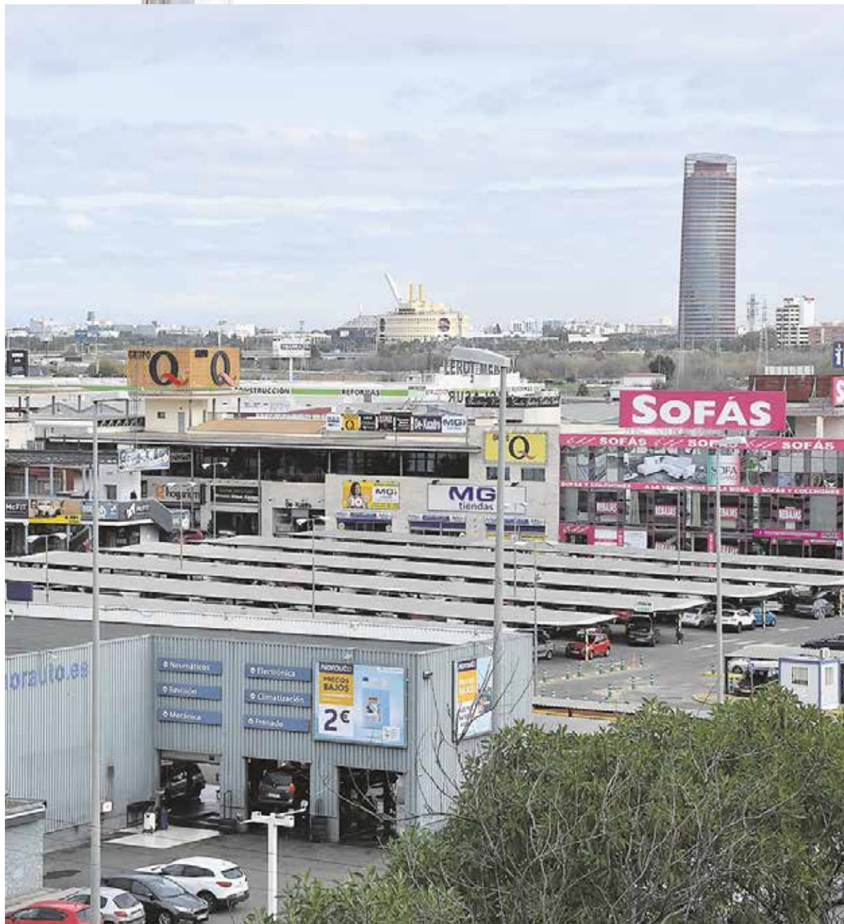
Vista panorámica del Parque Empresarial El Manchón, uno de los centros del tejido empresarial tomareño

Los participantes recibirán una beca o consignación económica de 18 euros por día. Los requisitos de acceso son ser mayor de 18 años, estar empadronado en Tomares e inscrito como demandantes de empleo en el SAE, con formación reglada mínima ESO o equivalente. El curso, que tiene previsto comenzar en febrero, contará con una primera edición de lunes a viernes, de 9:00 a 14:00 horas, y la segunda, de lunes a viernes, de 16:00 a 21:00 horas.