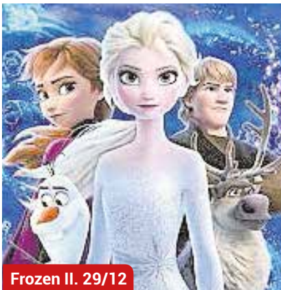
Frozen II. 29/12