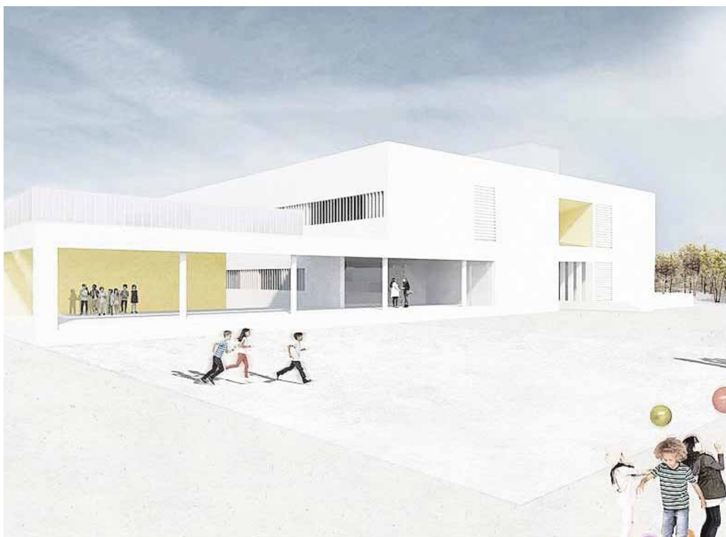
Recreación virtual del nuevo colegio que estará junto a la Avenida de la Aurora, la nueva zona de expansión de Tomares

La construcción de este nuevo centro educativo en Tomares está incluida dentro del Plan de Infraestructuras Educativas de la Consejería de Educación y Deporte, que se ejecuta a través de la Agencia Pública Andaluza de Educación.