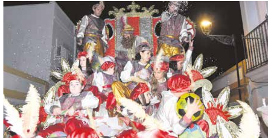
La Cabalgata saldrá desde la Avda. del Aljarafe, a la altura de la Rotonda del Agua