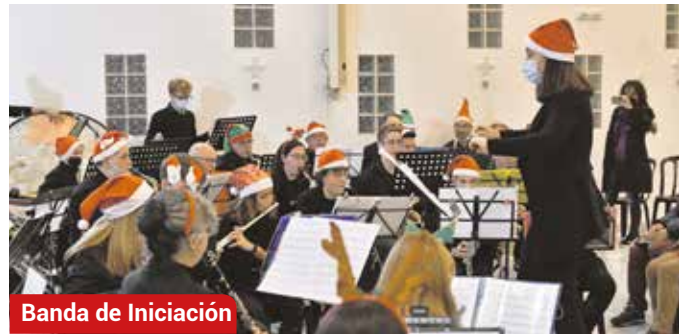
Banda de Iniciación