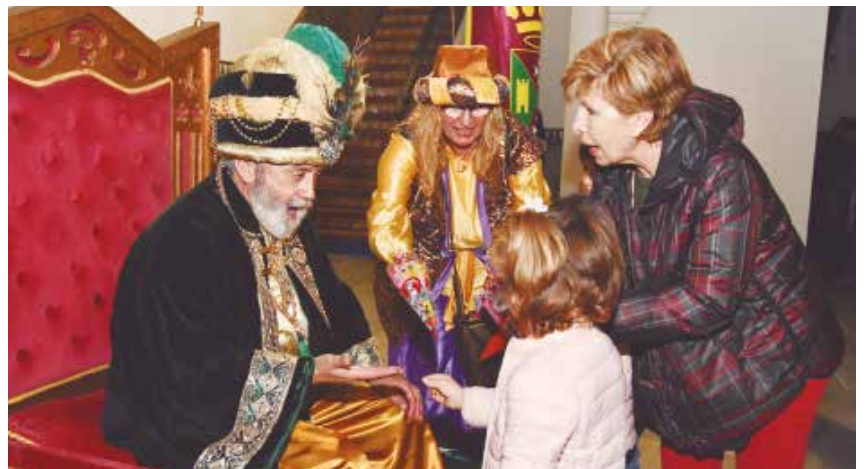
El Herald Real saldrá del Pabellón Municipal Mascareta e irá por grandes avenidas

La Cabalgata se desarrollará siguiendo todas las medidas anti-Covid que sean recomendadas en ese momento por las autoridades sanitarias.