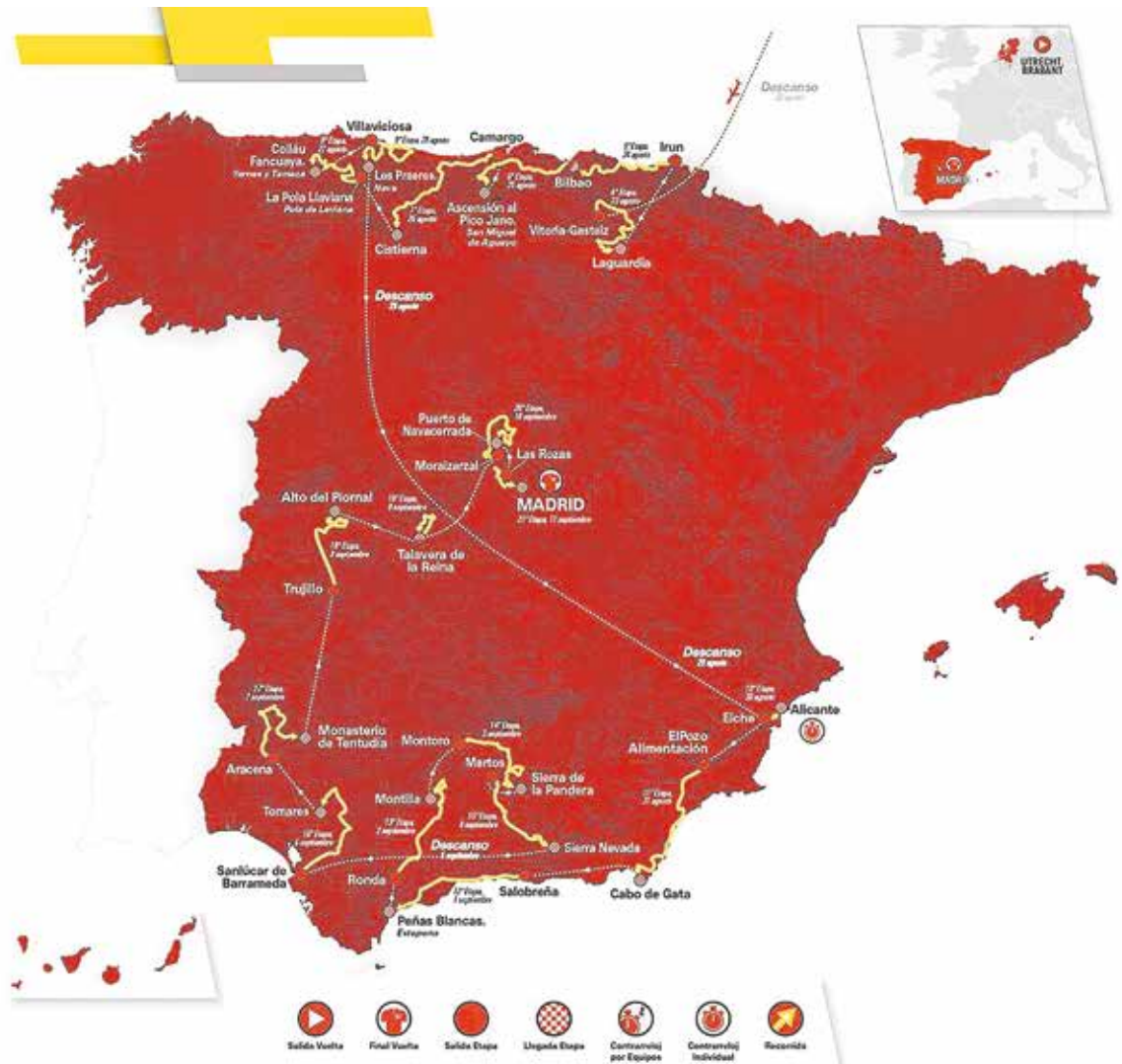
Mapa con la ruta que seguirá La Vuelta 2022, que se iniciará en los Países Bajos

LOS VECINOS VOLVERÁN A TENER LA OCASIÓN DE VIVIR DE CERCA ESTA CITA DEL DEPORTE DE ÉLITE QUE, ADEMÁS, ES UNA OPORTUNIDAD ÚNICA PARA LA PROMOCIÓN DEL MUNICIPIO YA QUE ES UN EVENTO VISTO POR MILLONES DE PERSONAS