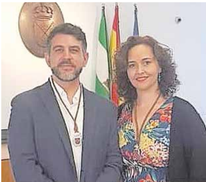
Concejales de Unidas Podemos Tomares