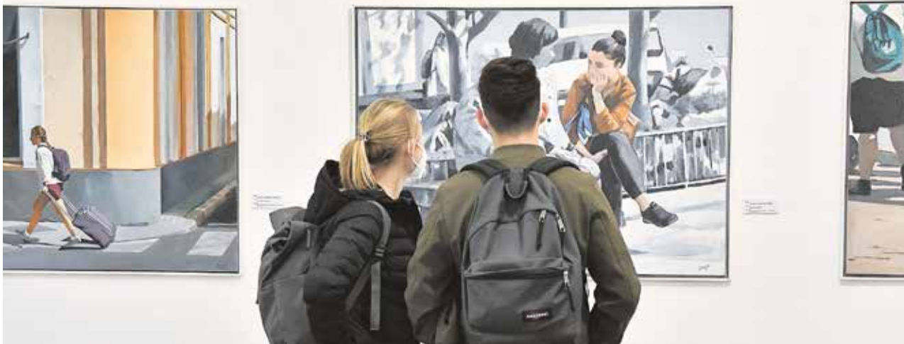
Dos jóvenes observan una de las obras de la exposición colectiva "Del pincel al pixel pasando por el buril"

El Ayuntamiento organiza un taller del 14 de febrero al 21 de abril para la confección de trajes de flamenca