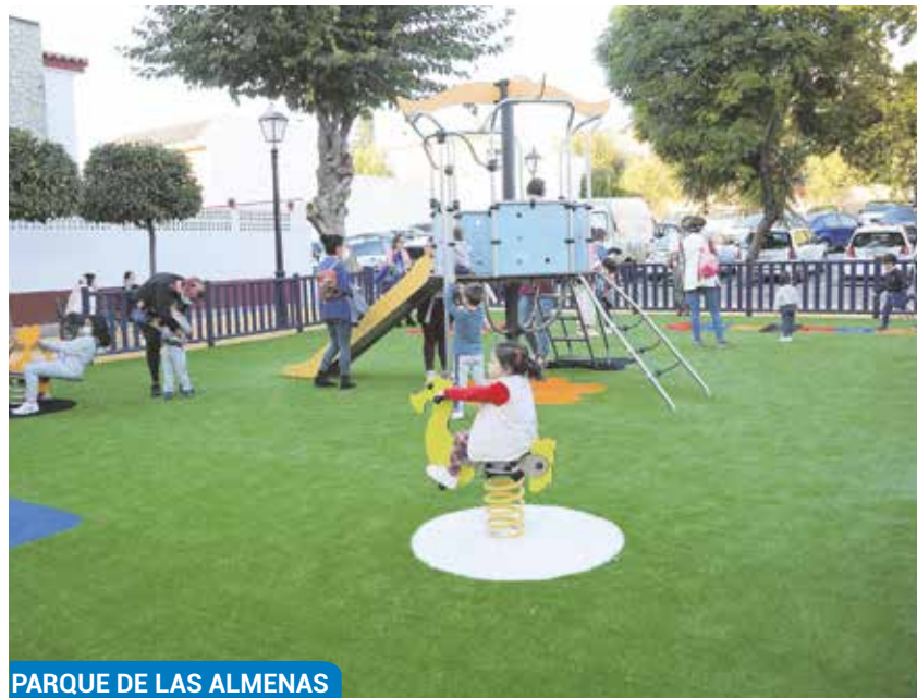
PARQUE DE LAS ALMENAS

Ejemplo de ello son las obras de la carretera A-8063, que une Tomares