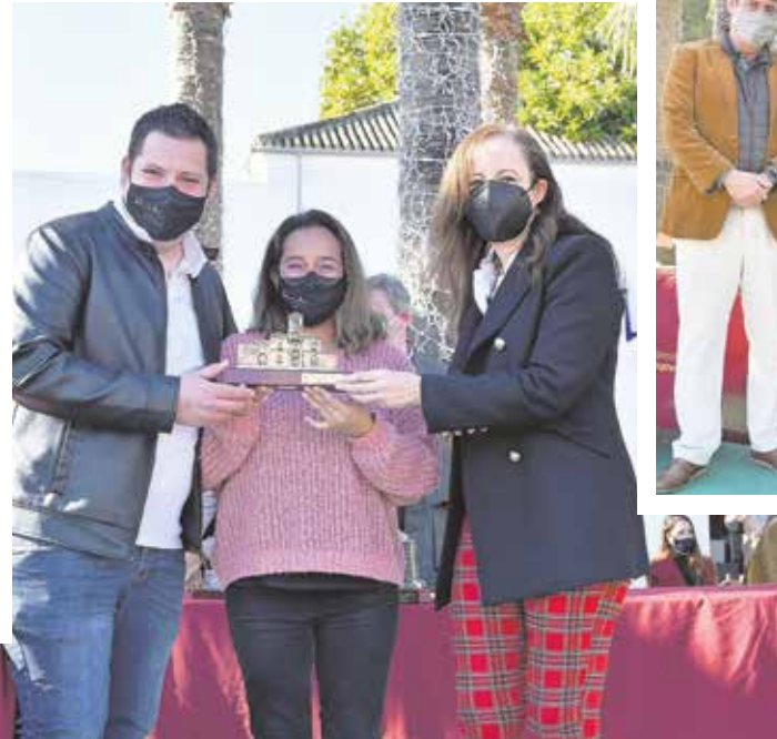
El restaurante Dámadá Aljarafe ganó la IX edición de la Ruta de la Tapa