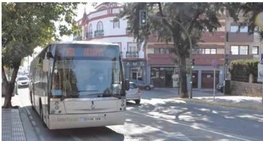
Autobús de la línea 161 que une Tomares directamente con Sevilla