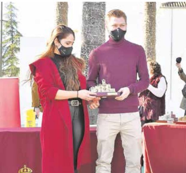
La Tapa más popular fue para Henko Gastroteca

hostelero en esta época del año, y con el objetivo de promocionar a los numerosos y variados bares y restaurantes de calidad con los que cuenta el municipio, así como la exquisita gastronomía tomareña.