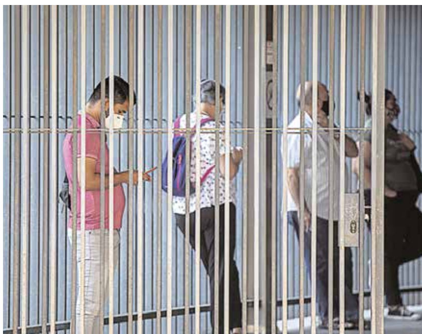
Usuarios guardan cola para recibir atención primaria en un centro de salud andaluz