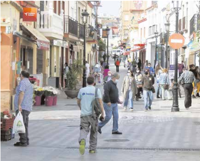
Tomares es un municipio con gran vitalidad gracias al impulso de autónomos y pymes