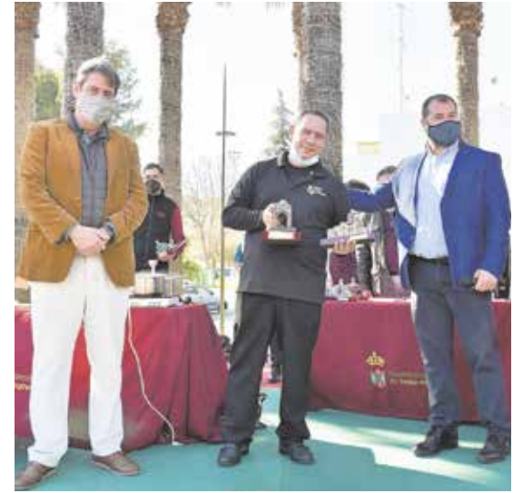
Cervecería Santa Eufemia se llevó el premio a la Caña Perfecta