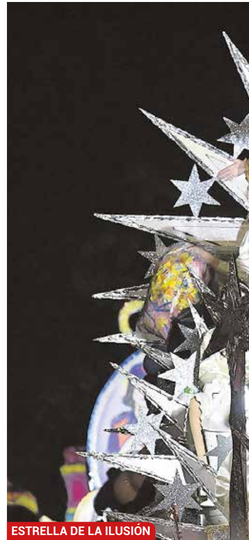
ESTRELLA DE LA ILUSIÓN

acercando el cortejo a casi todas las zonas del municipio y evitando las calles estrechas del casco histórico, siguiendo las recomendaciones de las autoridades sanitarias, que pidieron a los Ayuntamientos evitar, siempre que fuera posible, las calles estrechas de los cascos históricos para facilitar el mantenimiento de las distancia de seguridad.