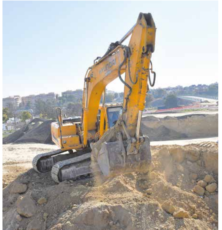
Maquinaria pesada trabajando en las obras de la A-8057

INTERVENCIÓN ESTRATÉGICA QUE SUPONE UNA NUEVA SALIDA DIRECTA DEL MUNICIPIO A LA AUTOVÍA, DE LA QUE PODRÁN BENEFICIARSE MÁS DE UN TERCIO DE LOS VECINOS EN UNAS OBRAS QUE CUENTAN CON UN PRESUPUESTO DE 4 MILLONES