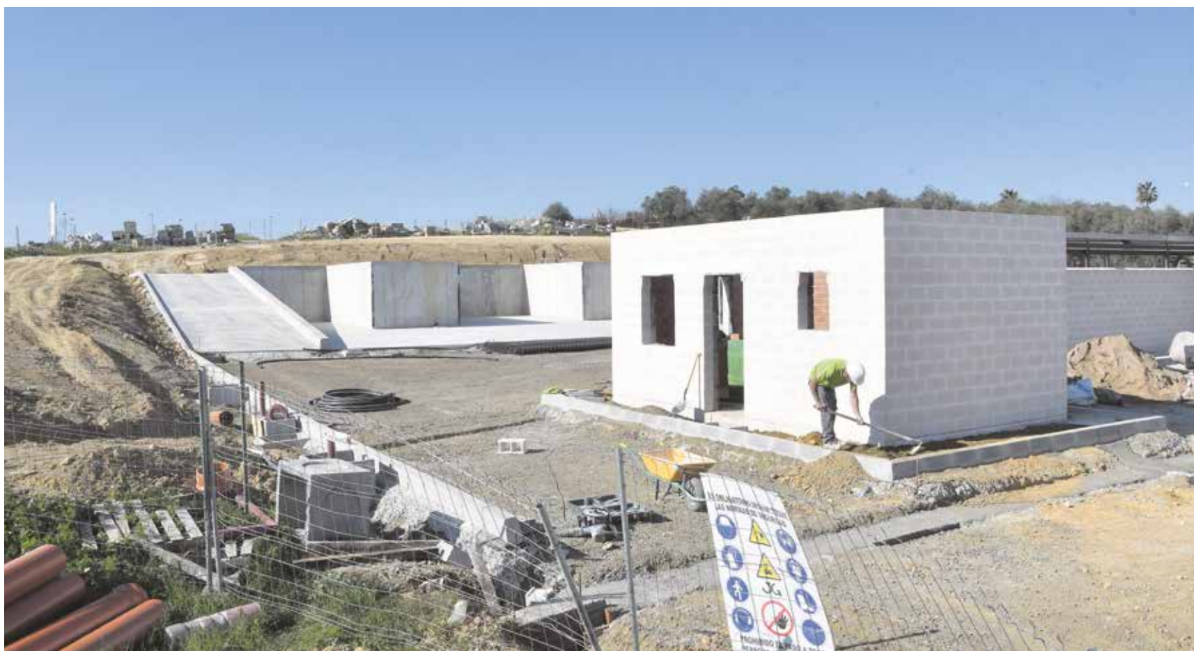
Ejecución de las obras del nuevo punto limpio con el que contará el municipio y que permitirá tratar más de 900 toneladas anuales de residuos de diversas categorías

La Junta de Andalucía está invirtiendo 540.000 euros en las nuevas instalaciones