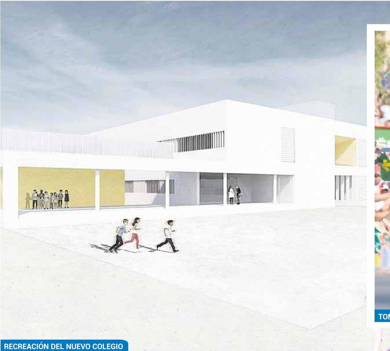
RECREACIÓN DEL NUEVO COLEGIO