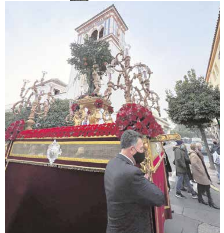
San Sebastián, patrón de Tomares, volvió a salir en procesión dos años después