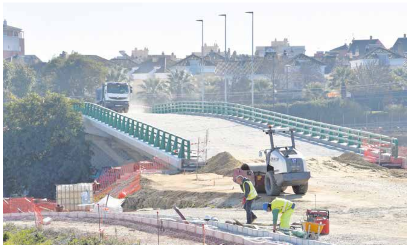
La nueva conexión hará más fluidas las comunicaciones del municipio con la capital hispalense