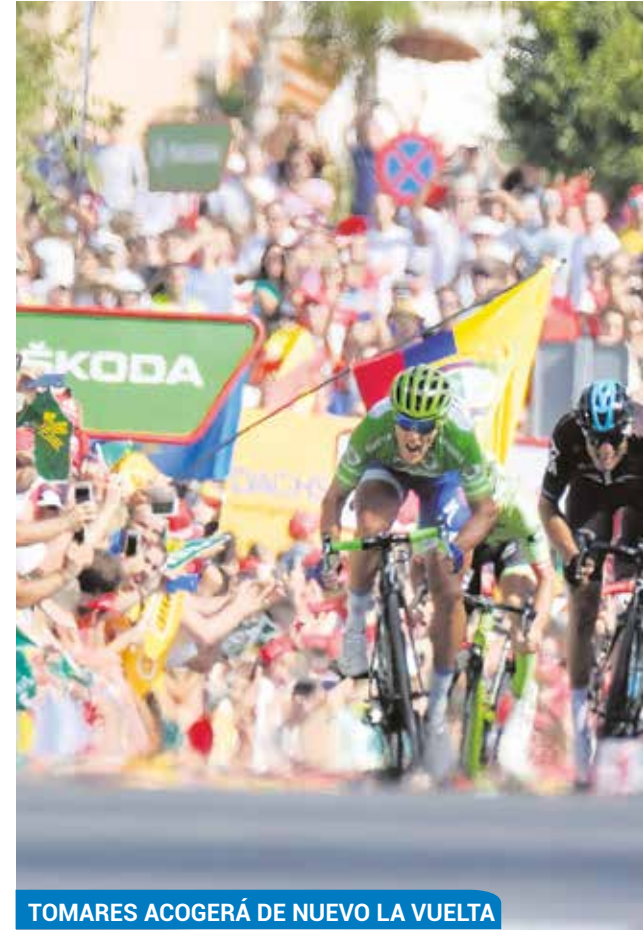
TOMARES ACOGERÁ DE NUEVO LA VUELTA