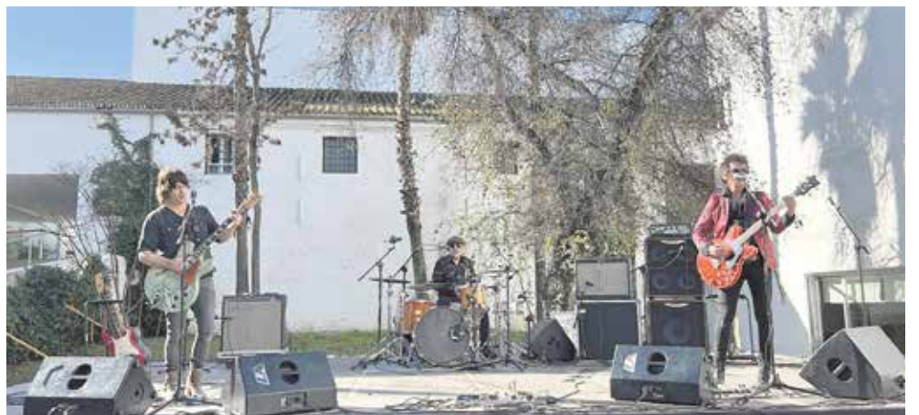
"Fusiles y Trinidad" actuaron el 2 de enero en el Patio de las Bugarvillas del Ayuntamiento

Las navidades de este año quedarán para el recuerdo gracias a una gran programación y al reencuentro de SSMM los Reyes Magos de Oriente con los tomareños.