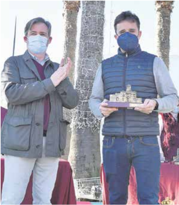
El restaurante Casa Alta, por su mollete de carrillera, se llevó el galardón por la Mejor Tapa de Autor