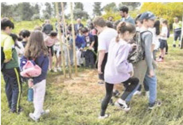
Escolares tomareños participando en la plantación de árboles

a primeros de año por el Ayuntamiento, en su apuesta por el medioambiente, en colaboración con la empresa PreZero. Un ambicioso proyecto de repoblación que tiene como objetivo promover la sostenibilidad ambiental y la preservación de espacios verdes, en la permanente búsqueda de revitalización y enri-