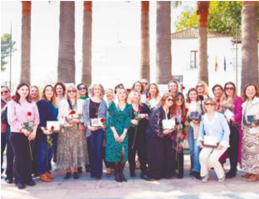
Premiadas junto a compañeras y compañeros socialistas