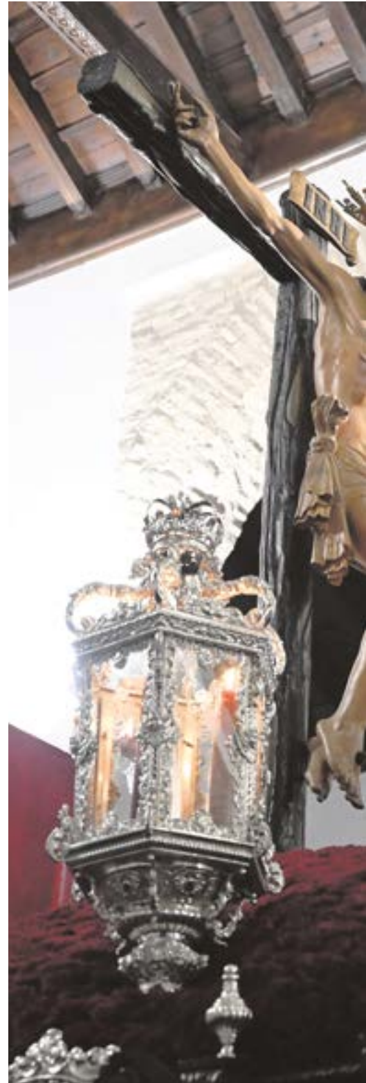
El Santísimo Cristo de la Vera Cruz y Nuestra