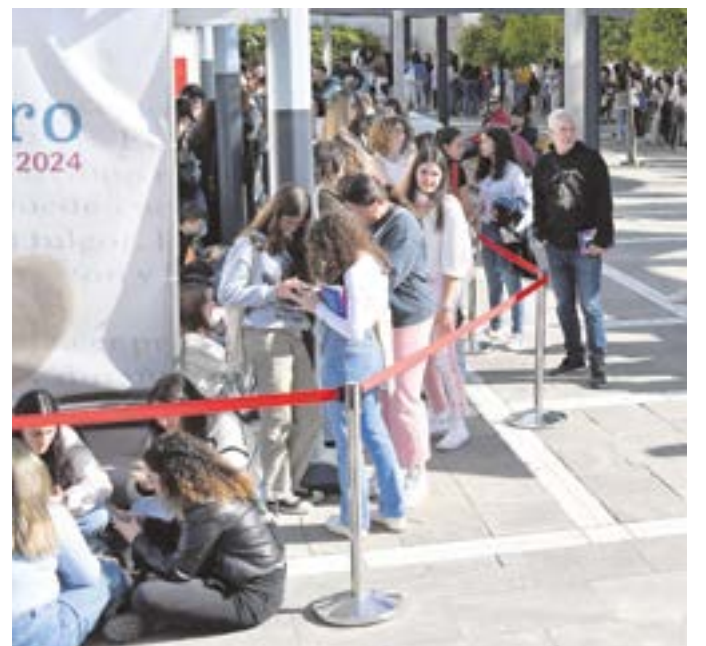
Las autoras de literatura juvenil provocaron larguísimas colas; a la izquierda, Mercedes Ron firmando ejemplares