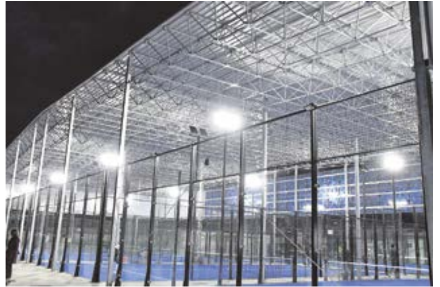
Nuevas instalaciones de pádel del Racket Club Sevilla en Rotonda del Tirreno

Situada en la Rotonda del Tirreno, cuenta con 6 pistas (2 panorámicas y 4 de cristal), además de una academia formativa y una tienda.