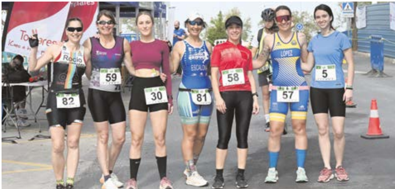
Mujeres participantes en el X Duatlón Cros "Ciudad de Tomares", que reunió a casi un centenar de deportistas en el municipio

Casi un centenar de estudiantes disfrutan del VII Encuentro Escolar de Escalada en el rocódromo de Tomares.