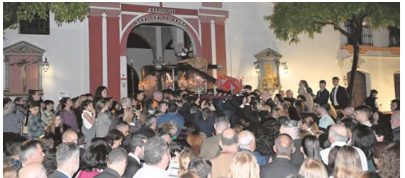
Santísimo Cristo de la Vera Cruz durante la realización del piadoso Vía Crucis el pasado Viernes de Dolores

Un día cargado de emociones, en el que los sentimientos se desbordaron al