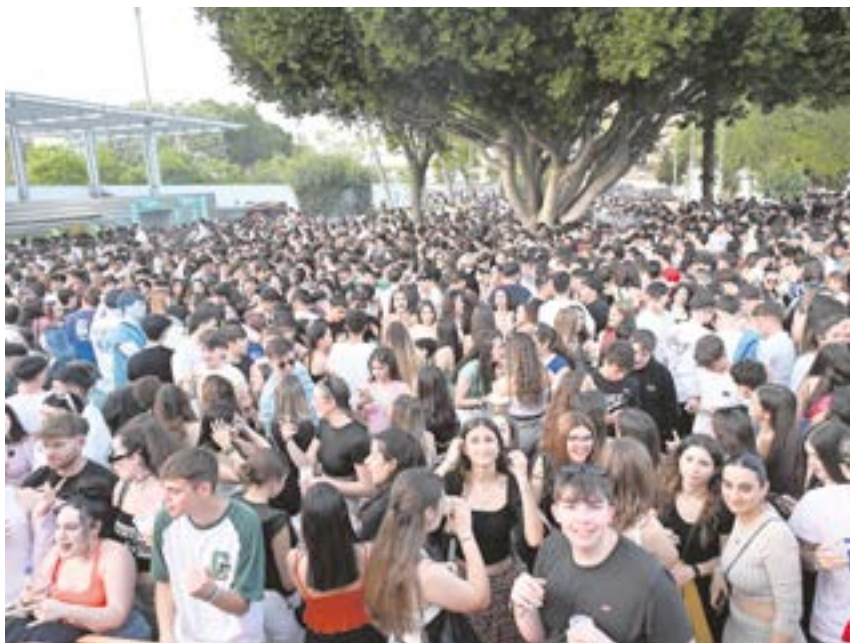
Los Jardines del Conde registraron lleno total con los tres mil jóvenes que acudieron

Las entradas se pueden adquirir a través de la cuenta de Instagram de @hayfilin.club.