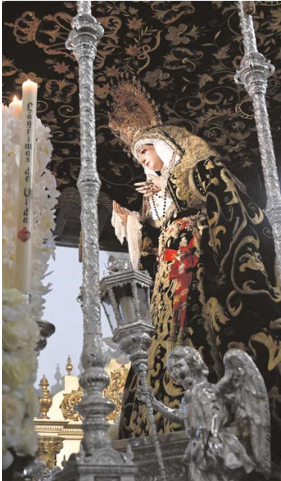
Señora la Virgen de los Dolores en sus pasos procesionales el pasado Jueves Santo en la parroquia Nuestra Señora de Belén