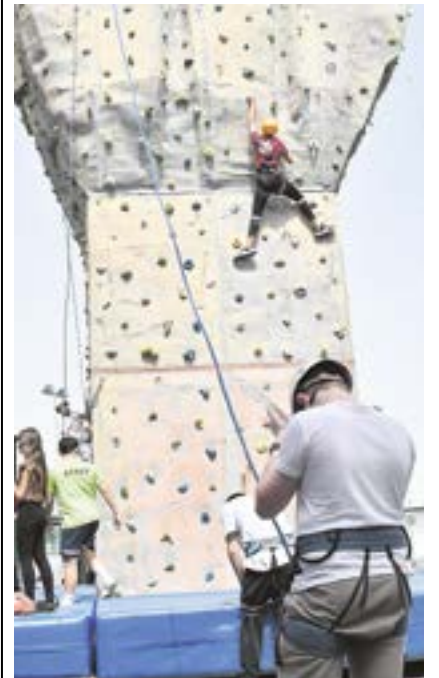
Estudiantes participando en el encuentro