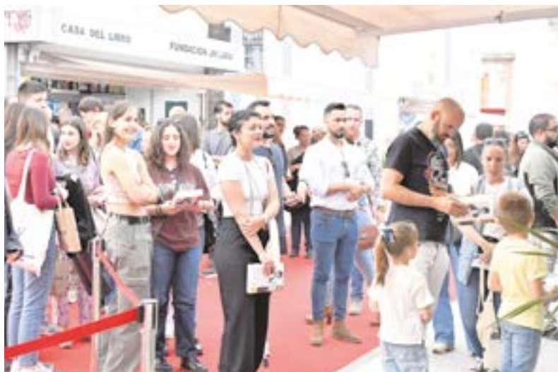
Arriba, Caseta Infantil para los más jóvenes; debajo, Sonsoles Ónega, encargada de clausurar la Feria del Libro; a la izquierda de estas líneas, lleno en el Auditorio Municipal Rafael de León; debajo, gran ambiente de público en las casetas de la Feria del Libro; bajo estas líneas, cuatro de los autores que visitaron Tomares: Alicia Giménez Bartlett, Nieves Herrero, Máximo Huerta y Juan Gómez Jurado