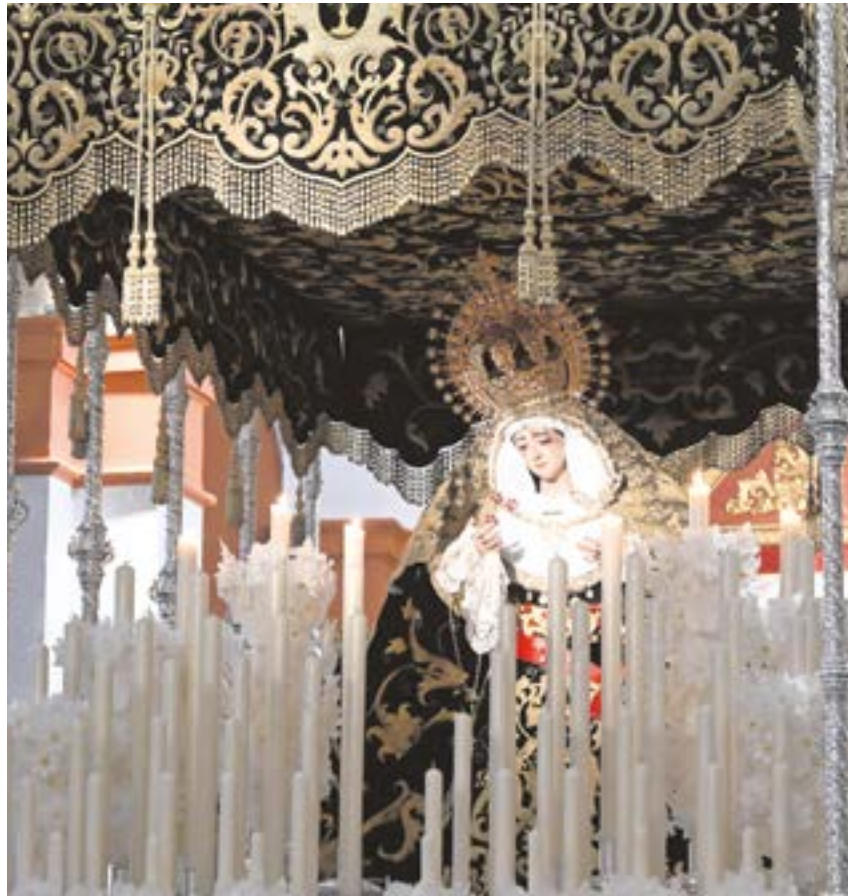
La Virgen de los Dolores, perfectamente ataviada para un Jueves Santo que no pudo ser