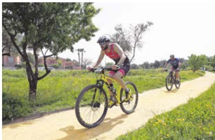
La prueba combinaba dos partes de carrera a pie y 20 km en bicicleta de montaña

Evento organizado por el Ayuntamiento de Tomares y DOC 2001, S.L., en colaboración con la Federación Andaluza de Triatlón y la Junta de Andalucía.