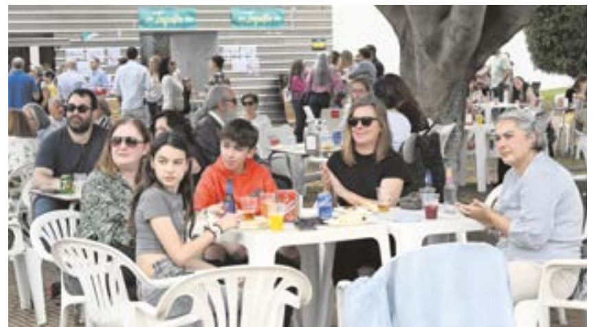
Los Jardines del Conde se llenaron de vecinos que no quisieron perderse este evento

Además, el próximo 28 de abril tendrá lugar el pregón.