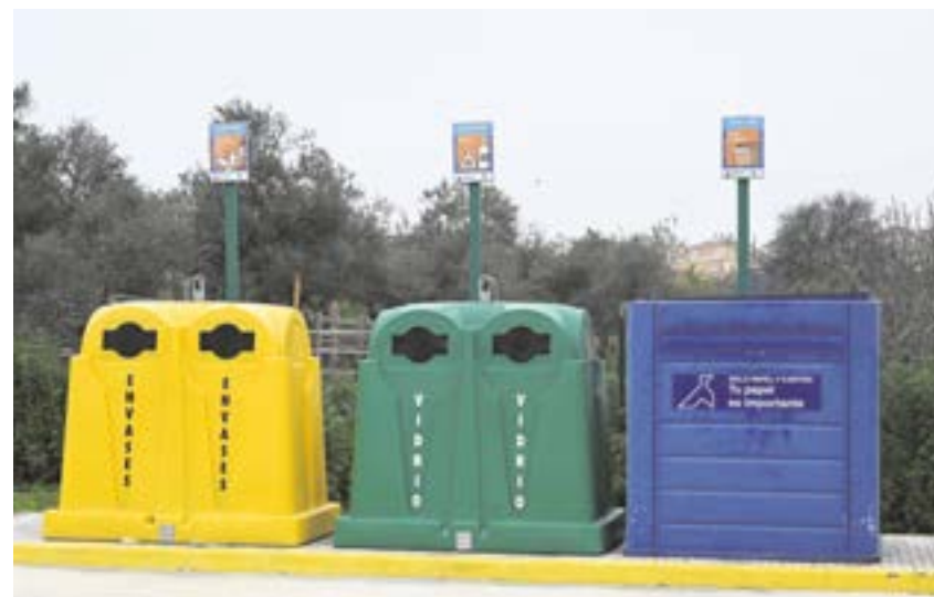
La basura debe depositarse en sus respectivos contenedores y a partir de las 20:00 horas

El Ayuntamiento también recuerda que el Punto Limpio está operativo en la calle María Moliner en el siguiente horario de invierno: de lunes a viernes, de 10:00 a 14:00 horas, y de 16:00 a 19:00 horas; sábados y festivos, de 10:00 a 15:00 horas. Cerrado los domingos.