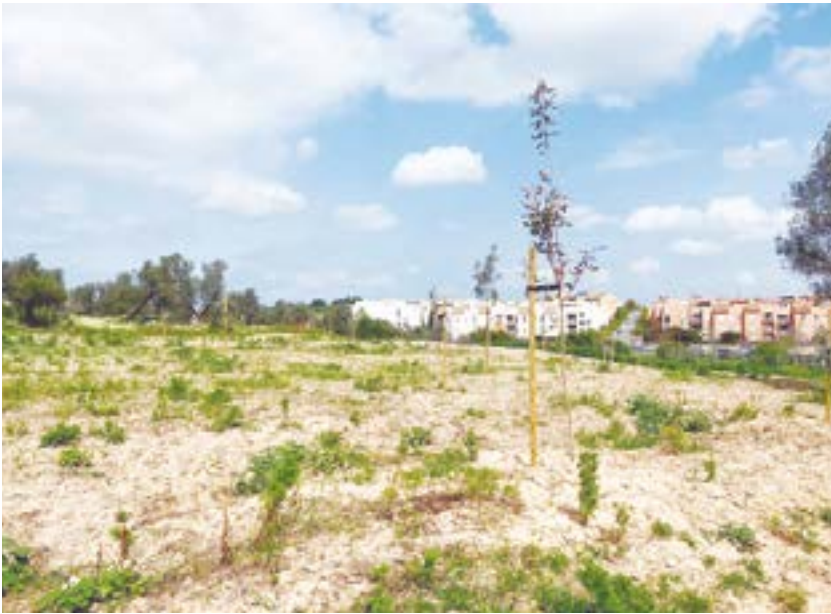
Plantación de árboles en el Parque Olivar del Zaudín