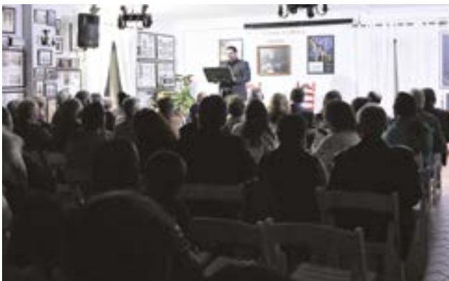
Lleno en la Peña Flamenca durante sus jornadas anuales

te jondo en una nueva edición de sus anuales Jornadas Culturales Flamencas. Evento que llega ya a su sexta edición, y que se desarrolló del 7 al 9 de marzo en la sede de la peña, en la calle Camarón de la Isla, s/n., a partir de las 20:30 horas.