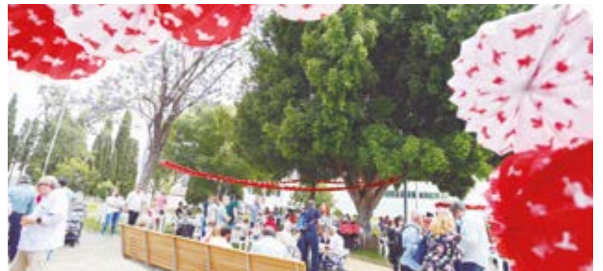
La segunda edición de la Velá de San Sebastián volverá a ser en los Jardines del Conde

De esta forma, el próximo fin de semana del 20 al 21 de abril, tendrá lugar la II Velá de San Sebastián, dos jornadas de convivencia en los Jardines del Conde que servirán como previo a la Romería que cada año se celebra en honor al Patrón del municipio el primer domingo de mayo, y que este 2024 recaerá en el próximo 5 de mayo. Serán días para compartir entre hermanos y vecinos en torno a la devoción del Santo Patrón.