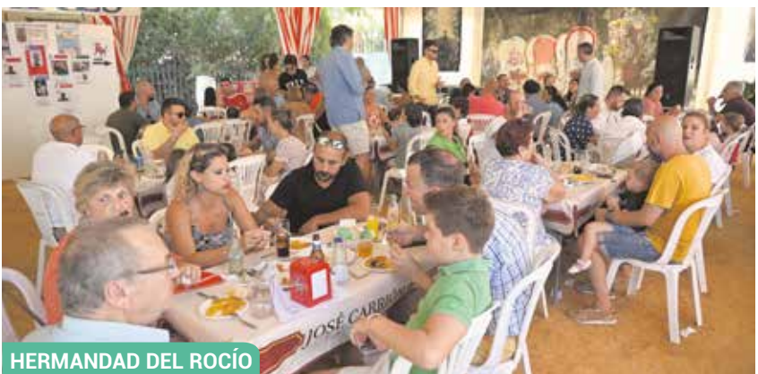
HERMANDAD DEL ROCÍO