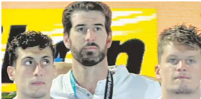
En el centro, el deportista Miguel de Toro, campeón del mundo de waterpolo

Miguel de Toro, a pesar de su juventud, es un referente del waterpolo español y mundial. También fue medalla de Plata con la Selección Española Campeonato del Mundo de China de 2019 y en los Europeos de Barcelona 2018 y Budapest 2020.