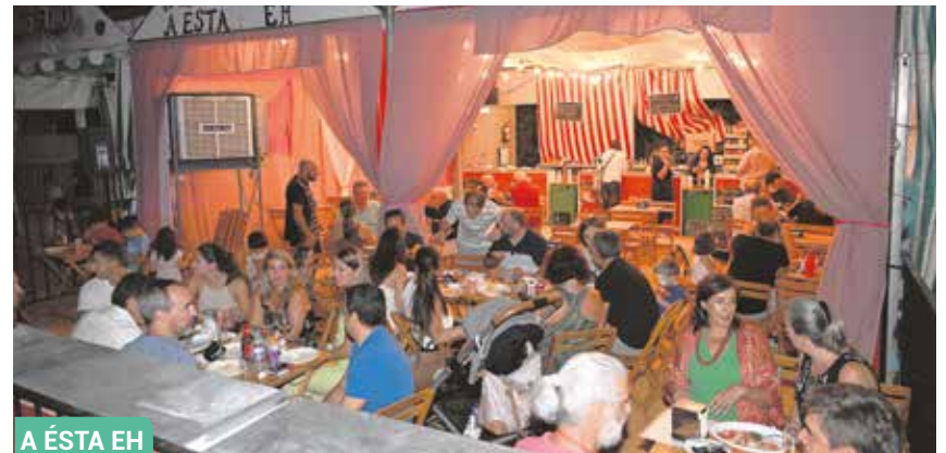
A ÉSTA EH