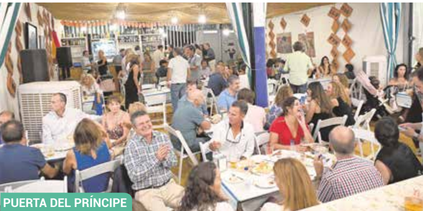
PUERTA DEL PRÍNCIPE