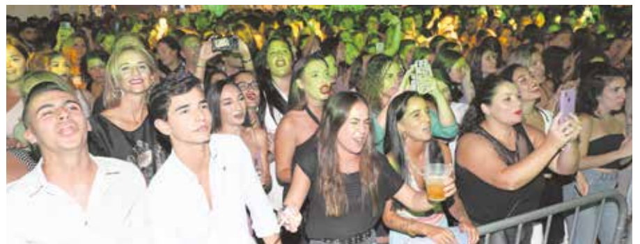
Sobre estas líneas, la tómbola de la Hermandad Sacramental; al lado, niños en los cacharritos y debajo, jóvenes disfrutando de un concierto; bajo estas líneas, Policía Local, Protección Civil y servicios de Limpieza; al lado, el alcalde saludando a los mayores durante la comida que se les ofreció en la Caseta Municipal