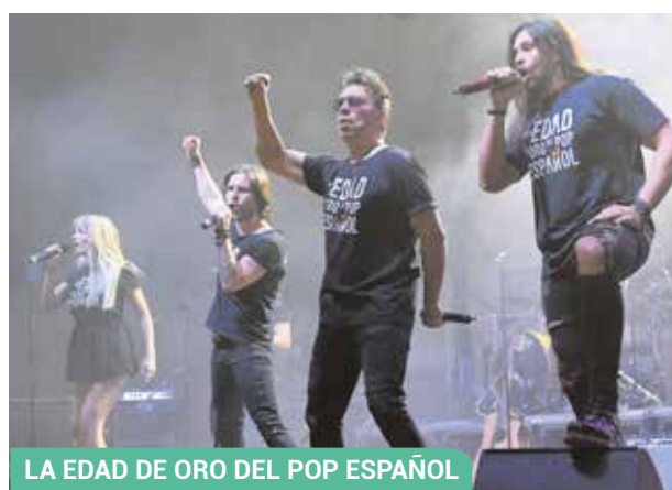
LA EDAD DE ORO DEL POP ESPAÑOL