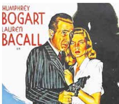
"El sueño eterno", el 19 de octubre

Y enmarcado también dentro de la programación del Otoño Cultural, no faltará el tradicional y variado mercado artesanal, que seguirá instalándose todos los sábados en las Cuatro Esquinas a partir del 15 de octubre. Será de 11:00 a 14:00 horas.