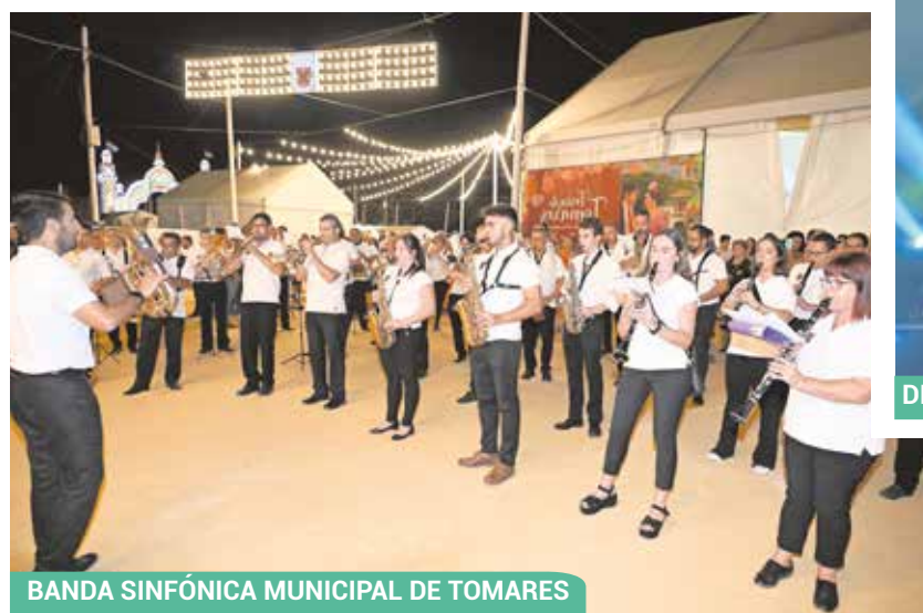
BANDA SINFÓNICA MUNICIPAL DE TOMARES