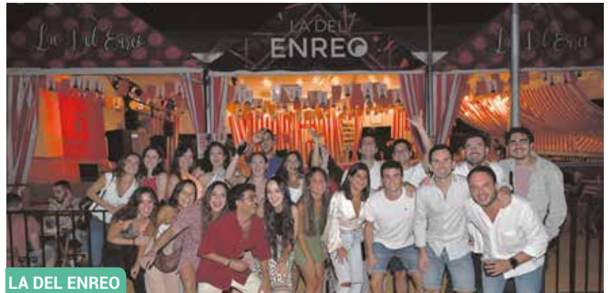
LA DEL ENREO