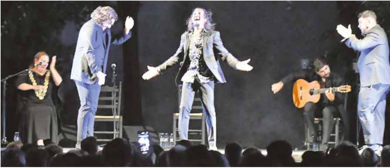
El bailar sevillano "Farruquito" emocionó al público que acudió al Patio de las Buganvillas a vivir la noche más flamenca de Tomares

LA 47 EDICIÓN DEL FESTIVAL FLAMENCO HOMENAJEÓ A "EL NIÑO DE TOMARES", POR EL 150 ANIVERSARIO DE SU NACIMIENTO, Y ACTUARON "FARRUQUITO", "EL PERRETE" Y ANABEL VALENCIA, ENTRE OTROS