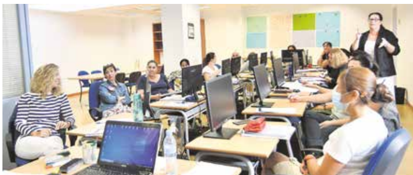
Alumnas durante una de las clases del curso sobre atención al cliente

Quince tomareñas han comenzado el curso de FPE sobre “Atención al cliente, consumidor