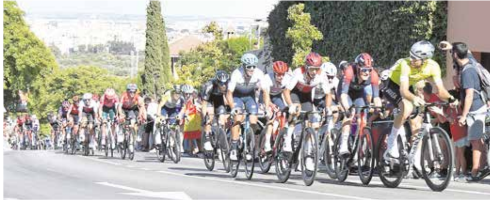
Instantáneas de ciclistas finalizando la 16ª etapa de la Vuelta Ciclista en Tomares

La Vuelta volvió a convertir a Tomares en protagonista del ciclismo por tercera ocasión en los últimos diez años. En 2013, lo hizo como ciudad de paso y en 2017 y ahora, en 2022, como final de etapa.