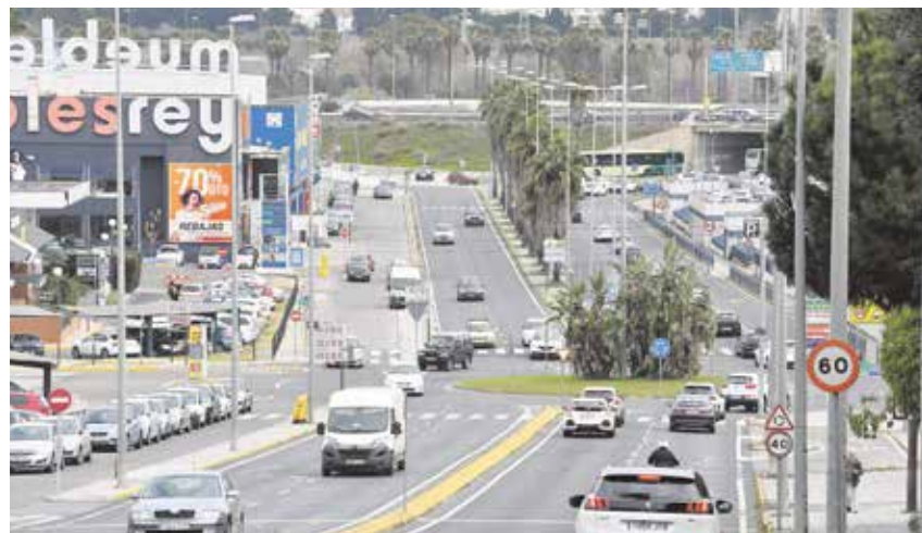
Cuatro cursos están dirigidos a empresarios, y tres a desempleados