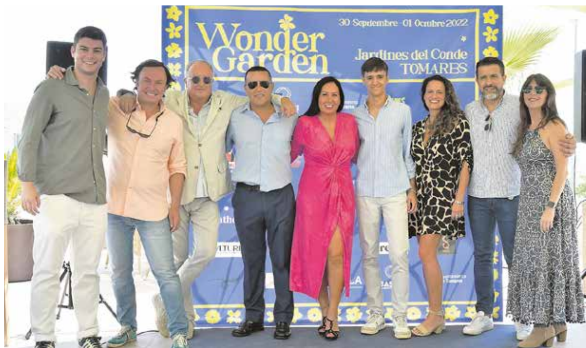
Foto de familia en el Casino Admiral de la presentación del I Festival Wonder Garden