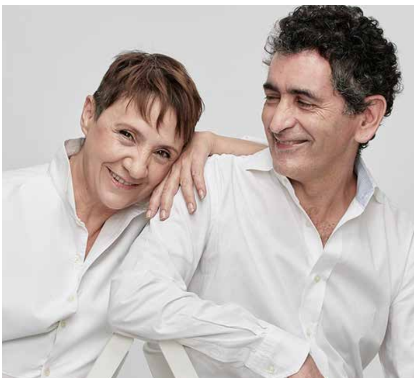
La actriz Blanca Portillo junto al director Juan Mayorga, artífices de "Silencio"