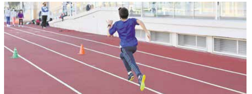
Las inscripciones pueden hacerse vía telemática en el portal Tomares Deportes