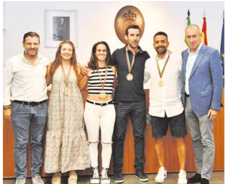
El alcalde y el concejal de Deportes junto a los cuatro entrenadores de la escuela