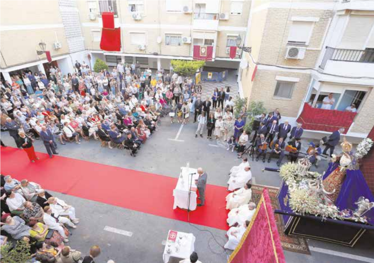
Celebración de la Santa Misa con la Virgen de los Dolores en la calle Pepe Marchena, en el barrio de Las Almenas