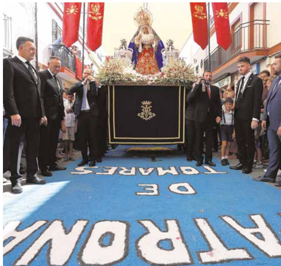
Virgen de los Dolores atravesando una de las alfombras de sal dispuestas para ella