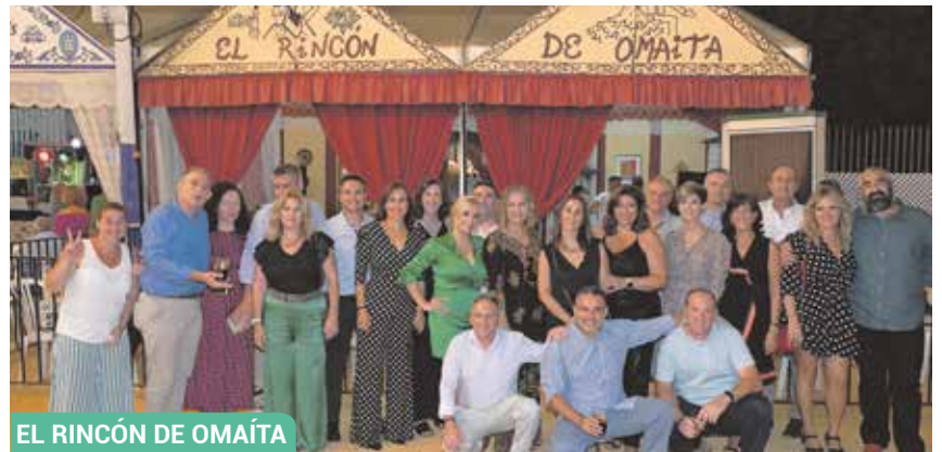
EL RINCÓN DE OMAÍTA