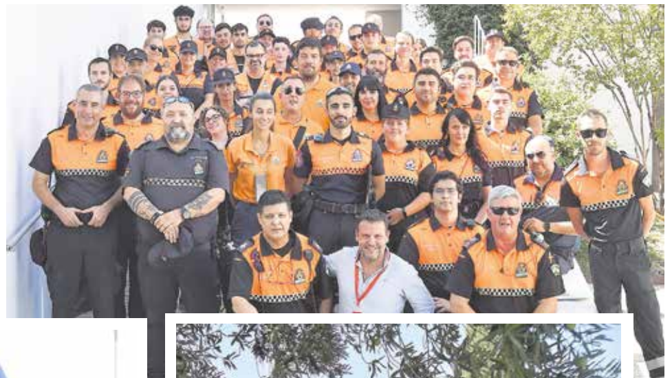
Los cuerpos y fuerzas de seguridad cumplen un papel esencial para el normal transcurso del final de etapa de La Vuelta en Tomares; Policía Local, Guardia Civil y Policía Nacional montaron un amplio despliegue para garantizar la normalidad en este día; también fue fundamental la labor de los voluntarios de Protección Civil