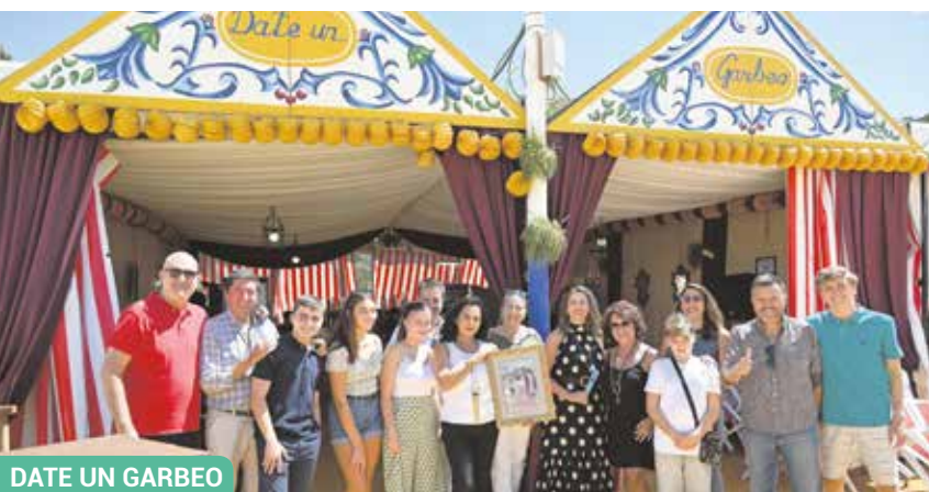
DATE UN GARBEO