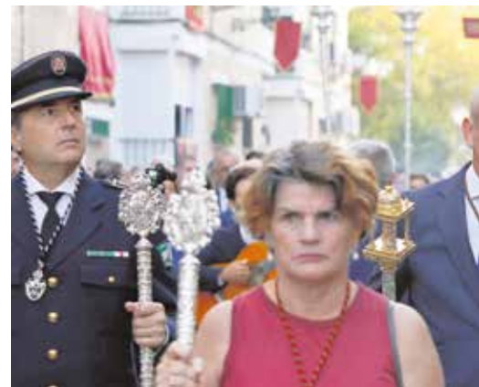
Arriba, petalada a la Virgen; debajo, acompañamiento