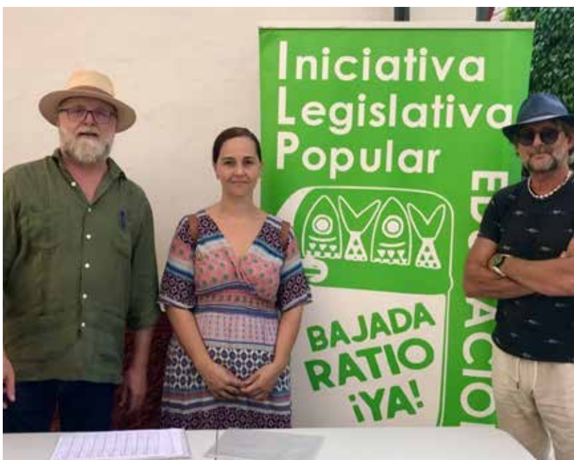
UP por Tomares durante la recogida de firmas por la bajada de ratio