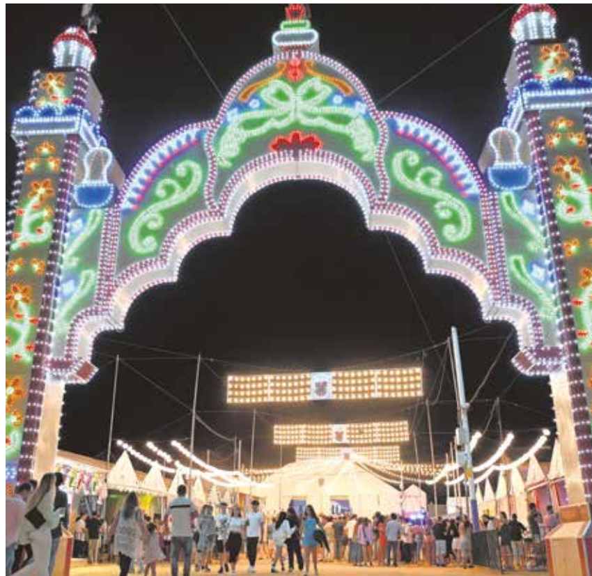
Portada de la Feria de Tomares, punto de encuentro para comenzar la diversión

Raúle, Los Toreros Muertos, Los Centellas, La Edad de Oro del Pop Es-