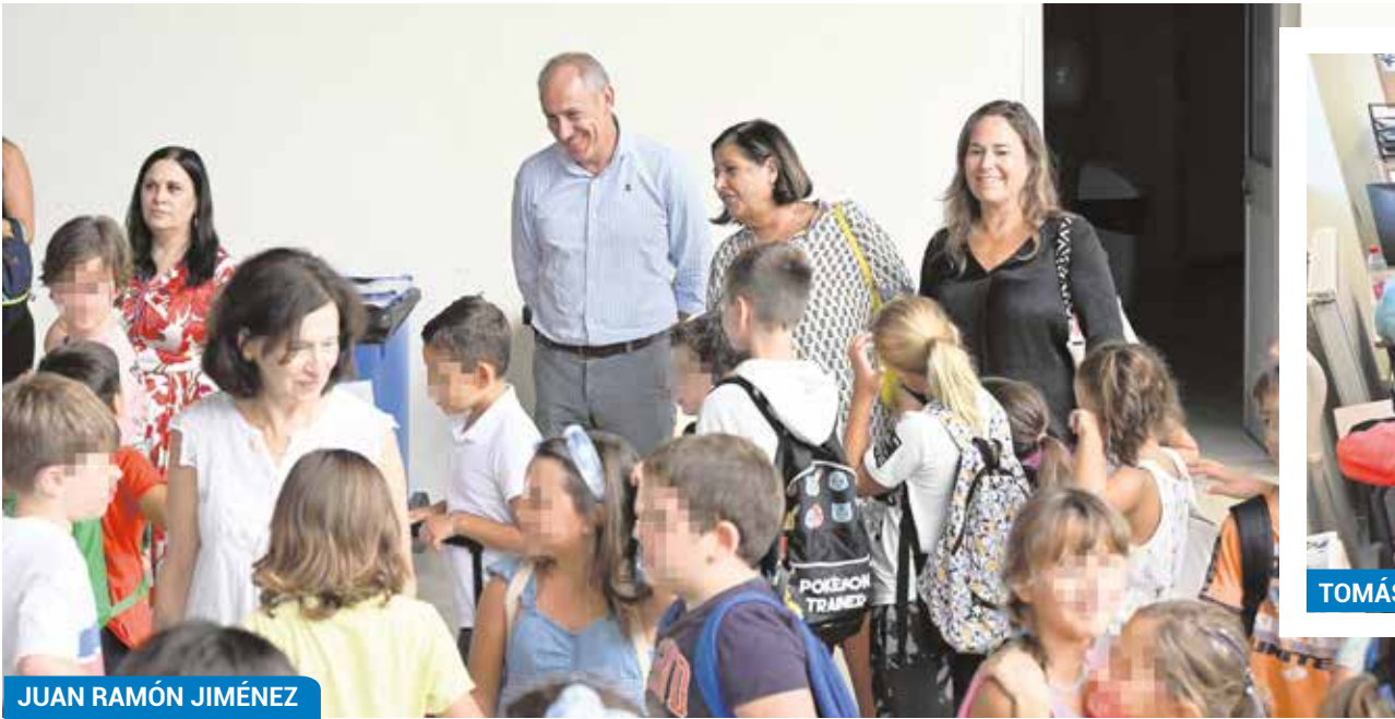
JUAN RAMÓN JIMÉNEZ

El próximo 27 de octubre será la gala de entrega de los II Premios a la Excelencia Empresarial.