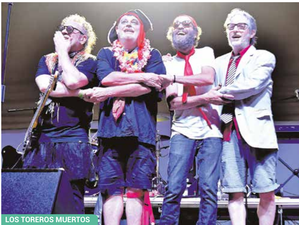
LOS TOREROS MUERTOS