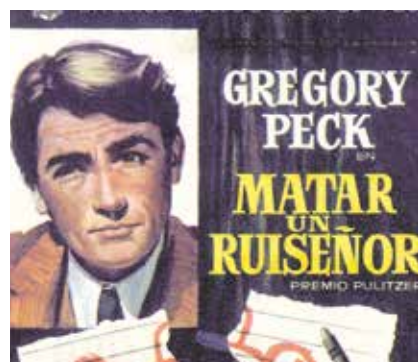
"Matar a un ruseñor", el 26 de octubre