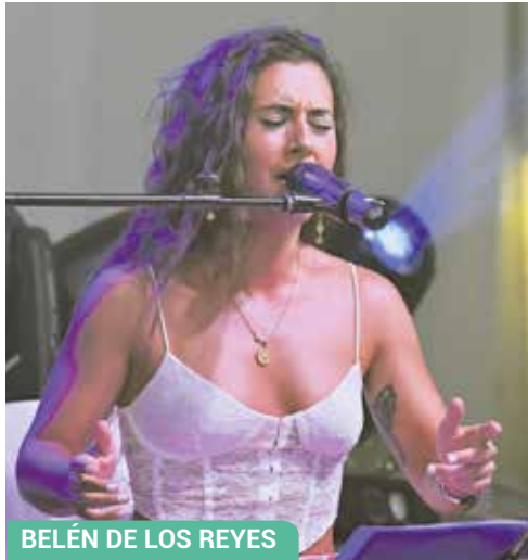
BELÉN DE LOS REYES