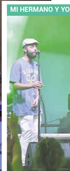
MI HERMANO Y YO