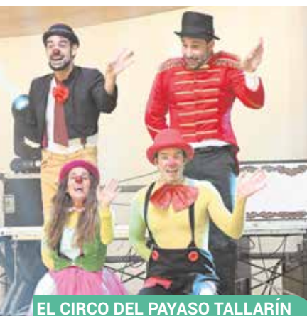
EL CIRCO DEL PAYASO TALLARÍN