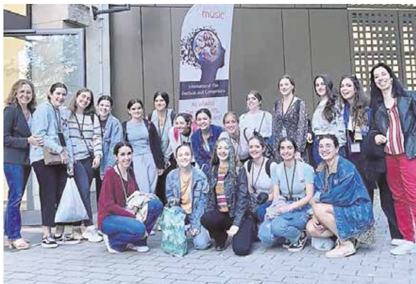
Coro Femenino de la Escolanía de Tomares durante su visita a la capital de Alemania

La Escolanía cuenta con dos coros: uno infantil de niños y niñas, y otro de voces jóvenes femeninas de alto nivel, referentes en Andalucía, que recorren los principales escenarios cantando temas de distintos estilos, tanto de actualidad como sacros, étnicos, folk y gospel.