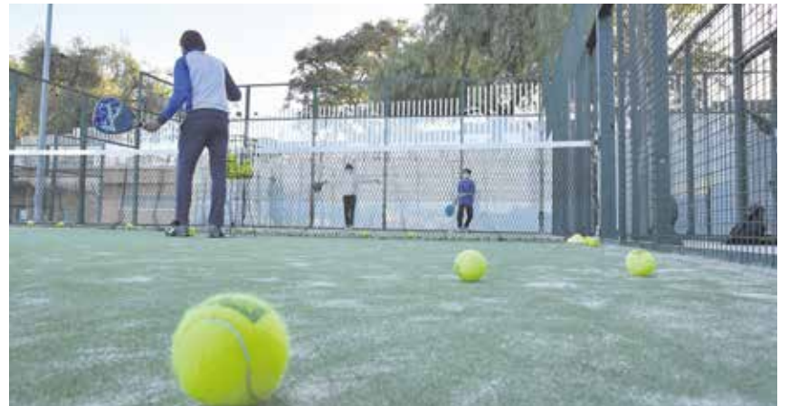
El pádel será una de las 16 disciplinas deportivas disponibles para este nuevo curso

Al igual que años anteriores, todos los trámites se harán vía telemática, a través del Portal de Tomares Deportes. Más información, llamando al 954 15 92 10 o a través de deportes@tomares.es.