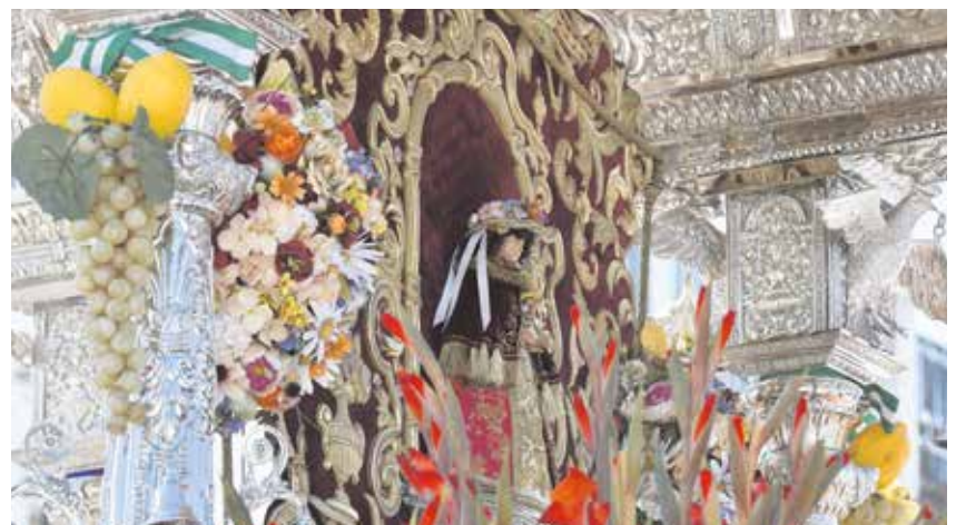
El Simpecado de la Hermandad de Tomares volverá a la aldea del Rocío