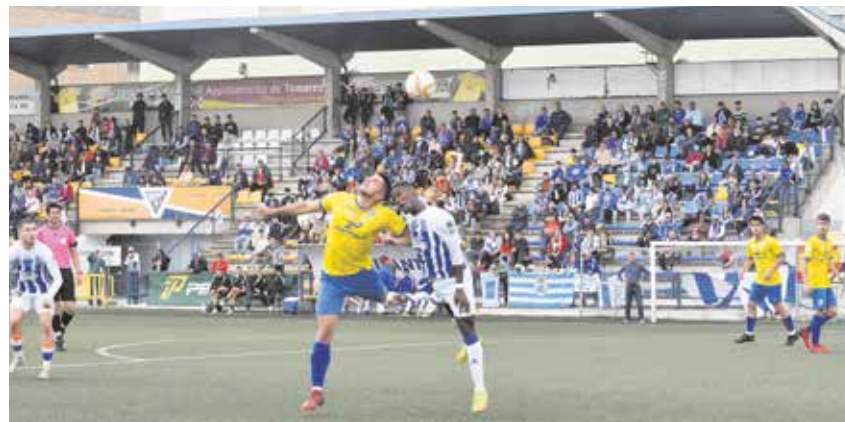
La UD Tomares se impuso al Recreativo de Huelva por 3-2