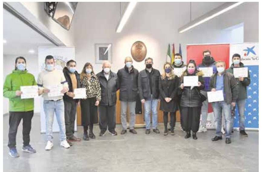
Autoridades y alumnos del curso durante la entrega de diplomas en el Ayuntamiento

con salidas laborales que ayuden a los desempleados a su incorporación al mercado laboral.