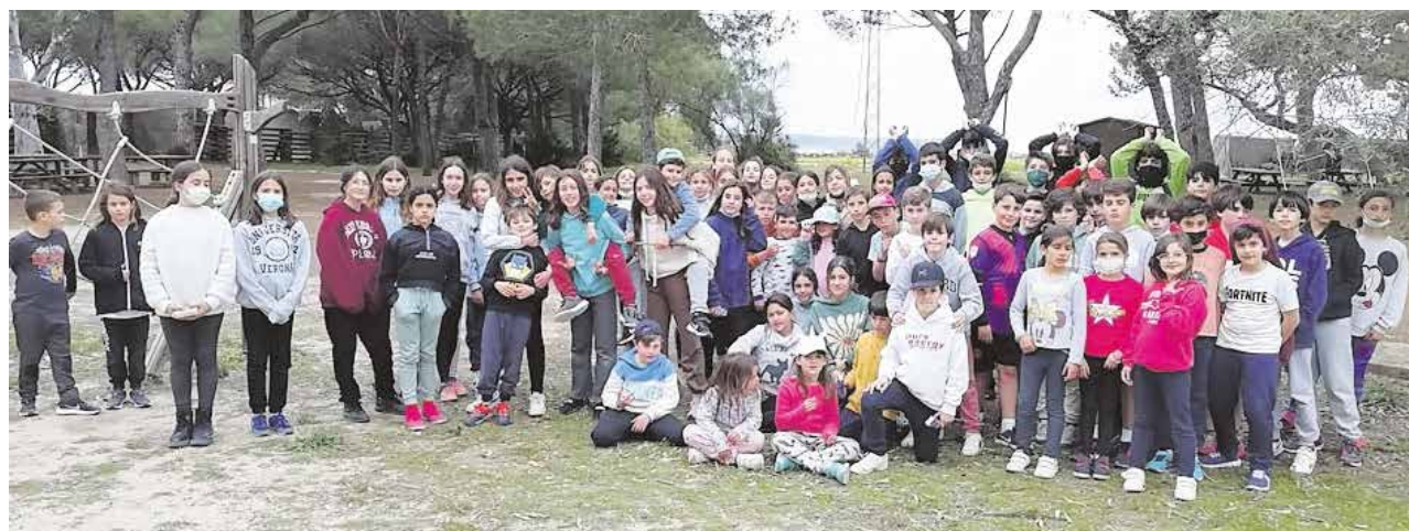
Pequeños tomareños que disfrutaron del Campamento de Primavera que tuvo lugar del 1 al 3 de abril

portivas como piragüismo, tiro con arco o vóley-playa, y juegos de orientación. Una divertida, inolvidable y enriquecedora experiencia que, de seguro, también les ha servido para relacionarse y ampliar la nómina de amigos.