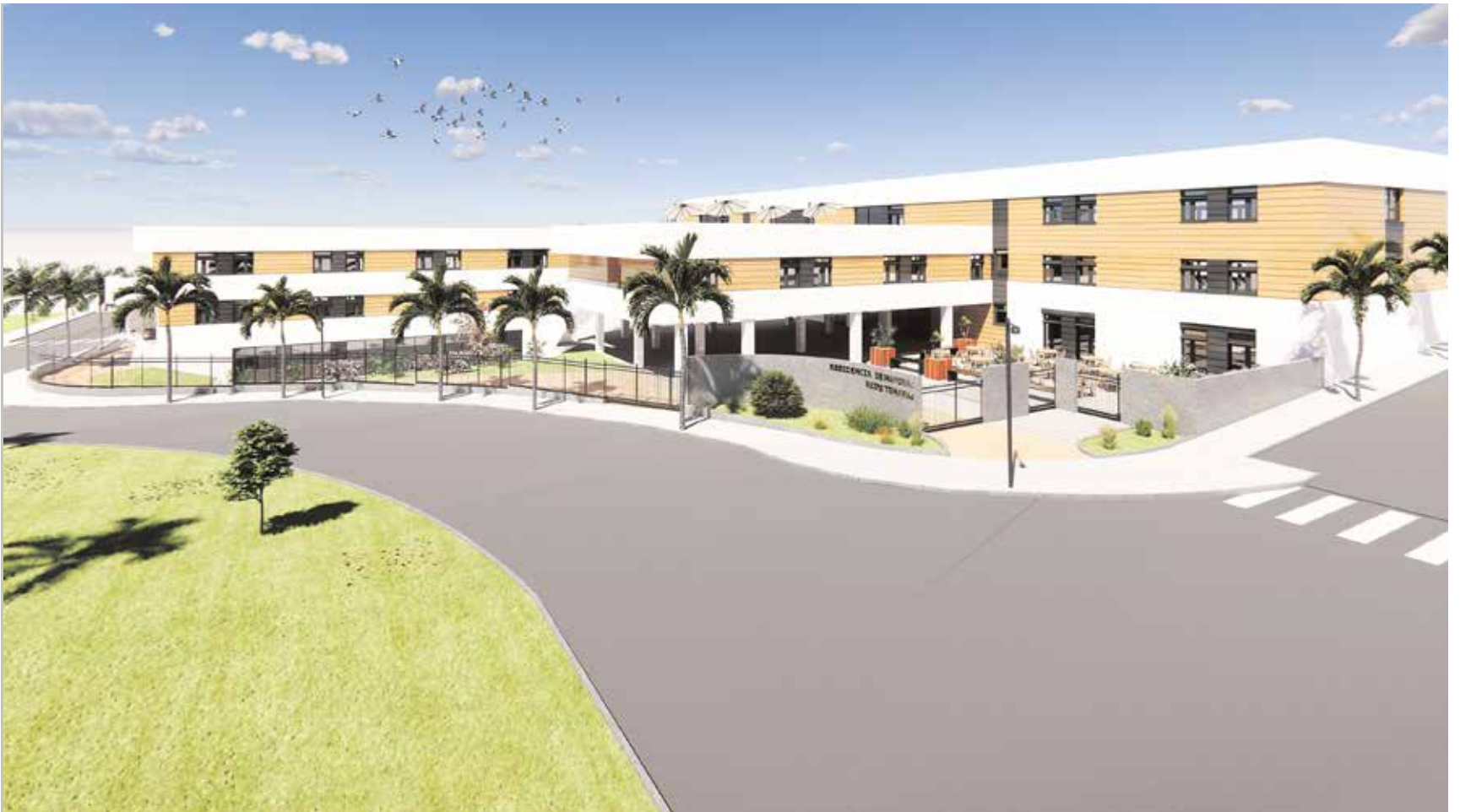
Infografía de la vista exterior del centro de mayores, que construirá Residencias Reifs y que dispondrá de 180 plazas para ancianos

La residencia, que estará ubicada en la zona de Aljamar y dispondrá de 180 camas, va a contar con una inversión de más de 14 millones de euros