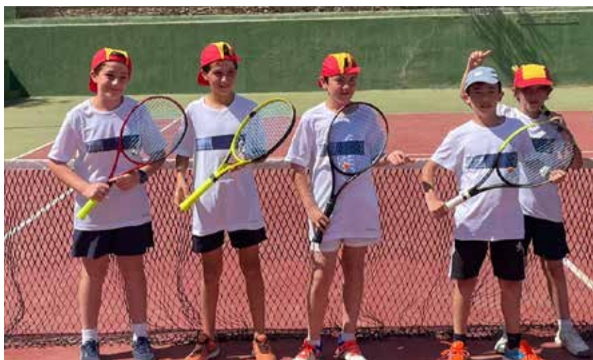
Jugadores alevines del equipo de tenis de Tomares

reña ha sido elegida junto con varios responsables más de la RFEA (Real Federación Española de Atletismo), a la que ella pertenece, para entrenar a los mejores velocistas del país y prepararlos para las competiciones internacionales de este año como el Campeonato de Europa, el Campeonato Iberoamericano o el Campeonato del Mundo.