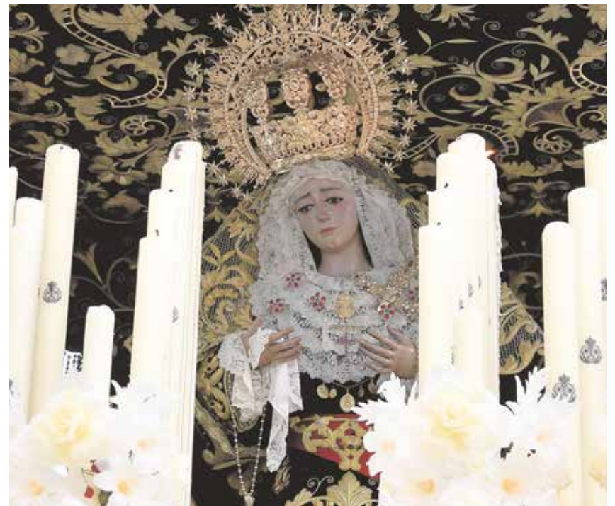
Detalle de Nuestro Padre Jesús de la Vera Cruz y María Santísima de los Dolores sobre sus pasos en la procesión del pasado Jueves Santo