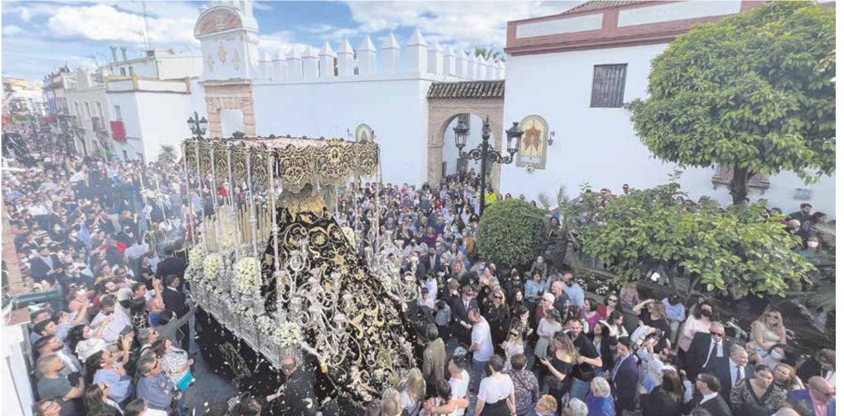
Cientos de tomareños no quisieron perderse la salida de la Virgen de los Dolores, que estrenó la ampliación del techo de palio y las bambalinas