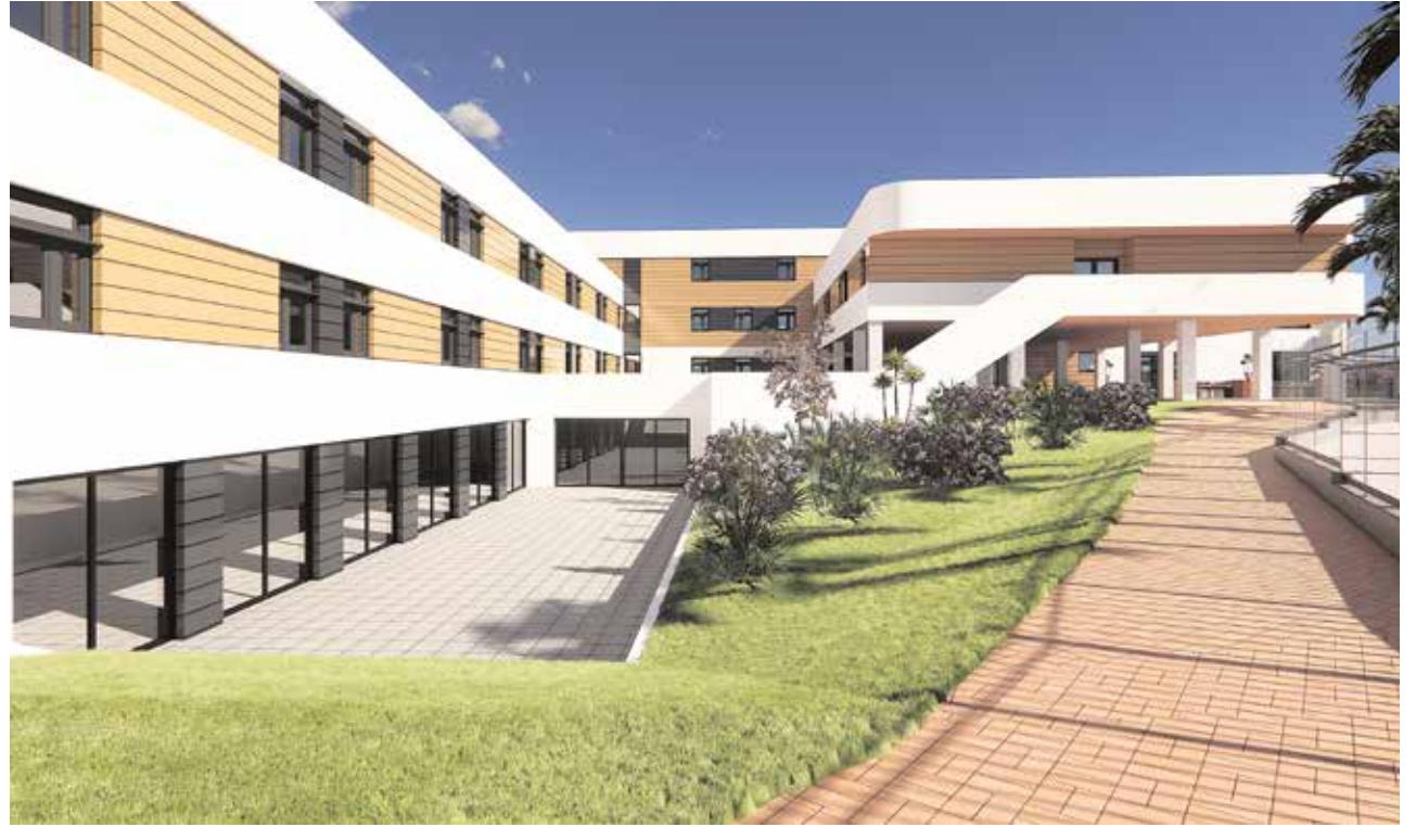
Infografía de la vista de la zona de paseo exterior y de la terraza de rehabilitación de la nueva residencia de Tomares

También disfrutarán de comedores, salas de estar y de visitas, biblioteca, restaurante y amplias zonas ajardinadas, entre otras instalaciones, donde podrán practicar diversas actividades. El proyecto cuenta, igualmente, con cocina propia, lavandería y zona de peluquería y podología, todo ello orientado a mejorar la calidad de vida de las personas residentes en la institución.