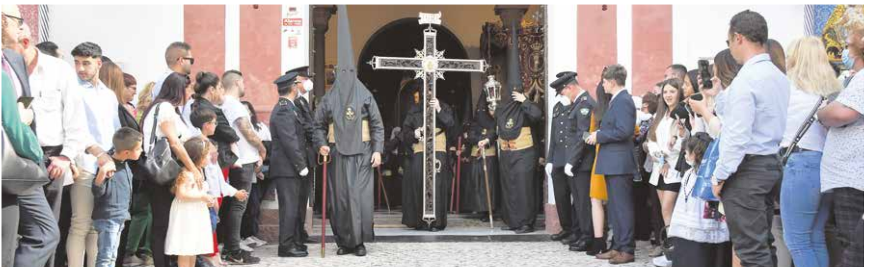
Emotivo instante en el que la Cruz de Guía de la Hermandad Sacramental inició el recorrido procesional desde la iglesia Ntra. Sra. de Belén