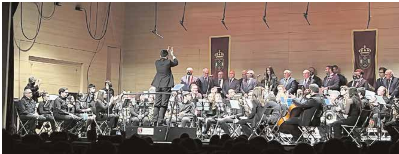
La Banda Sinfónica Municipal de Tomares durante el Concierto de Cuaresma del pasado 2 de abril

Asimismo, Tomares estuvo muy presente con las marchas “Señor de la Veracruz” y “Dolores, madre de los