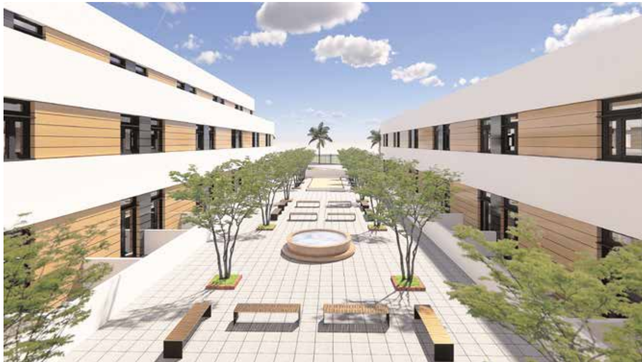
Recreación virtual del patio central con el que contará el centro de mayores que se construirá en la zona de Aljamar

ADEMÁS DE AMPLIAS ZONAS AJARDINADAS Y COMEDORES, EL CENTRO TENDRÁ BIBLIOTECA, RESTAURANTE, COCINA PROPIA, LAVANDERÍA, ZONA DE PELUQUERÍA Y PODOLOGÍA, TODO ELLO ORIENTADO A MEJORAR LA CALIDAD DE VIDA DE LAS PERSONAS RESIDENTES EN LA INSTITUCIÓN