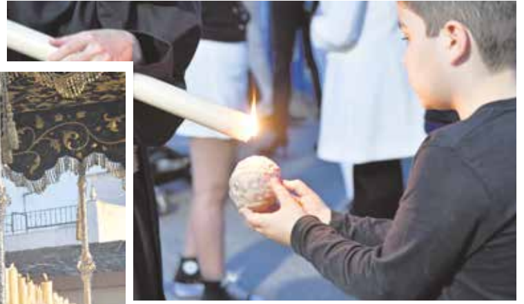
A la izquierda, el palio paseando por las calles de Tomares; sobre estas líneas, un pequeño pidiendo cera a un nazareno

bajar por calle de la Fuente hasta el Ayuntamiento de Tomares, donde Joaquín Pavón les cantó una saeta a las imágenes.