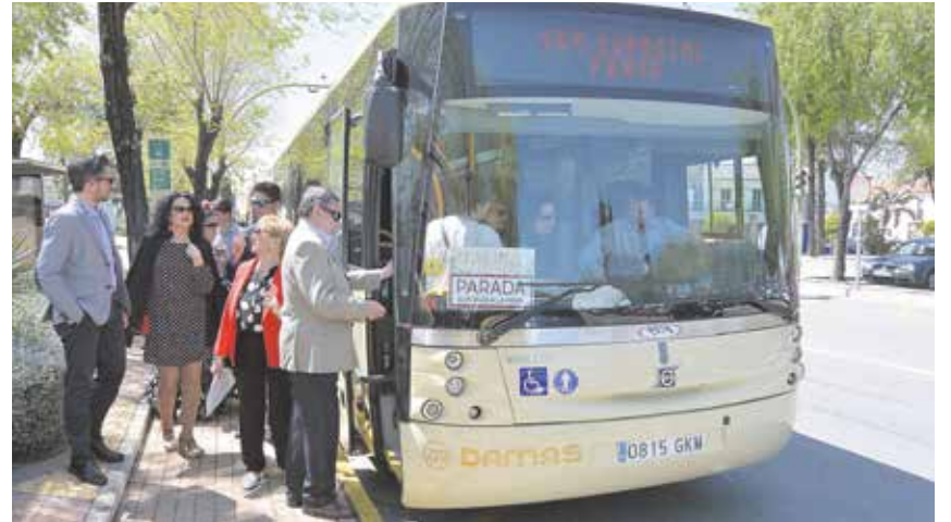
Tomareños cogiendo el autobús con servicio especial a la Feria de Sevilla

El servicio arrancó el primer día de la Feria, el sábado 30 de