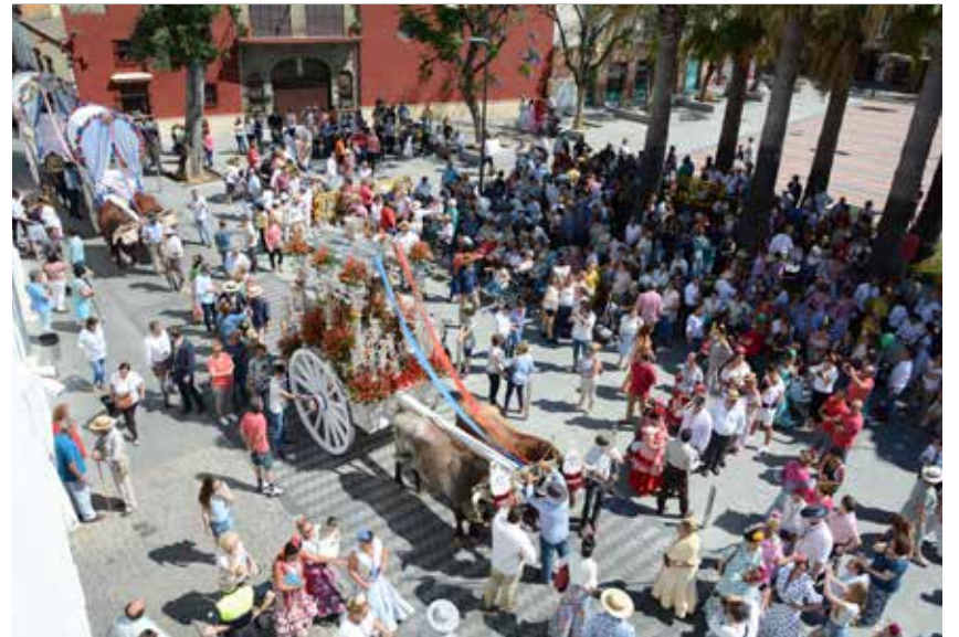
El Simpecado en la Plaza del Ayuntamiento en la Romería de 2019