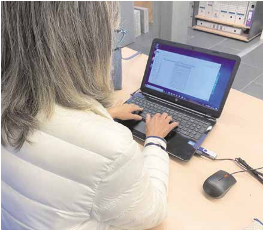
Técnica del Ayuntamiento contratada gracias al plan PEAE1