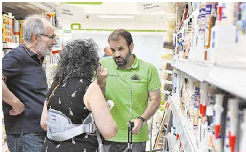
Trabajador de Leroy Merlin resolviendo dudas a unos clientes

Tendrá lugar entre el 9 de mayo y el 23 de junio, y la duración será de 165 horas.