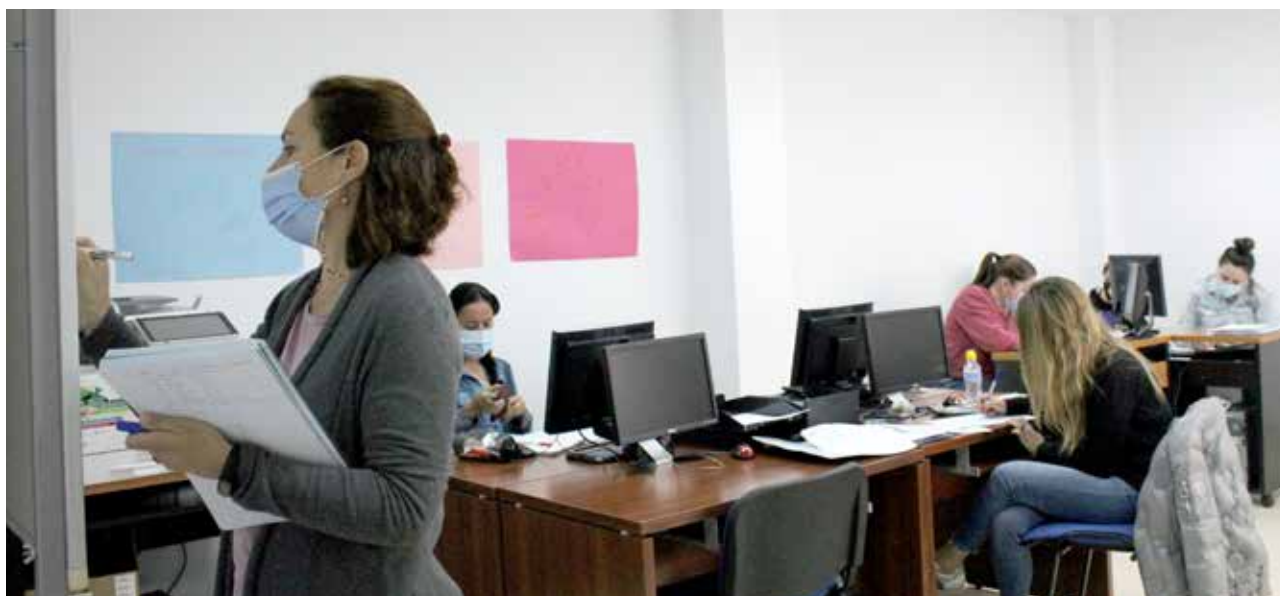
Tomareñas participando en el Proyecto Formativo Becado de "Simulación de Empresas"

Así, el alumnado va pasando por los departamentos de contabilidad, comercial y recursos humanos, realizando operaciones de compra-venta, almacén, contabilidad, RRHH, facturación,