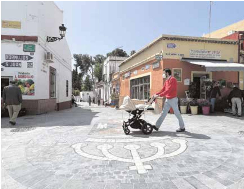
Una de las constantes del PP ha sido fomentar el crecimiento económico de Tomares