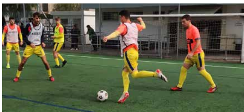
El Camino Viejo está actualmente en la segunda posición de la liga de descenso