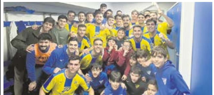
La UD Tomares celebrando su séptima victoria consecutiva tras vencer al Castilleja CF

Por su parte, el Camino Viejo CF, que juega en Segunda División Andaluza, comenzó esta liga con varias victorias pero no están pasando ahora por su mejor momento, aunque aún les quedan ocho jornadas para volver a la racha ganadora.