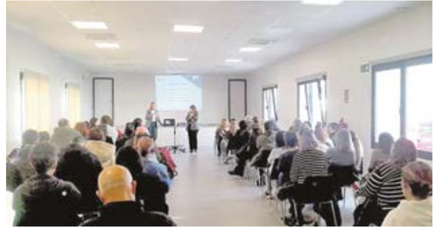
Primera jornada informativa del programa de proyectos integrales "T-Acompañamos"

Además, el Ayuntamiento, a través de la ADL; ha informado sobre la oferta