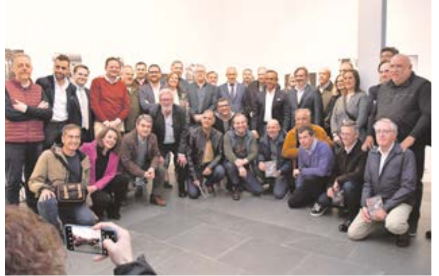
El alcalde junto a los fotógrafos de la muestra "XL Visiones de la Semana Santa de Sevilla"