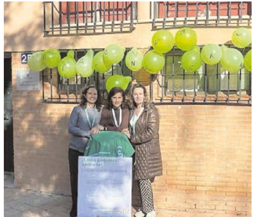
Mesa informativa ubicada en la puerta de la sede de la AECC en Tomares