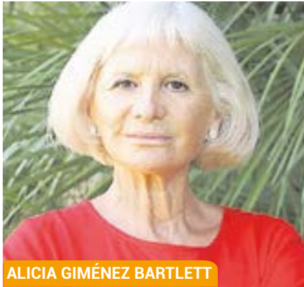
ALICIA GIMÉNEZ BARTLETT