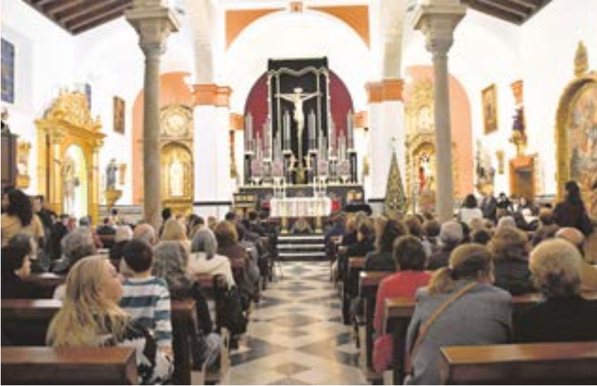
Misa celebrada el Miércoles de Ceniza en la parroquia Nuestra Señora de Belén