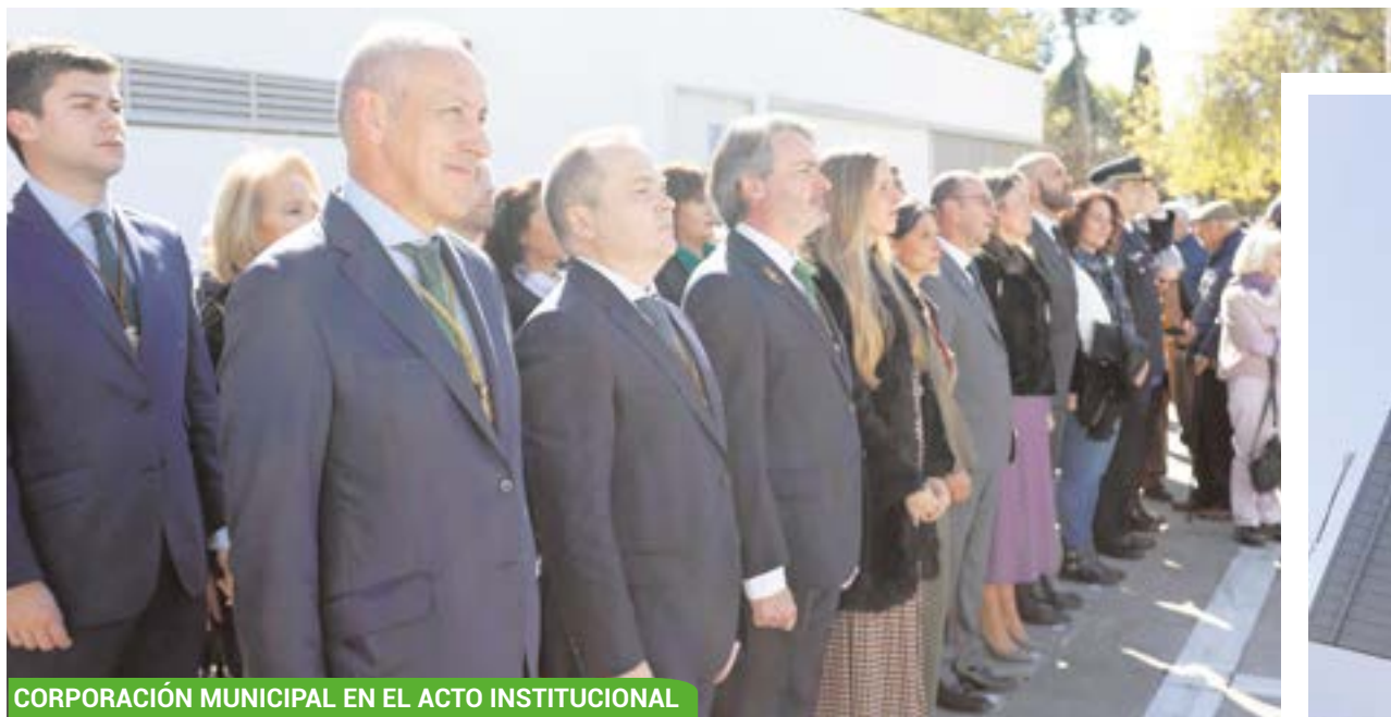
CORPORACIÓN MUNICIPAL EN EL ACTO INSTITUCIONAL