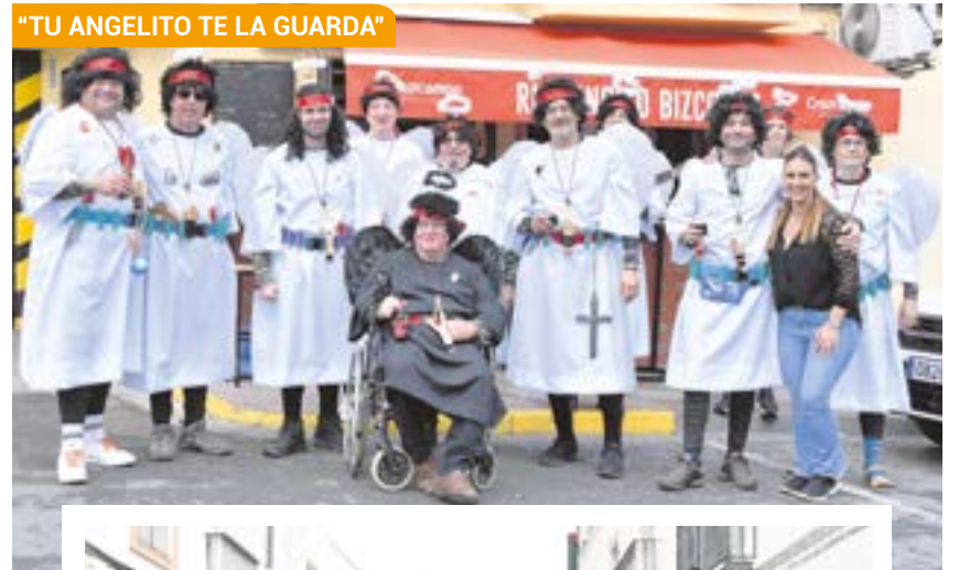
"TU ANGELITO TE LA GUARDA"