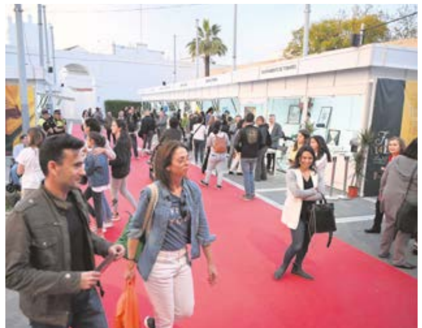
La Plaza de la Constitución volverá a ser el epicentro de la Feria del Libro de Tomares

La edición de este año estará dedicada al periodista andaluz Manuel Chaves Nogales en el 80 aniversario de su fallecimiento