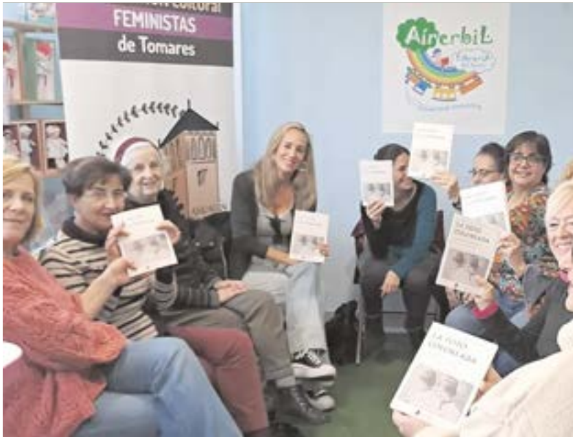
La Asociación Cultural Feministas de Tomares durante el club de lectura feminista