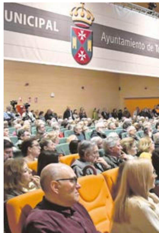
Cientos de personas abarrotaron el Auditorio

Para Rosa Díez, "a esta degeneración no hemos llegado de la noche a la mañana". Díez explicó que es consecuencia de "un plan trazado por el PSOE para romper la democracia". Y añadió: "Si hi-