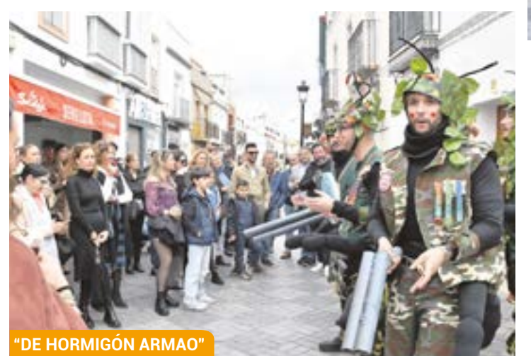
"DE HORMIGÓN ARMAO"