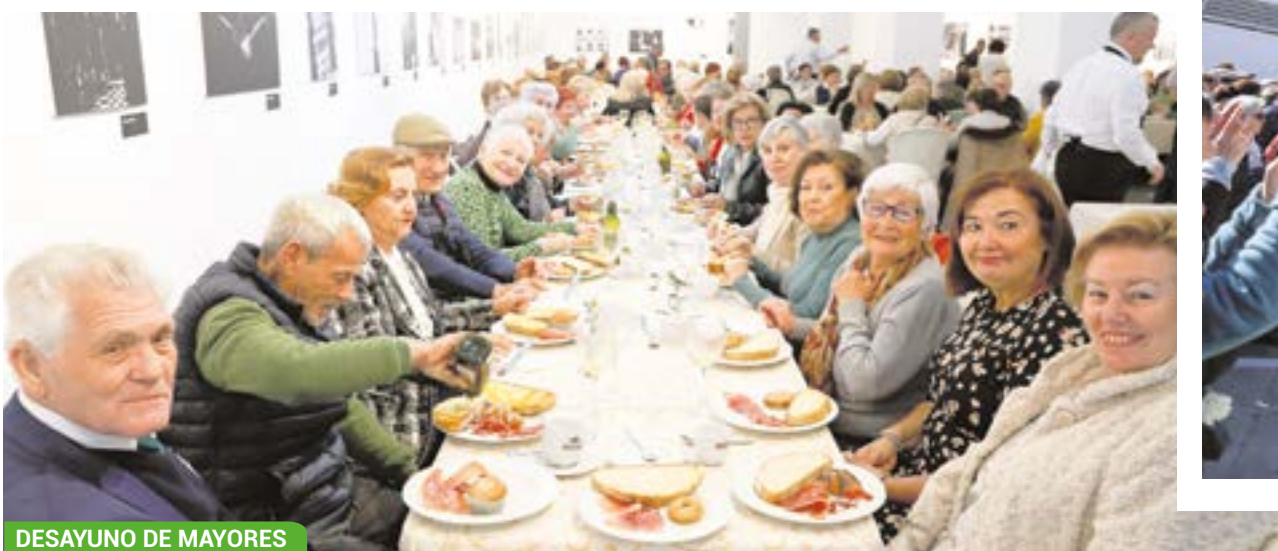
DESAYUNO DE MAYORES