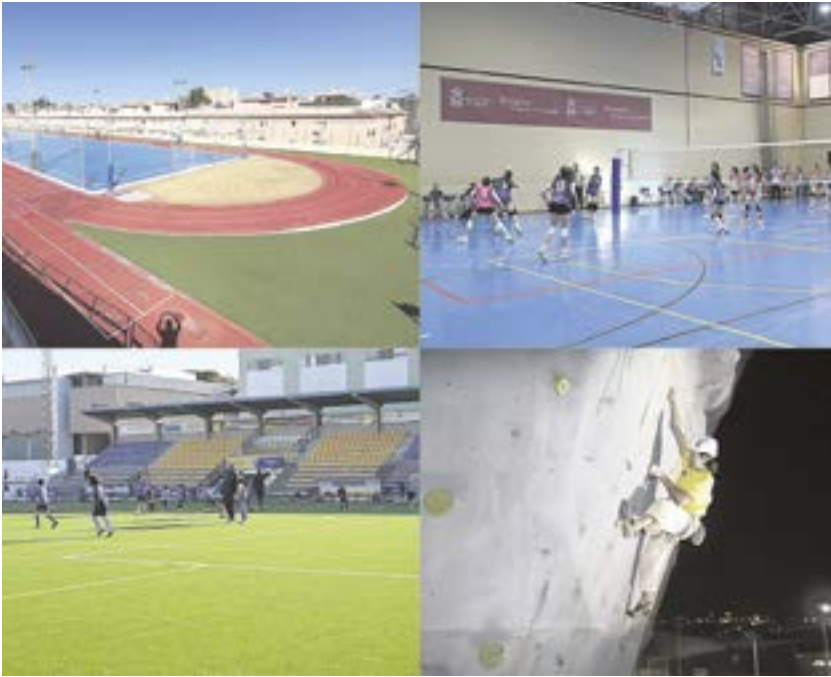
Tomares cuenta con numerosas y modernas instalaciones deportivas