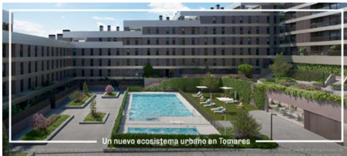
Un nuevo ecosistema urbano en Tomares