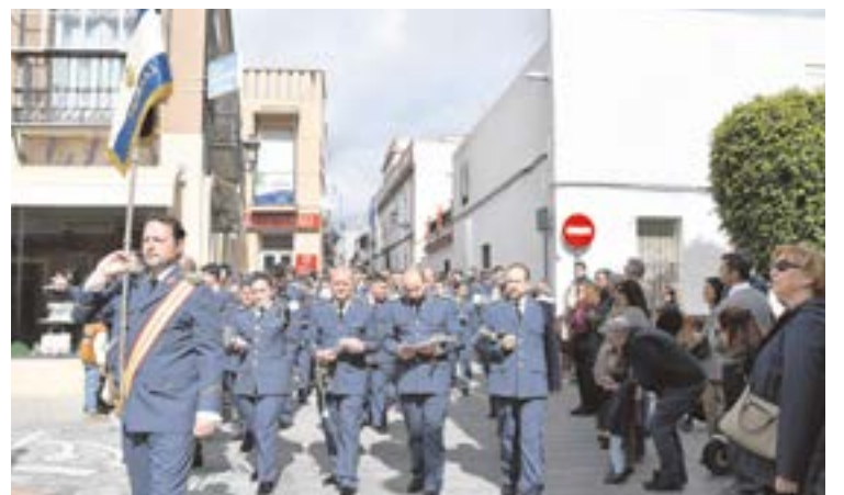
Arriba, actuación de la Banda de CC. y TT. Ntra. Sra. del Rosario de Cádiz; debajo, pasacalles con la A. M. Santa María Magdalena de Arahál