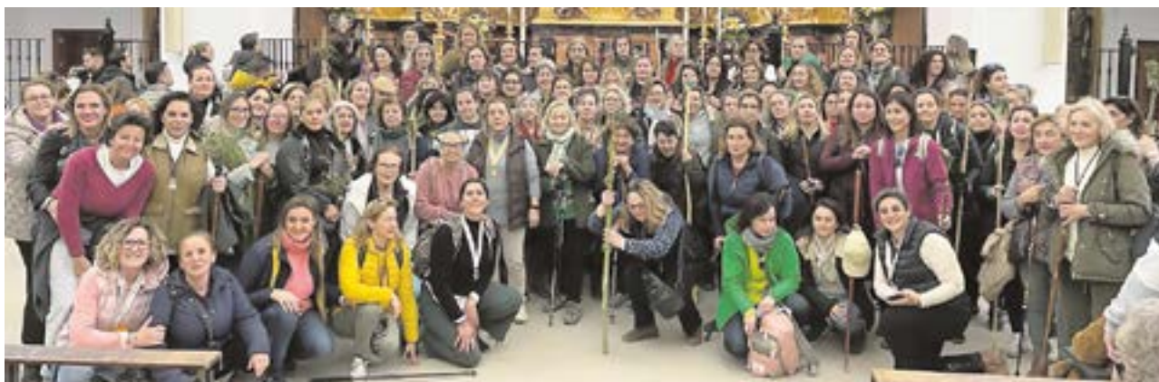
Mujeres que participaron en la peregrinación del pasado 10 de febrero organizada por la Hermandad del Rocío de Tomares