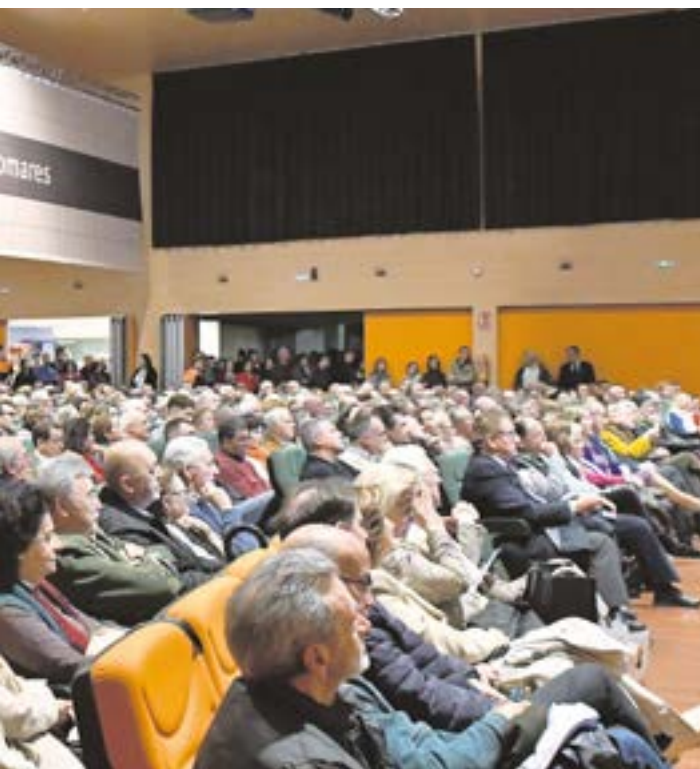
Municipal Rafael de León para ver a Fernando Savater y Rosa Díez

Preguntado por la capacidad de Feijóo para gobernar España, Revilla afirmó que, para él, es un hombre que tiene “experiencia” y, aunque está en un “partido complicado donde hay también diferencias, sí tiene capacidad para gobernar España”.