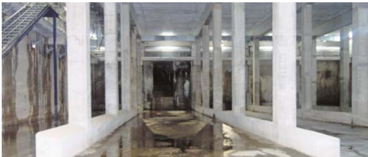
El tanque de tormentas es una infraestructura cuya construcción ha evitado inundaciones tras el paso de fuertes temporales por el municipio

Gracias a la construcción de esta importante infraestructura en el municipio, se volvieron a evitar inundaciones que podrían haber acontecido tras el paso de la borrasca Karlotta por la península ibérica, que dejó 100 litros por metro cuadrado en Tomares y obligó a cerrar los parques y jardines por precaución frente a los fuertes vientos de 70 km/h que se registraron.