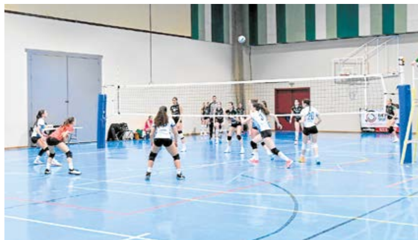
Jugadoras del equipo juvenil de la EDM de Voleibol compitiendo en el Mascareta

que acabó con grandes resultados para nuestras deportistas locales. Se proclamaron subcampeonas de la Liga Provincial Sevilla, importante victoria que les da el pase para representar a Sevilla en el Campeonato de Andalucía como equipo CADEBA.