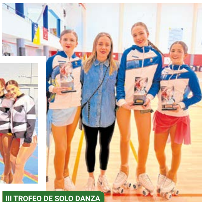
III TROFEO DE SOLO DANZA