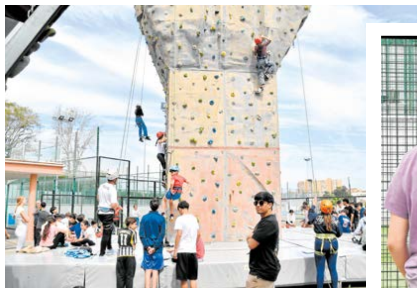
Arriba, estudiantes participando en el VIII Encuentro Escolar de Escalada; al lado, el delegado especial de Deportes durante la entrega de trofeos

Actividad con carácter anual organizada por el Ayuntamiento, a través de sus Concejalías de Educación, Juventud y Deportes.