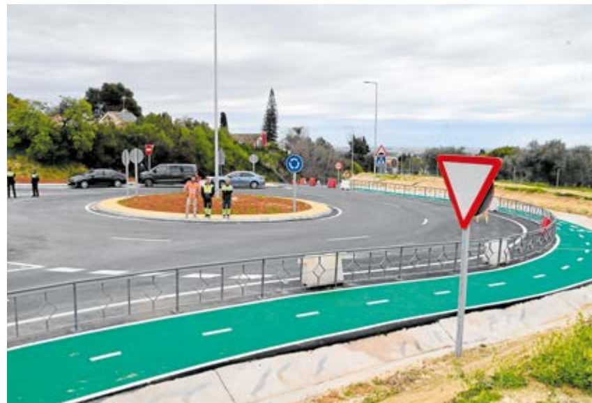
Aspecto de la nueva vía ciclopeatonal que conecta Tomares, Castilleja y Bormujos