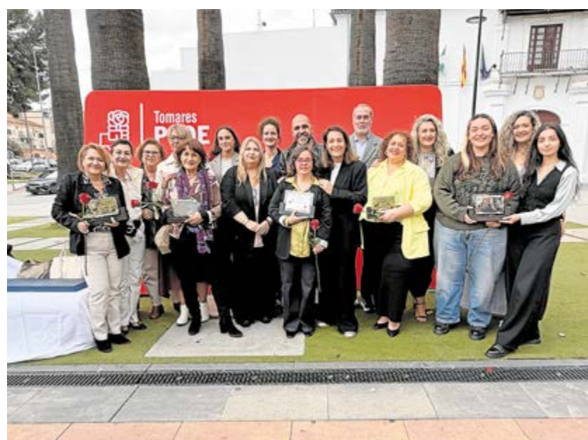
Tomareñas distinguidas con los IV Premios Aceituneras de Tomares