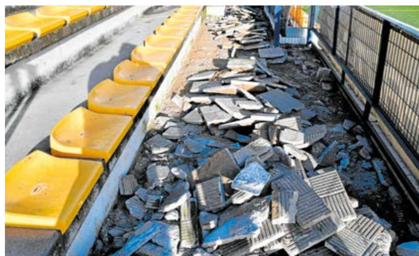
Primeros trabajos para repavimentar las zonas de paso y accesos del campo de fútbol

Estas obras se suman a las actuaciones para mejorar la iluminación led del campo, que consistieron en la renovación de las luminarias