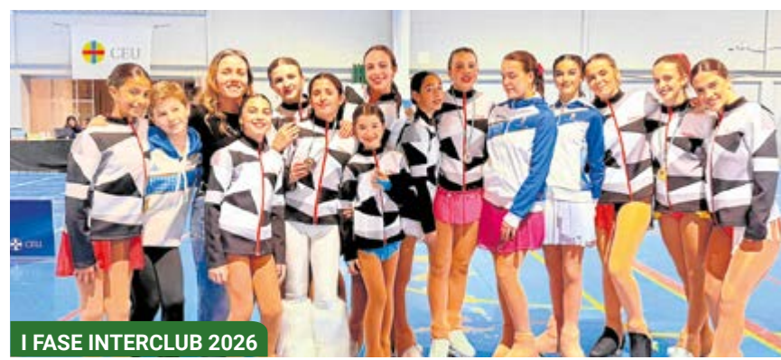
I FASE INTERCLUB 2026

Siete medallas que se suman a las otras tres (dos oros y un bronce) conseguidas el pasado 8 de marzo, cuando compitieron en el III Trofeo de Solo Danza.