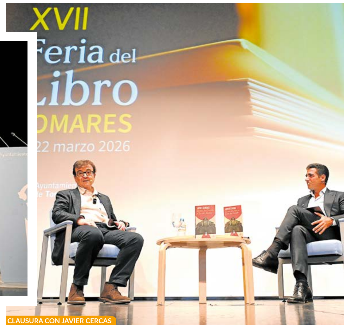
CLAUSURA CON JAVIER CERCAS