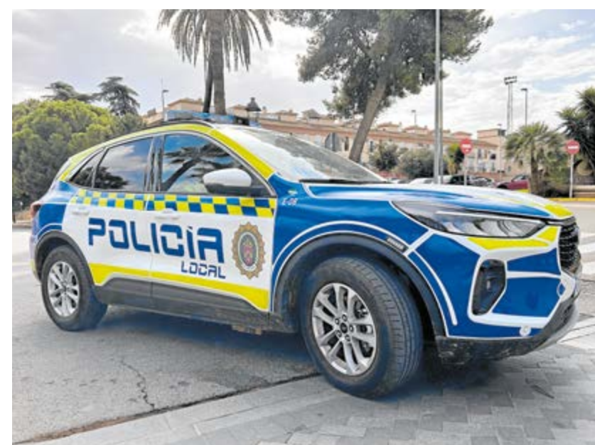
Uno de los dos nuevos coches patrulla con desfibrilador de la Policía Local