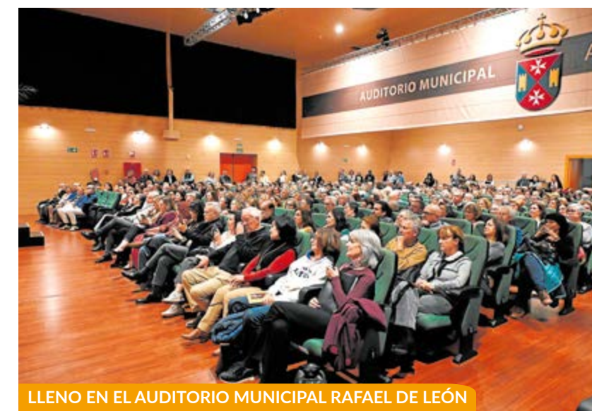
LLENO EN EL AUDITORIO MUNICIPAL RAFAEL DE LEÓN