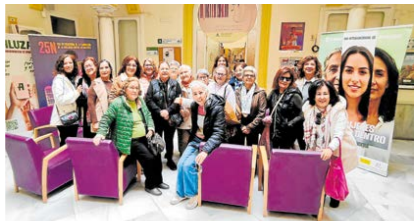
Componentes del Club de Lectura en el Centro de Documentación María Zambrano

Documentación María Zambrano del Instituto Andaluz de la Mujer en Sevilla. En este espacio, dedicado al estudio y difusión de la literatura escrita por y sobre mujeres, participaron en el taller "Las escritoras sin nombre. Anónimo era un nombre de mujer".