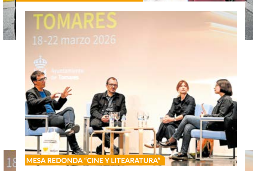
MESA REDONDA "CINE Y LITEARATURA"