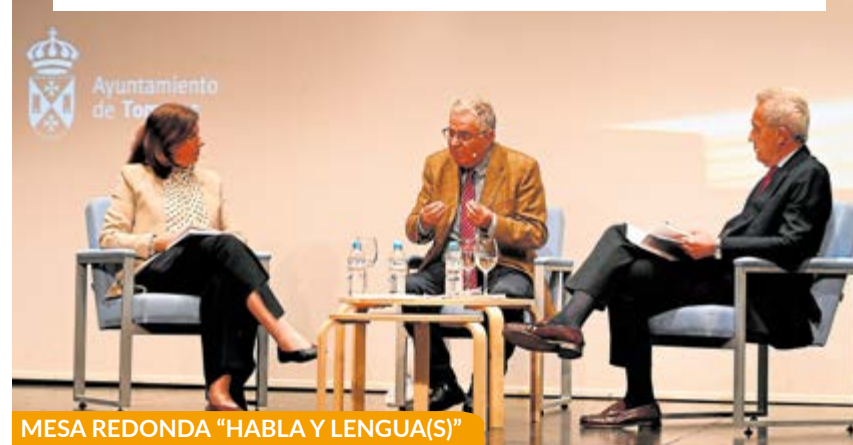
MESA REDONDA "HABLA Y LENGUA(S)"