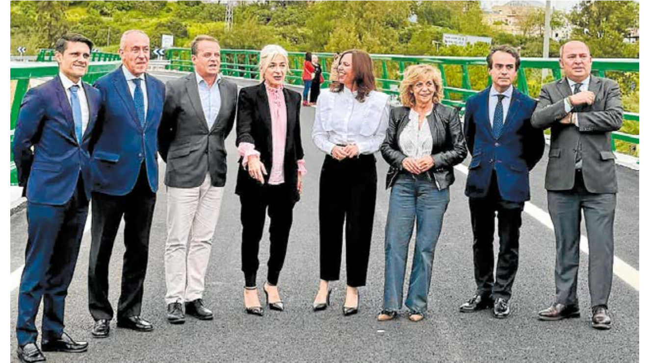
Arriba, el alcalde, José María Soriano, junto a la consejera de Fomento, Rocío Díaz, y la consejera de Cultura, Patricia del Pozo, y el resto de alcaldes y autoridades en la inauguración del nuevo carril BUS-VAO de entrada a Sevilla desde el Aljarafe

Incluye, además, otras actuaciones como la construcción de muros de conten-