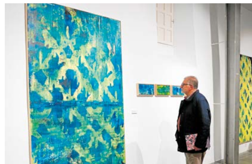
Vecino contemplando una de las obras de la muestra "Sebka, geometría líquida"