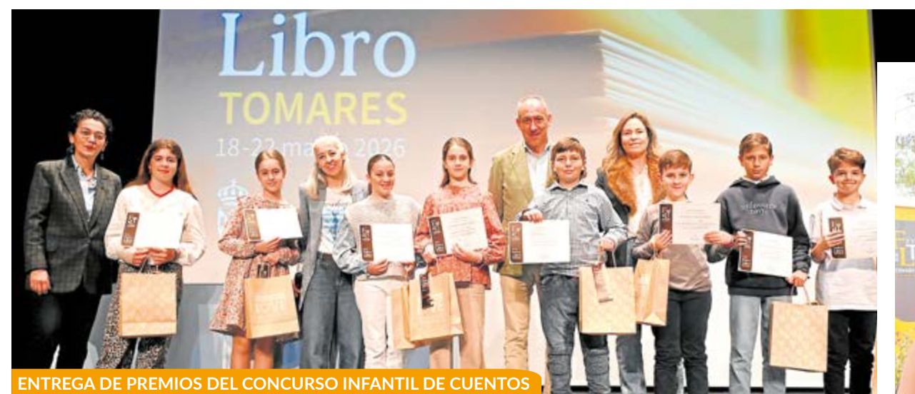
ENTREGA DE PREMIOS DEL CONCURSO INFANTIL DE CUENTOS