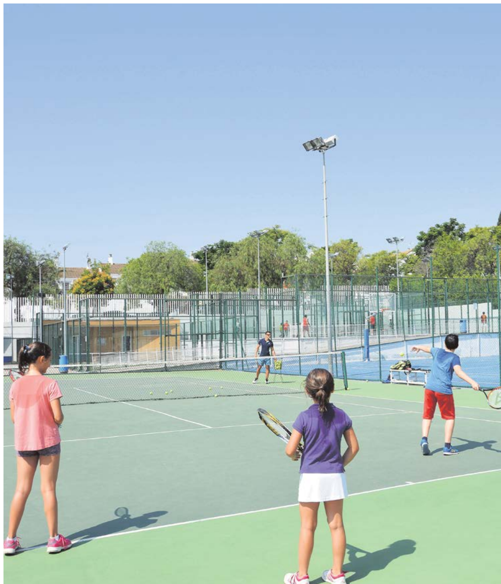
Los más pequeños aprendiendo a jugar al tenis