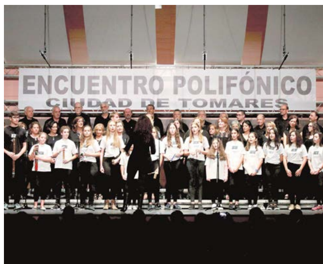
El Grupo Vocal Albéniz abrió el encuentro con el tema «Royals»