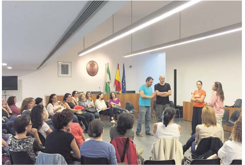
Una de las sesiones de las Jornadas «La familia a escena»

Otras de las actividades programadas son una Gratiferia, una feria en la que todo será gratis, con el objetivo de sensibilizar a la población de que lo que uno no necesita le