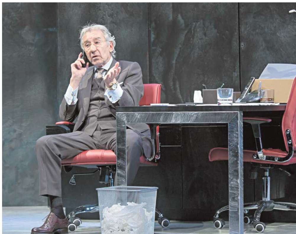
José Sacristán interpreta a un millonario sin escrúpulos

José Sacristán, protagonista junto a Javier Godino, es un tiburón de los negocios que, a punto de retirarse junto a su novia, vive el último día de trabajo en su despacho. A lo largo de la hora y media que dura la obra, surgen preguntas como ¿están los podero-