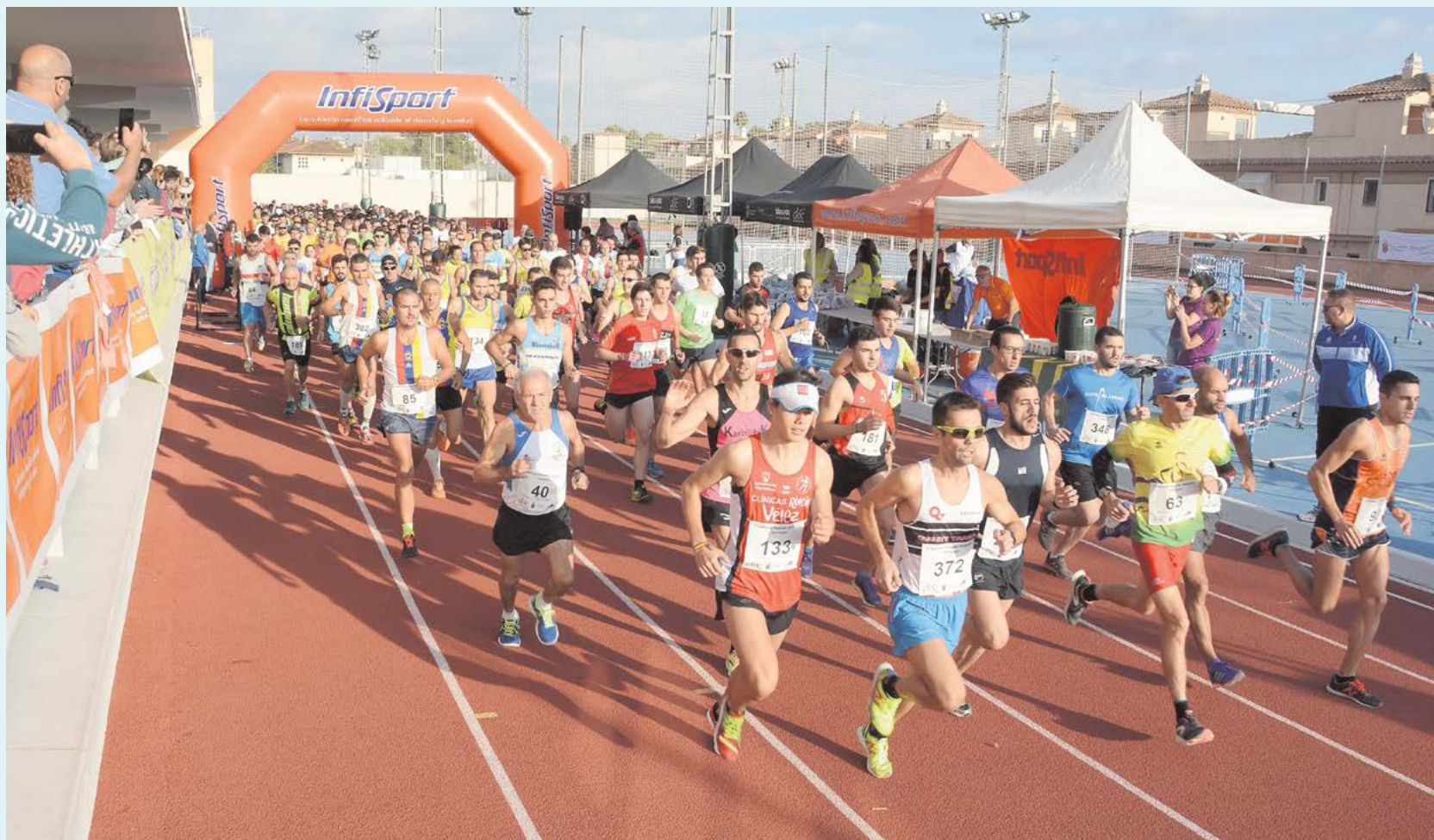
Espectacular salida de la carrera en el Polideportivo Municipal Mascareta