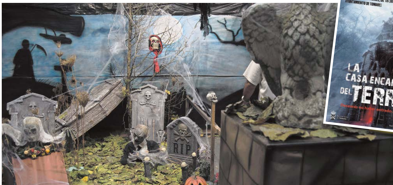
La Casa Encantada del Terror podrá visitarse en la Sala de Exposiciones del Ayuntamiento el 31 de octubre