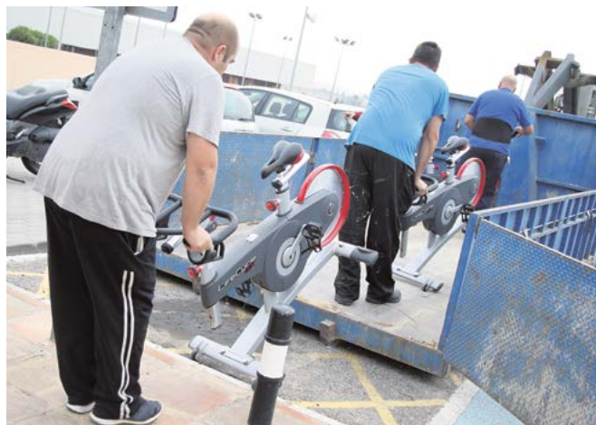
Tomareños empleados a través del Programa Extraordinario de Ayuda a la Contratación de Andalucía

Los 20 tomareños estarán contratados por el Ayuntamiento durante tres meses, entre el 17 de octubre y el 17 de enero, y realizarán trabajos, según su perfil laboral, en diferentes áreas municipales como Medio Ambiente, Vías y Obras, Deporte, Cultura, Limpieza, Servicios Sociales y Biblioteca.