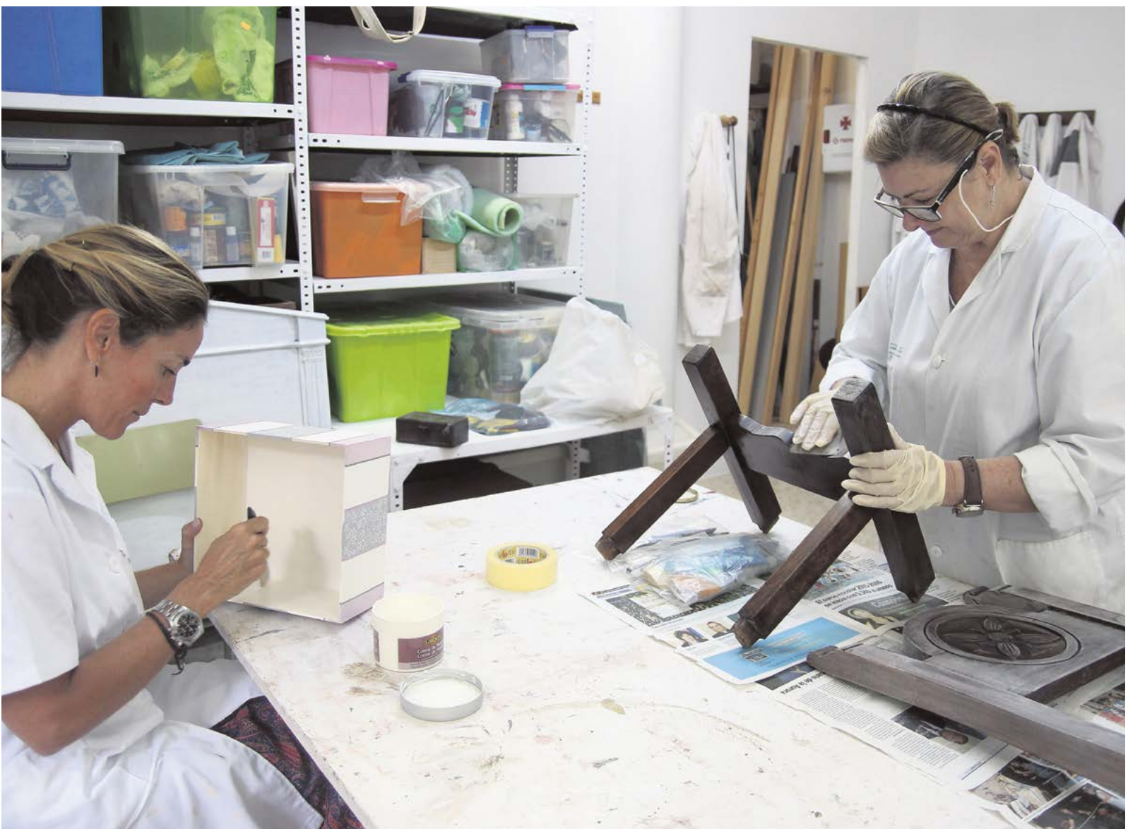
Dos alumnas del taller de restauración practican las técnicas aprendidas

Los Talleres Municipales de Cultura abarcan desde las actividades tradicionales como el baile flamenco, sevillanas, guitarra flamenca, canto flamenco, trajes de flamenca, hasta bailes latinos, pintura, pintura al aire libre, restauración de muebles, manualidades, hasta otras de actualidad como Moda: