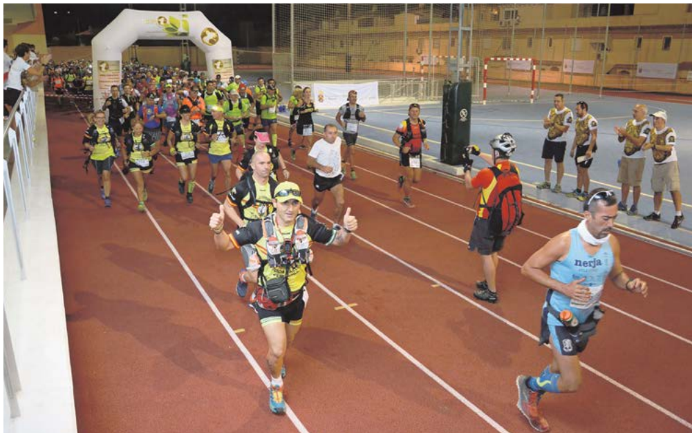
Salida de «La Pretoriana» desde el Polideportivo Municipal Mascareta