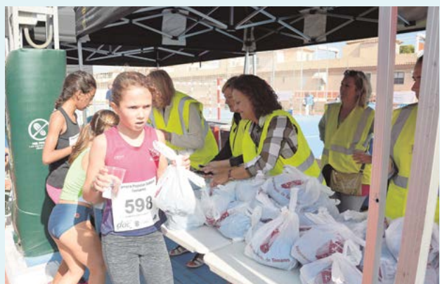
Cada corredor tenía preparada una bolsa con comida y bebida para recuperar fuerzas