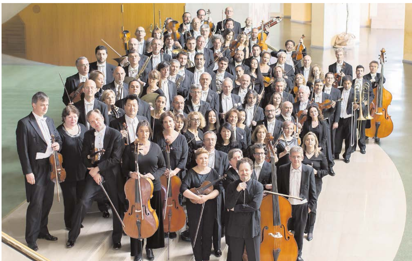
La ROSS es un referente musical en España