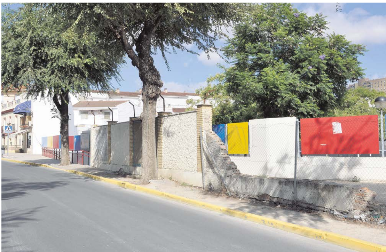
Vista del muro que será derribado para la ampliación del acerado de la calle de la Fuente

La acera se ampliará en dos metros y se colocarán farolas