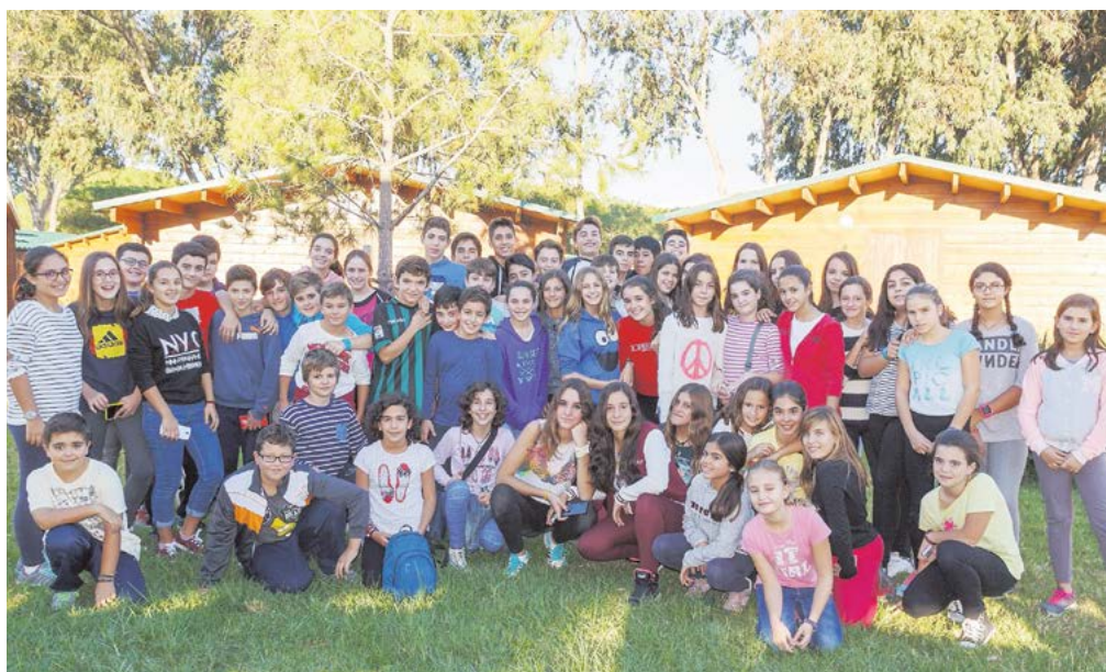
Algunos de los alumnos mediadores del curso pasado

Forma parte de la asociación de coches antiguos 'Clásicos y Joyas de Sevilla' y uno de sus deseos es organizar una gran concentración de coches antiguos en Tomares. «Nuestra idea es hacer algo solidario en Tomares. Nos gustaría poder repartir juguetes con estas joyas clásicas a los niños más necesitados del municipio».