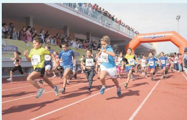
Niños y niñas disfrutaron de una jornada deportiva, así como de talleres y cuentacuentos