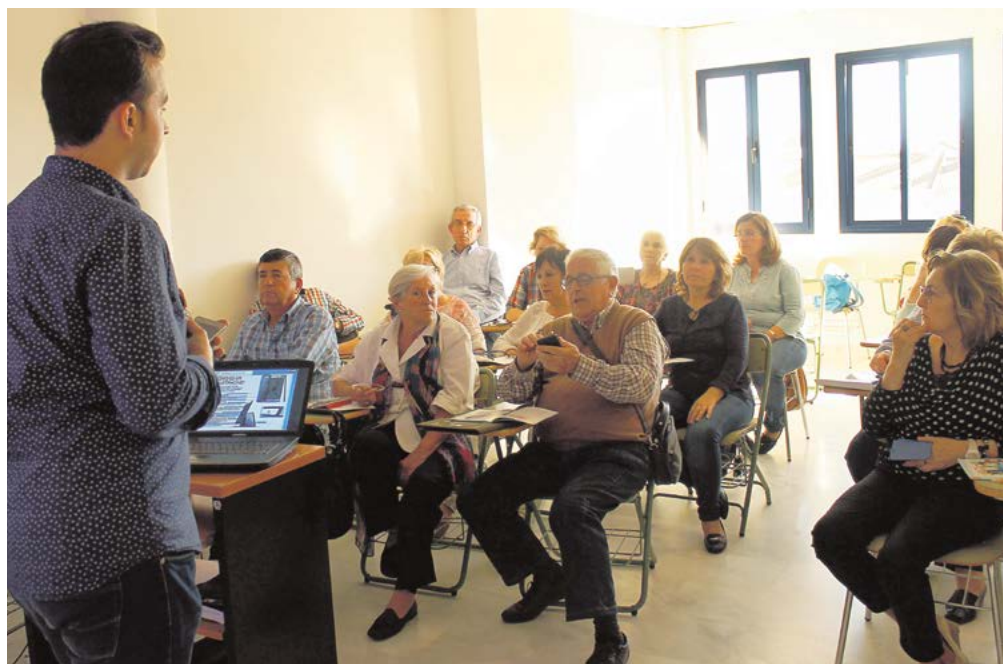
El Aula de Mayores de Tomares cuenta con 123 alumnos, el grupo más numeroso de Sevilla