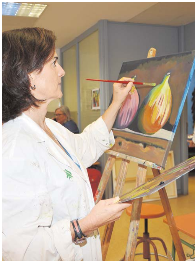
Una alumna en el taller de pintura

Las Escuelas Deportivas Municipales, junto a las ligas, torneos y eventos deportivos organizados por el Consistorio a lo largo del año, las escuelas de fútbol de la UD Tomares y el Camino Viejo CF, el Gimnasio Municipal o los distintos gimnasios privados constituyen la oferta deportiva de Tomares.