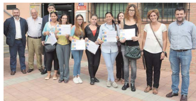
Participantes en el curso posan con sus diplomas

de Andalucía; la investigación en colaboración con la Universidad, sobre todo en temas relacionados con las técnicas de dirección de personal y administración de empresas; potenciar el desarrollo de la imagen de la Policía y la calidad de sus servicios.