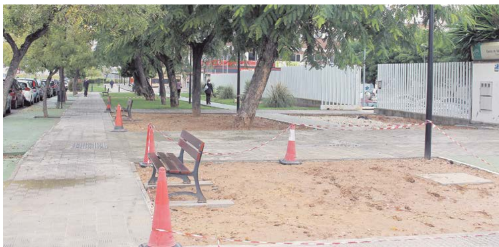
Los parterres, en los que se ha plantado césped, contarán con un sistema de riego por goteo

La gravilla se ha sustituido por una pradera verde de césped