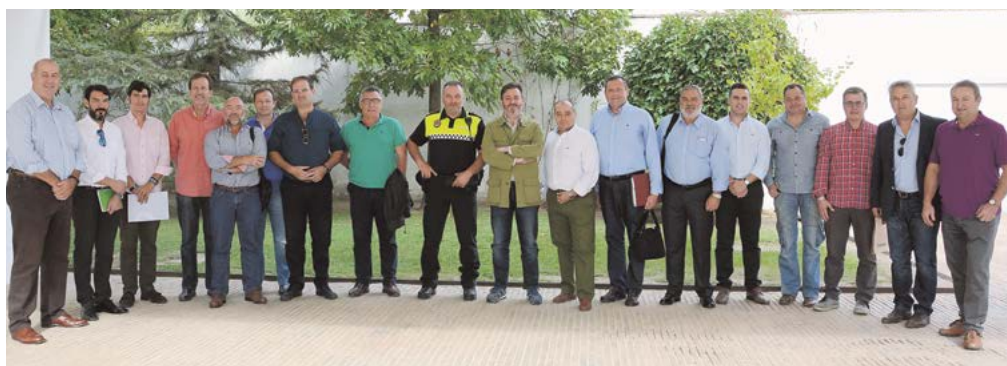
Fotografía de grupo de los jefes de Policía Local de Sevilla reunidos en Tomares

El curso, que se ha impartido en Asisttel y ha tenido una formación teórica y práctica de 8 meses de duración, ha aportado a las alumnas los conocimientos necesarios para incorporarse en el mercado laboral en este sector profesional. De hecho, gracias a este curso, prácticamente la totalidad de las alumnas ha recibido ya ofertas de trabajo en distintas empresas.