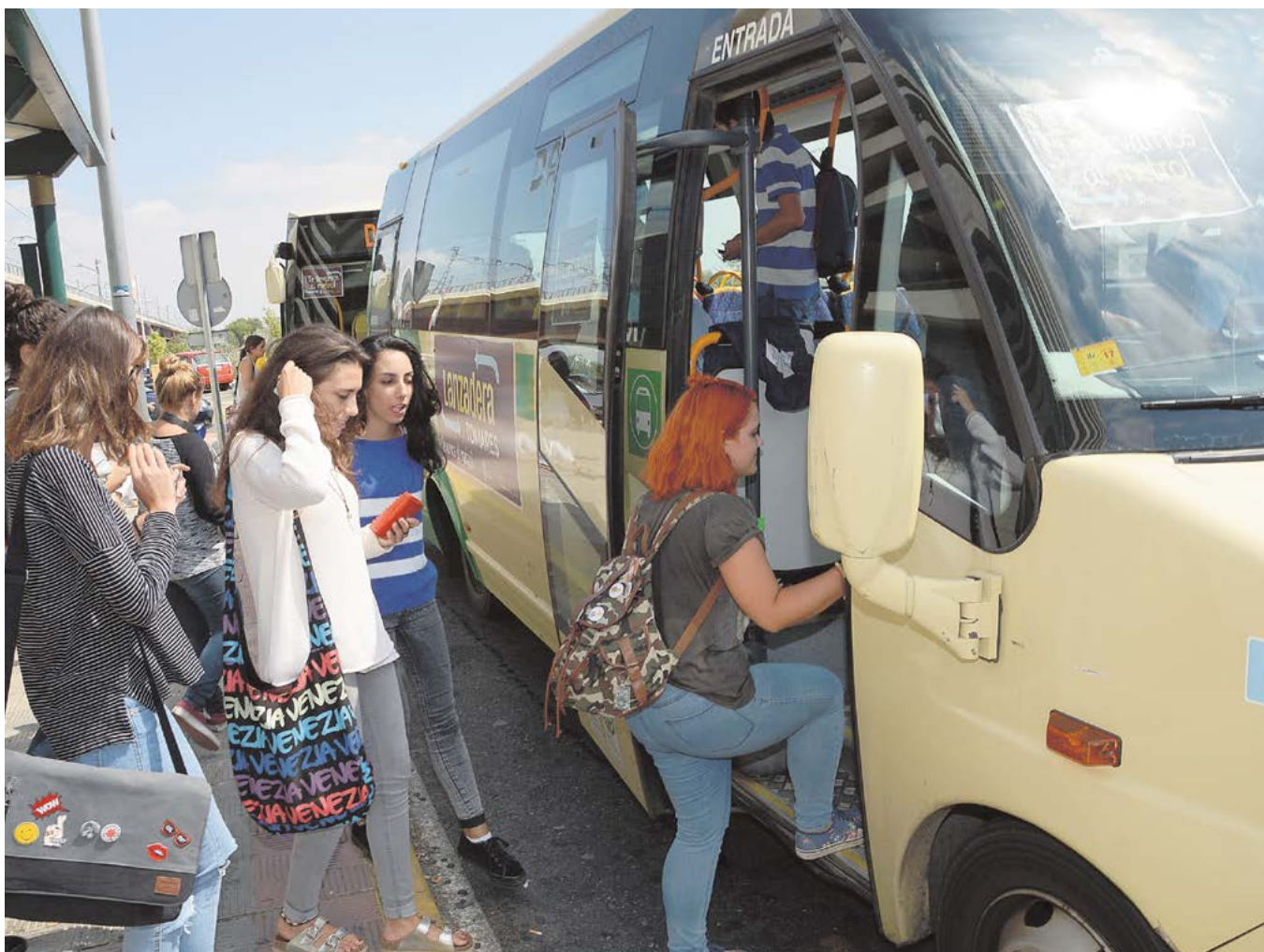
La puesta en marcha de la lanzadera tendría una rentabilidad social indudable