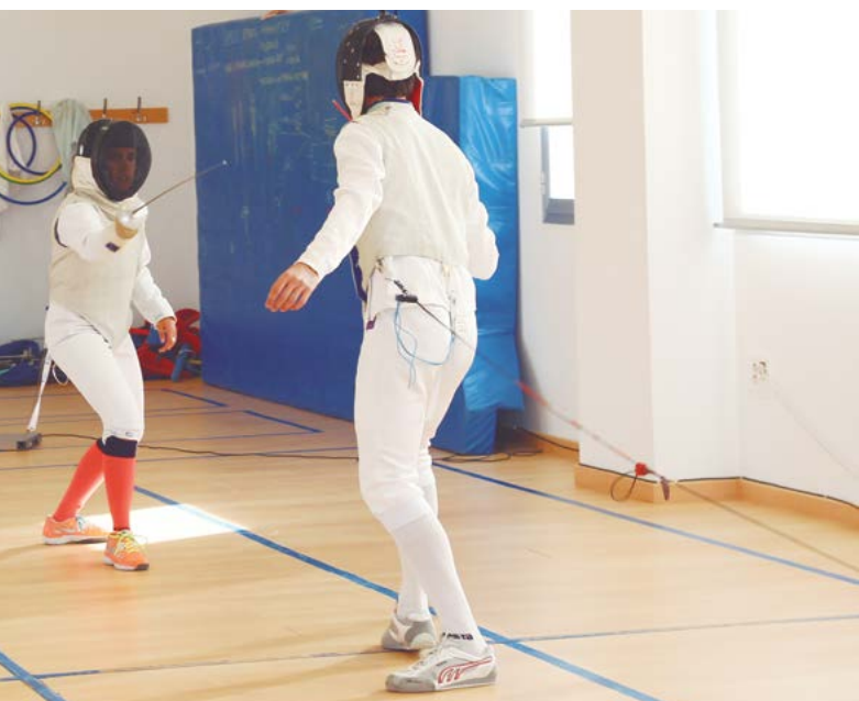
En Tomares, hay Escuelas Deportivas para todos los gustos y edades