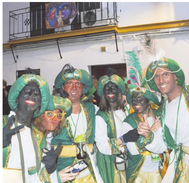
Un grupo de beduinos disfrutando de la Cabalgata del año pasado

Las inscripciones deben formalizarse en el Servicio Municipal de Atención al Ciudadano del Ayuntamiento de Tomares (C/ de la Fuente, 10), de lunes a jueves, de 8:30 a 14:30 horas y de 16:30 a 18:30 horas. Los viernes sólo en horario de mañana, de 8:30 a 14:30 horas.