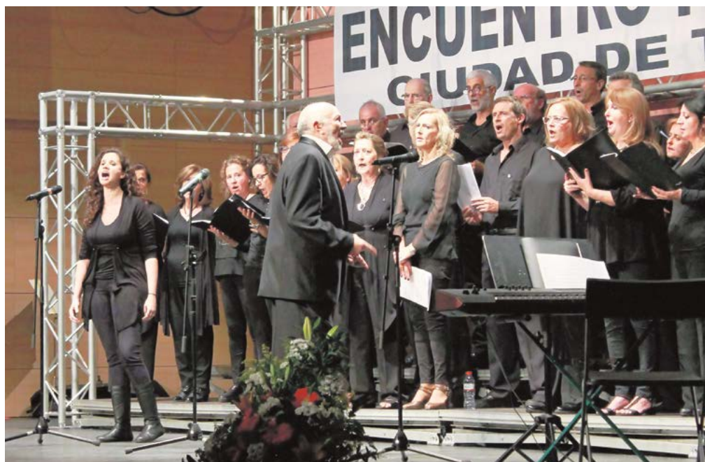
La Polifónica de Tomares, en un momento de su actuación