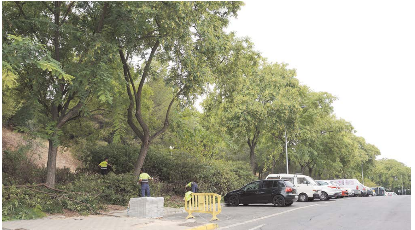
Labores de poda y arreglo del acerado que se están llevando a cabo en la calle Triana

Los trabajos han consistido en el arreglo del acerado, que estaba deteriorado en algunos tramos, en la puesta a punto de las papeleras y de los bancos de madera, que se han repintado, y en el adecentamiento de toda la zona verde, en la que se han desbrozando todos los arbustos, se han podado los árboles y se ha allanado el camino de albero que recorre la zona.