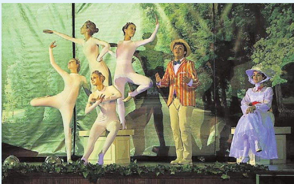
Una de las escenas del musical 'Viento del Este' del Taller de Teatro Dionisio

El Taller de Teatro Dionisio, encargado de la representación de 'Viento del Este', está con-