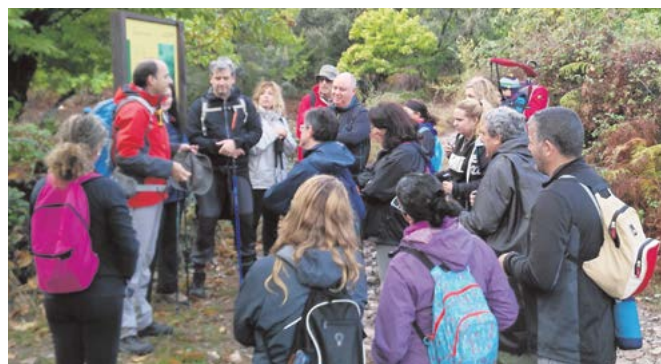
Los senderistas atienden a las explicaciones del guía

El domingo 20 de noviembre, todos los tomareños que lo deseen acudirán al Parque Natural Sierra de Grazalema (Cádiz) para realizar la ruta circular de subida al Reloj y al Simantón. Esta ruta tiene una longitud total de 10.8 km y de dificultad alta.