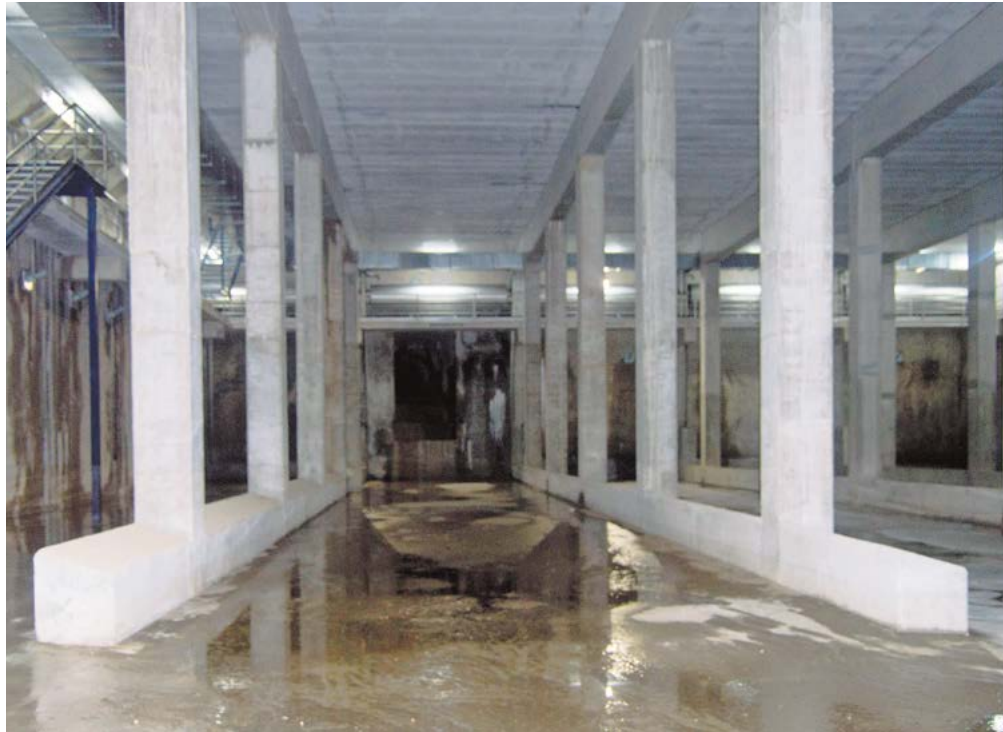
Vista del interior del tanque de tormentas que tiene capacidad hasta 16.133 m 3 de agua

El tanque de tormentas recogió el pasado sábado, el día en que la lluvia fue más intensa, 36,2 l/m 2 acumulados y hasta 9,4 l/m 2 en una sola hora, más de 3.700.000 litros (3.767 m 3 ), evitando lo que hasta su entrada en funcionamiento parecía imposible, las inundaciones que se producían en el municipio cuando caían lluvias torrenciales.