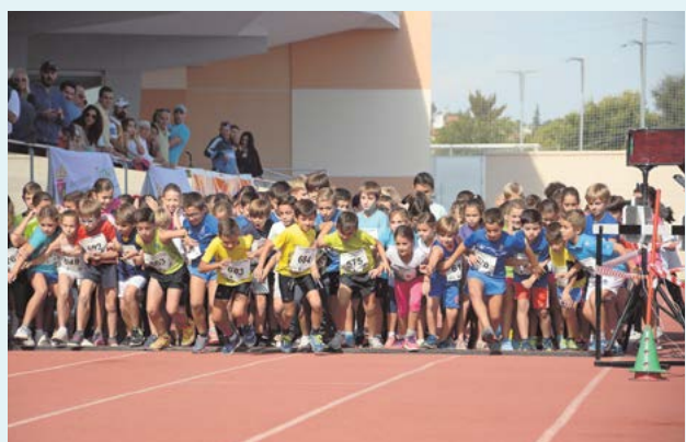
Los jóvenes participantes de la prueba no querían perder ni un segundo en su salida