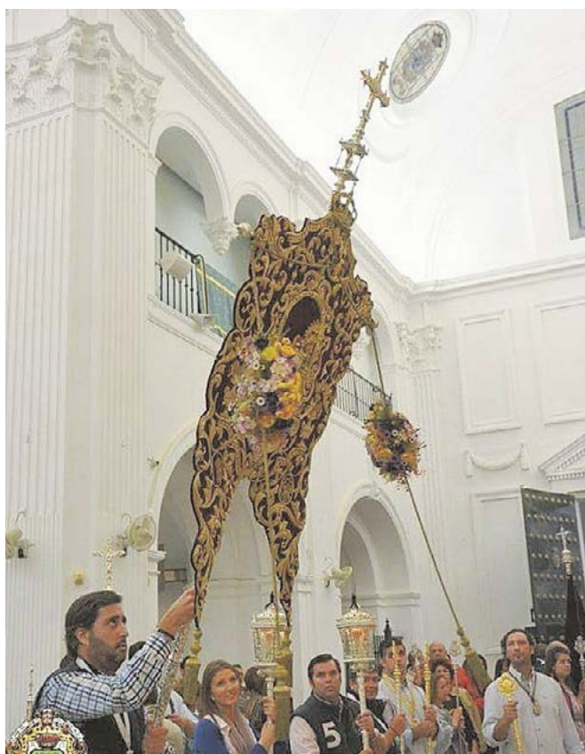
Presentación del Simpecado de la Hermandad del Tomares ante la Virgen del Rocío

El domingo 16 de octubre, tuvo lugar la tradicional Misa oficial y presentación del Simpecado ante la Virgen del Rocío. El alcalde de Tomares,