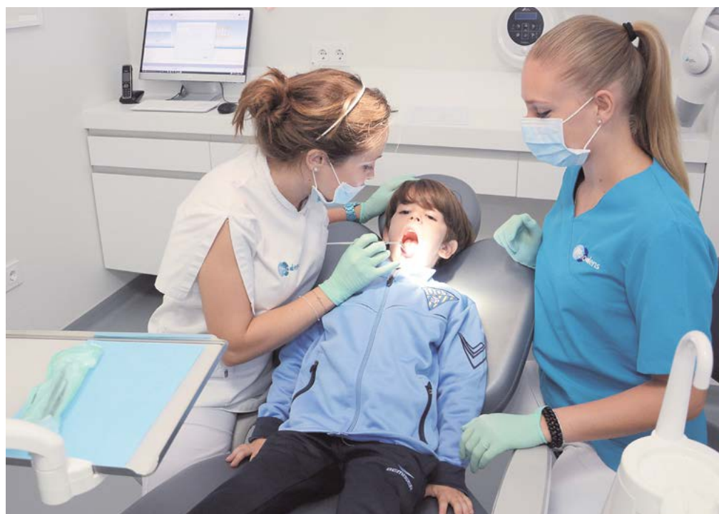
Especialistas de Biodens hacen un reconocimiento a un jugador de la escuela de la UD Tomares

Biodens, además del reconocimiento gratuito a todos los jugadores del club ofrece otras prestaciones como son una radiografía panorámica y diagnóstico gratuito, primera limpieza bucal con un 60% de descuento y otros precios especiales.