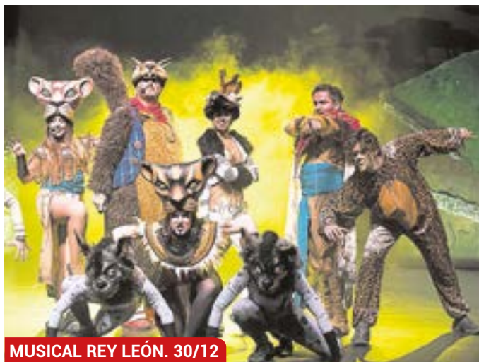
MUSICAL REY LEÓN. 30/12

Una de las películas más señeras de la factoría Disney tendrá su representación en forma de musical en Tomares. El Rey León, el musical, podrá verse en el Auditorio Municipal Rafael de León el próximo 30 de diciembre. Será a las 18:00 horas, y la entrada costará 4 euros para empadronados y 6 para el resto.