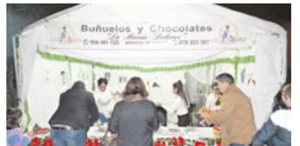
En la Plaza del Ayto. se pueden degustar los churros de la Asociación Plaza de la Alegría o los buñuelos de La Mamá Dolores