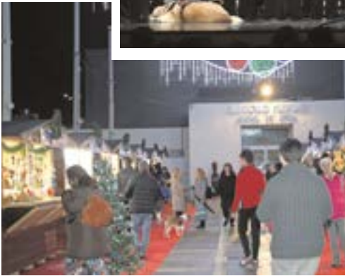
El Mercadillo de Artesanía, abierto hasta el 05/01