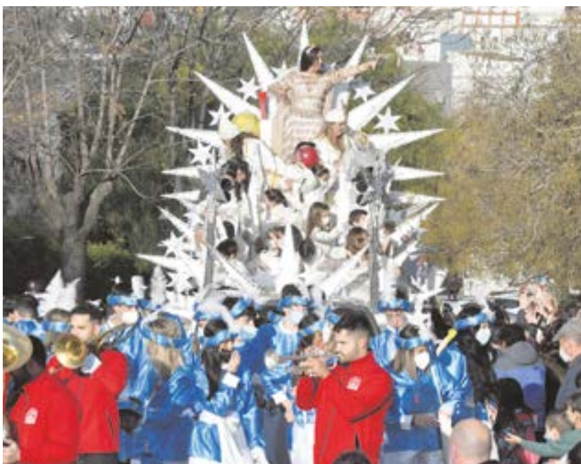
Estrella de la Ilusión repartiendo caramelos en la Cabalgata del año pasado

El Ayuntamiento lo tiene ya todo listo para el día más mágico del año, la gran Cabalgata de Reyes Magos de Tomares 2023, que saldrá el jueves 5 de enero, a las 16:30 horas de la calle Camarón de la Isla, para llenar de