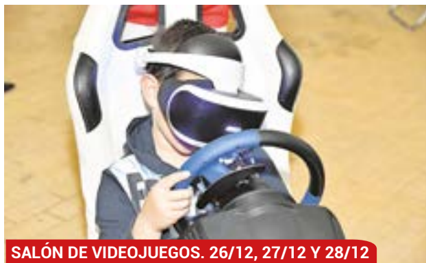
SALÓN DE VIDEOJUEGOS. 26/12, 27/12 Y 28/12

Los días 26, 27 y 28 de diciembre el Pabellón Municipal Mascareta se convertirá en un gran salón de videojuegos para disfrutar a lo grande de este entretenimiento. Niños y mayores podrán acceder a esta actividad en horario de 16:00 a 21:00 horas.