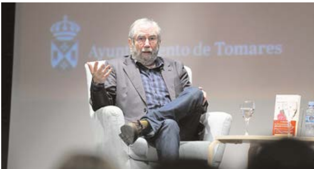
Muñoz Molina, premio Príncipe de Asturias de las Letras, cerró la pasada edición de la Feria del Libro

El deporte ha sido, sin duda, otro de los grandes prota-