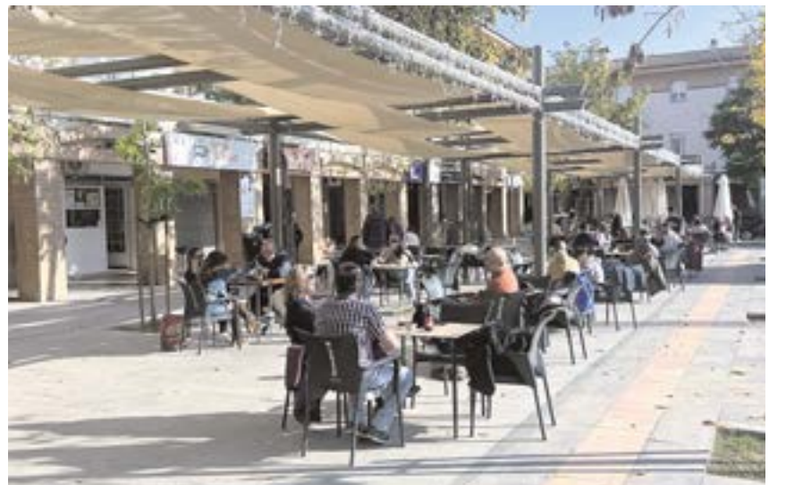
La tasa de veladores lleva suspendida por la pandemia desde 2020

La medida, a propuesta de la Concejalía de Desarrollo Económico, Transformación Digital y Atención Ciudadana, proroga la ya adoptada en 2020.