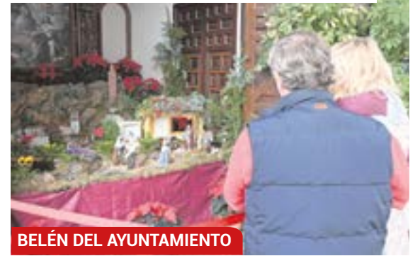
BELÉN DEL AYUNTAMIENTO