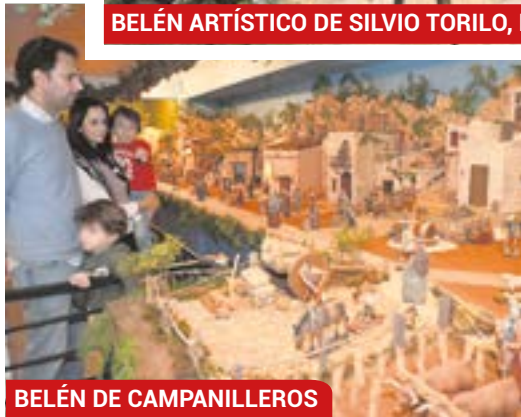
BELÉN DE CAMPANILLEROS