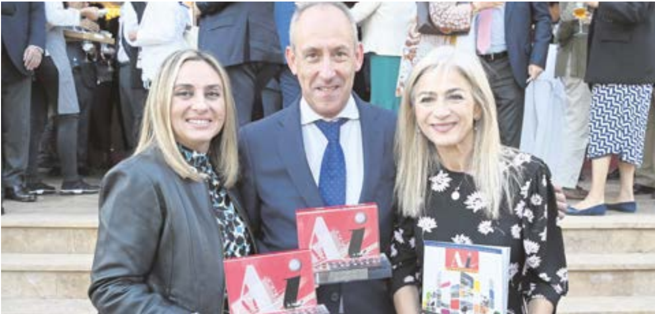
El alcalde junto a las consejeras de Fomento (izqda.) y la de Desarrollo Educativo con el premio Ciudad Siglo XXI de Andalucía

UN AÑO MUY COMPLETO EN EL QUE TOMARES HA GANADO EL PRESTIGIOSO GALARDÓN CIUDAD SIGLO XXI DE ANDALUCÍA, CON GRANDES FIGURAS EN LA FERIA DEL LIBRO Y EN EL FORO ESPAÑA A DEBATE, Y CON LA APERTURA DEL NUEVO PUNTO LIMPIO