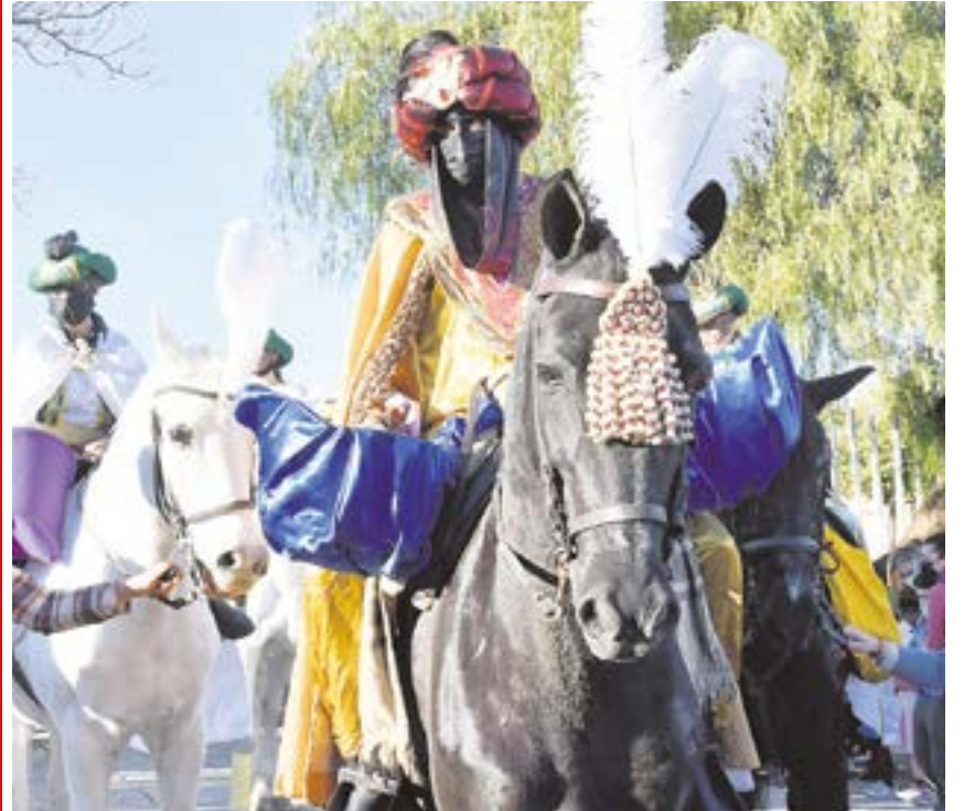
El Heraldo saldrá un año más para recoger las cartas de los más pequeños