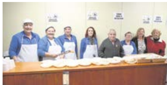
En la Plaza del Ayto. se pueden degustar los churros de la Asociación Plaza de la Alegría o los buñuelos de La Mamá Dolores