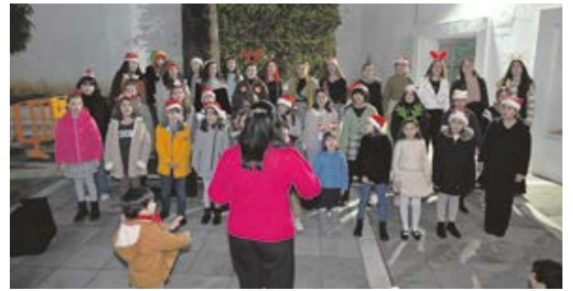
Las voces de los pequeños de la Escolanía sonaron un año más