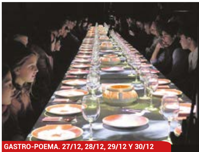
GASTRO-POEMA. 27/12, 28/12, 29/12 Y 30/12