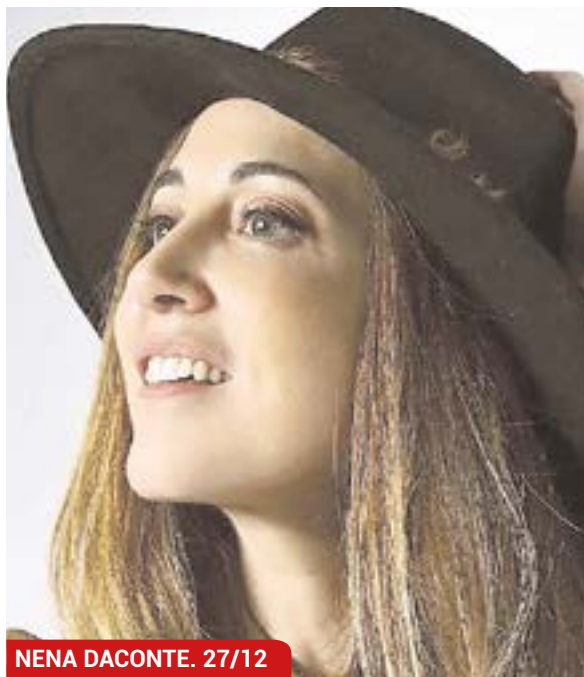
NENA DACONTE. 27/12

La música está siendo una de las protagonistas de estas fiestas con grandes conciertos. Como el de Nena Daconte, el 27 de diciembre en el Auditorio Municipal Rafael de León, a las 20:30 horas. Otro gran concierto lo ofrecerá Manuel Lombo, el miércoles 28 de diciembre, también en el Auditorio Municipal. Será a las 20:30 horas, y la entrada costará 15 euros para empadronados y 18 euros para el resto. El artista nazareno volverá al municipio con su espectáculo "Lombo y aparte".