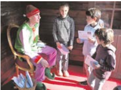
El Cartero Real recogió las misivas de los niños