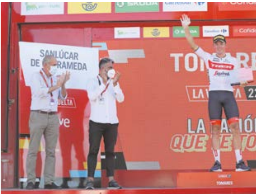
El alcalde entregando el premio al ganador de la etapa de La Vuelta que acabó en Tomares