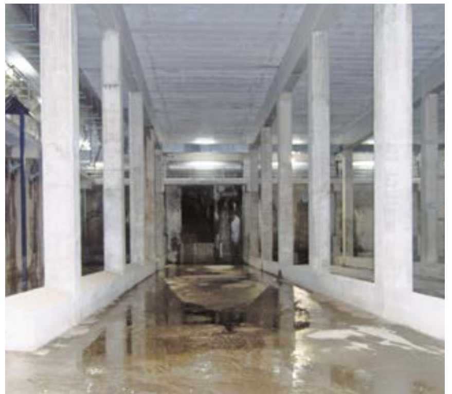
El tanque de tormentas fue la primera infraestructura de este tipo en el Aljarafe

fueron destinados para las obras del tanque de tormentas, y dos millones para la construcción de tres grandes colectores para mejorar el sistema de desagüe de la zona del Parque Empresarial el Manchón.