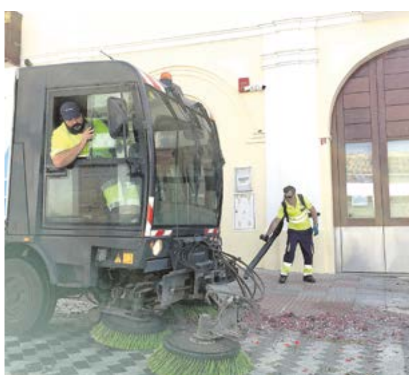
Arriba, contenedor de carga lateral realizando la recogida de residuos sólidos urbanos; debajo, dos operarios de PreZero trabajando en la calle Tomás Ybarra y utilizando dos tipos de maquinaria especial para el limpiado de calles