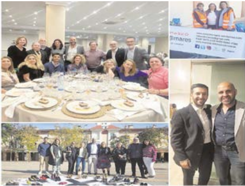
Miembros del PSOE de Tomares en diversos eventos celebrados en el municipio