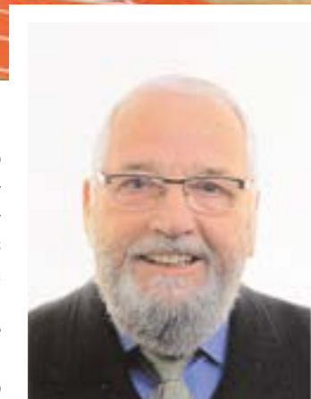
Arriba, complejo deportivo dedicado a Miguel Ángel Blanco; debajo, Manuel Bizcocho Fuertes, que da nombre ahora a una plaza en la zona peatonal de la calle Blas Infante

El Pleno del Ayuntamiento de Tomares aprobó el pasado viernes, 2 de diciembre, con los votos a favor de todos los grupos (PP, UP y Cs) y la abstención del PSOE, nominar como “Miguel Ángel Blanco” el Complejo Polideportivo Municipal, el espacio público deportivo más importante de la localidad, situado en-