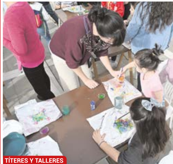
TÍTERES Y TALLERES

Continúan los espectáculos de títeres que tanto embelesan a los más pequeños. Los días 27, 28, 29 y 30 de diciembre, y el 2 de enero, en los patios del Ayuntamiento, a las 12:30 horas. También siguen los talleres en la Plaza de la Constitución, todos los días hasta el 4 de enero (excepto el día de Año Nuevo). Allí, los niños podrán aprender astronomía, macramé, sobre minerales y fósiles o podrán hacer lámparas recicladas, molinos de viento o bombones, entre otros.