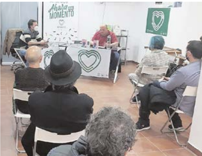
Ha sido un año de duro trabajo en el que hemos presentado numerosas mociones