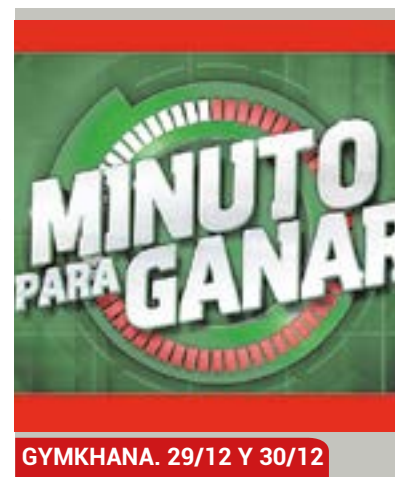
GYMKHANA. 29/12 Y 30/12

Dos días, el 29 y 30 de diciembre, habrá para disputar la divertida gymkhana familiar. Un reto al que podrán enfrentarse en el Patio de las Bugarillas del Ayuntamiento, de 16:30 a 19:30 horas. Actividad juvenil bajo el título "Un minuto para ganar".