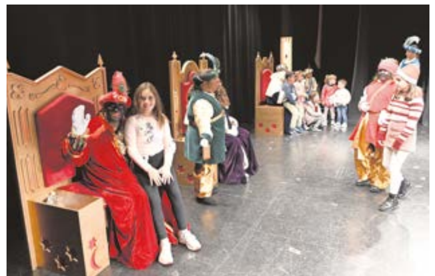
Exaltación de los Reyes Magos de la asociación Plaza de la Alegría