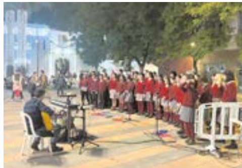
Concierto del coro Ntra. Sra. de las Mercedes