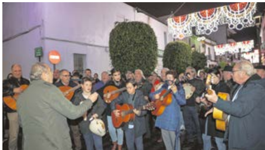
Campanilleros durante su actuación en el acto de encendido del alumbrado navideño