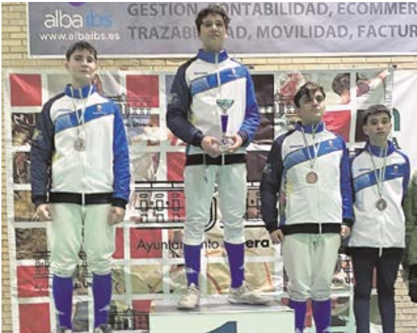
Tiradores de la Escuela Deportiva Municipal de Esgrima de Tomares