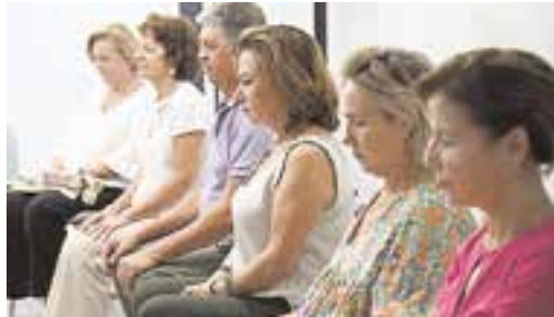
Tomeños relajándose en el Espacio de Meditación

completando así 55 minutos de una relajante y enriquecedora experiencia.