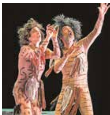
"Mamut", el sábado 4 de noviembre