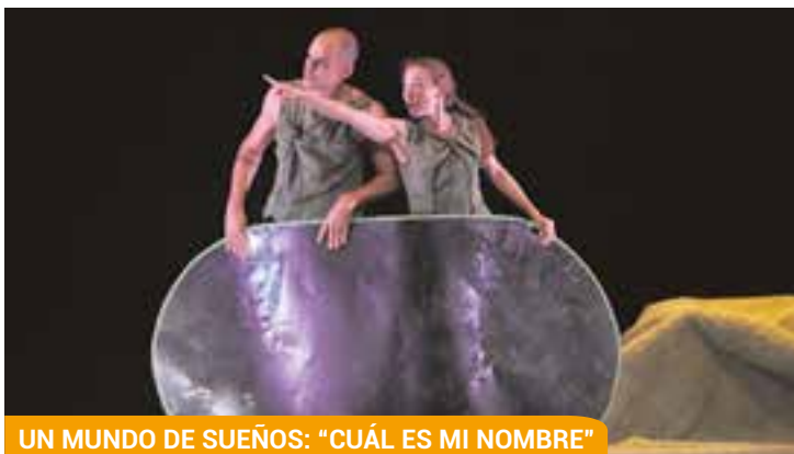
UN MUNDO DE SUEÑOS: "CUÁL ES MI NOMBRE"