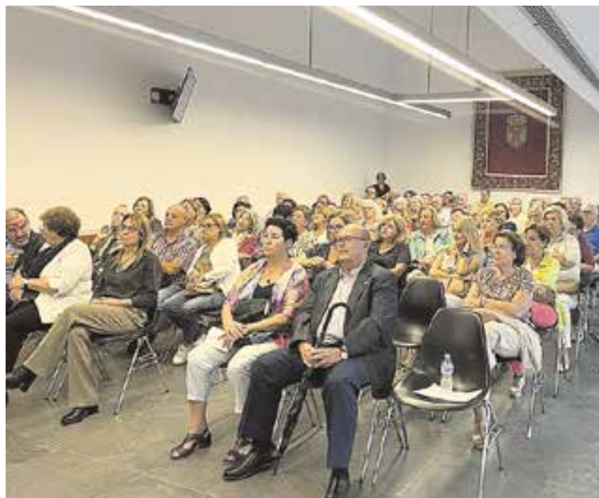
Alumnos del Aula Abierta de Mayores de la UPO asistiendo a la conferencia inaugural