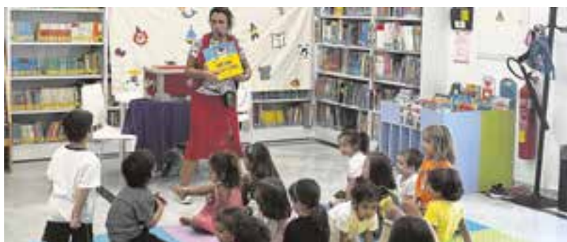
"La hora del cuento", taller de cuentacuentos para los más pequeños