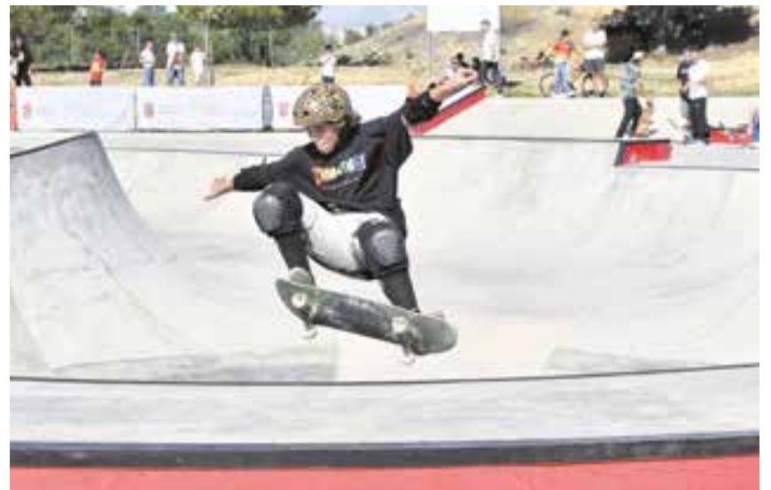
Dos jóvenes participando en la competición de monopatín el pasado 21 de octubre