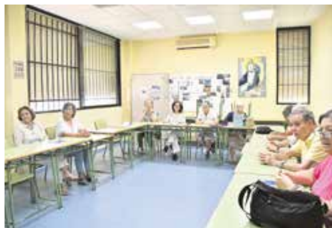
Alumnos del Taller de la Memoria en el centro Luis Cernuda

65 años, a mantener bien su memoria, lo cual repercutirá en una buena calidad de vida.