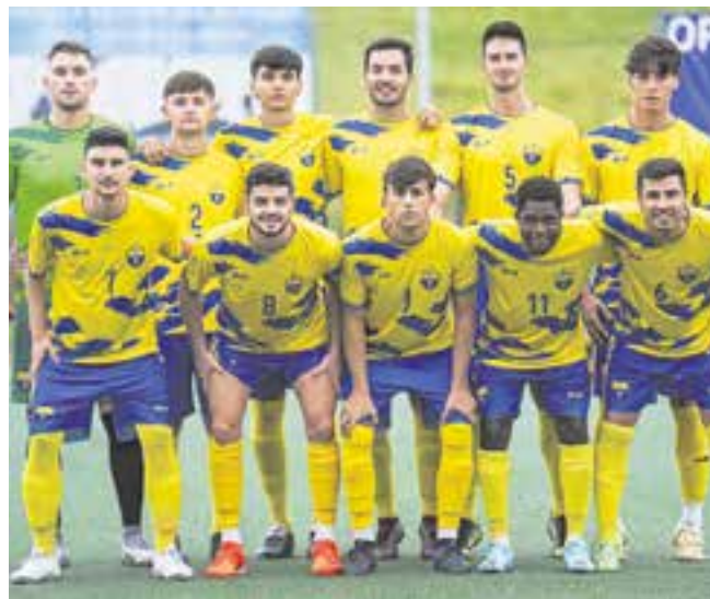
Once inicial del Camino Viejo CF en la 6ª jornada contra el JP Gines