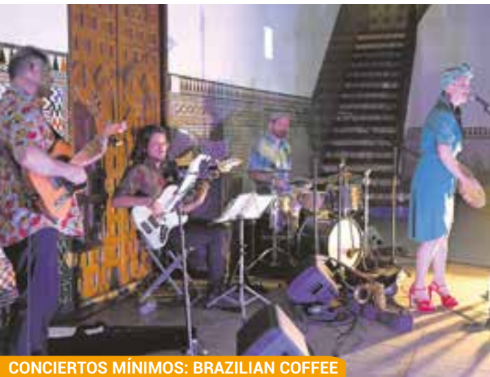
CONCIERTOS MÍNIMOS: BRAZILIAN COFFEE