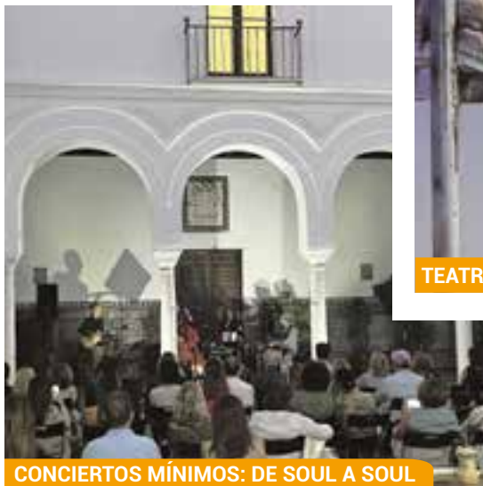
CONCIERTOS MÍNIMOS: DE SOUL A SOUL