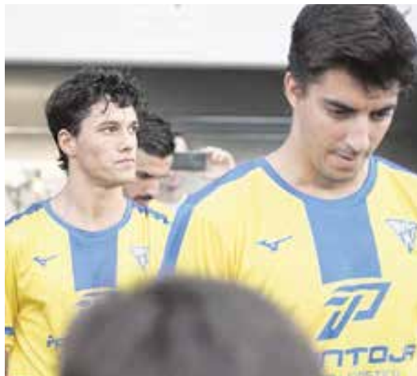
Jugadores de la UD Tomares dirigiéndose al campo de juego

Por su parte, el Camino Viejo, en Segunda Andaluza, aún no ha conseguido puntuar. Cabe destacar el papel del equipo Cadete A, que lleva cuatro victorias consecutivas.