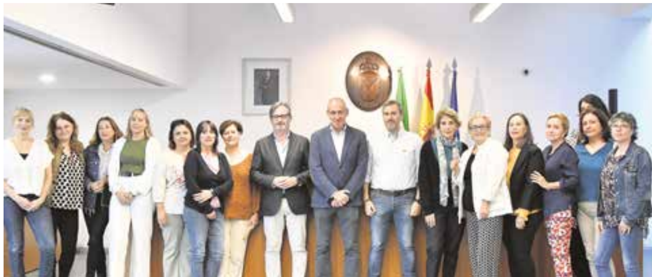
El alcalde y el concejal de Desarrollo Económico junto a las 12 alumnas del programa "Prestación de Servicios en Archivos y Bibliotecas"

TAMBIÉN COMENZARÁN OTRAS DOS FORMACIONES EN DOCENCIA Y EN GESTIÓN ADMINISTRATIVA Y UN VECINO HA SIDO BECADO PARA UN MÁSTER DEL INSTITUTO CAJASOL