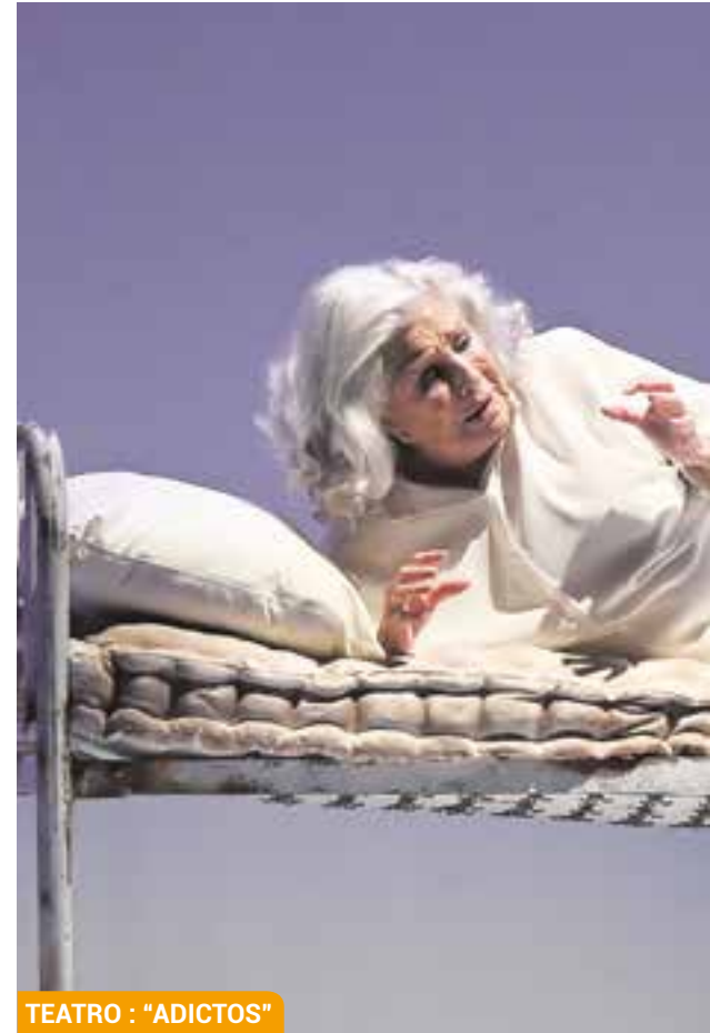
TEATRO : "ADICTOS"