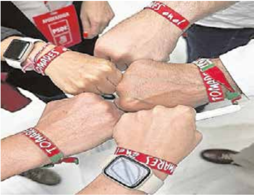
El equipo del PSOE de Tomares, unido por nuestro municipio