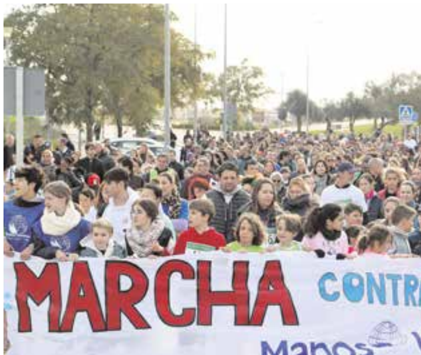
Imagen de archivo de la primera marcha que se celebró el pasado 11 de febrero

Se trata de la segunda edición de esta iniciativa que se realizó por primera vez con gran éxito de participación el pasado 11 de febrero, la marcha cuyos fondos se destinaron a la construcción de tres pozos de agua en Camerún (África). Una actividad dirigida especialmente a los centros educativos y cuyo dorsal cuesta 5 euros.