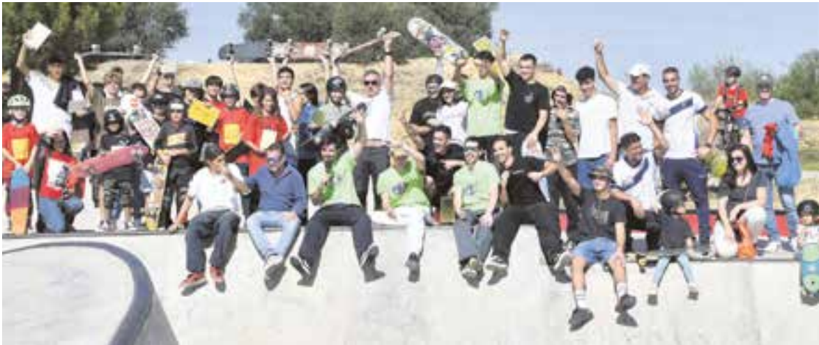
Asistentes y aficionados al monopatín durante la celebración del "State Jam Contest"