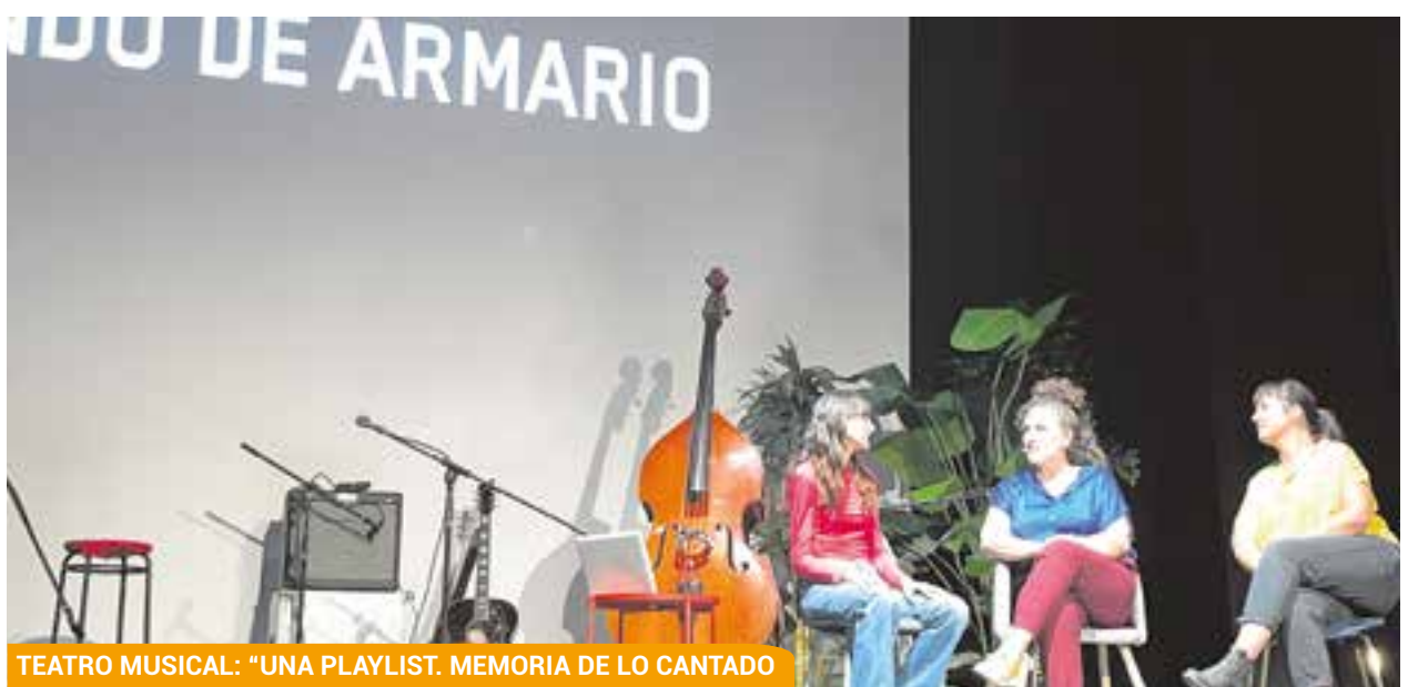
TEATRO MUSICAL: "UNA PLAYLIST. MEMORIA DE LO CANTADO"