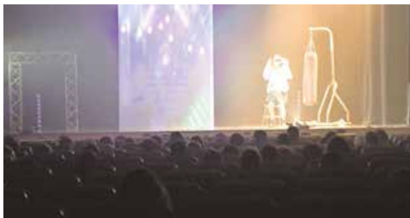
Los alumnos de 6º del Juan Ramón Jiménez disfrutaron de la obra "Puños de harina"