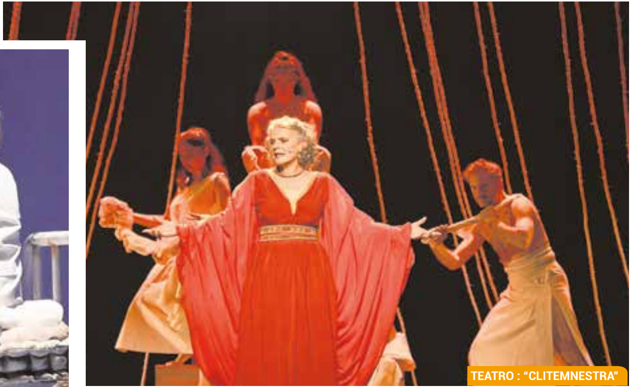
TEATRO : "CLITEMNESTRA"