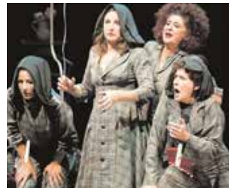
"El viento es salvaje", el jueves, 16 de nov.