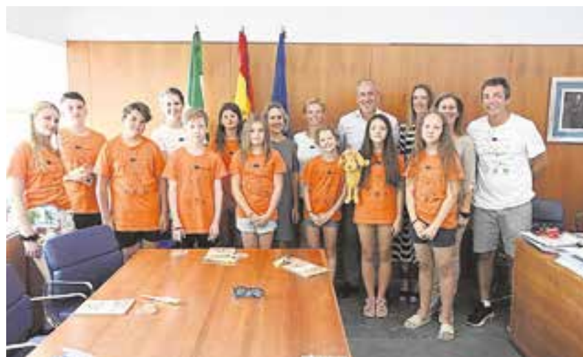
El alcalde y la edil de Educación recibieron a los alumnos y profesores de la Rep. Checa