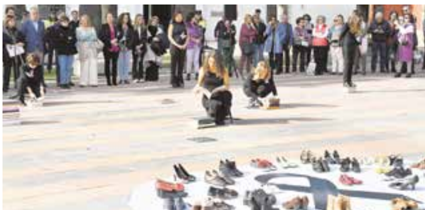
Acto por el 25N del año pasado que tuvo lugar en la Plaza del Ayuntamiento

Unos actos que este año giran en torno a la temática "Mujer y Discapacidad" con el objetivo de concienciar a la población y dar visibilidad a las mujeres que padecen alguna discapacidad a raíz de una agresión machista, así como a las mujeres que, por tener una discapacidad, son más vulnerables ante situaciones de violencia.