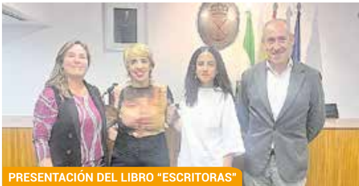
PRESENTACIÓN DEL LIBRO "ESCRITORAS"

Y no podían faltar las actividades infantiles que se centran en la biblioteca con distintos talleres, la "Hora del Cuento" y con el ciclo "Un mundo de sueños", teatro familiar que en octubre ha traído al municipio tres nuevas obras: "Clic, clac, mú", "Pepo y Pepe" y "Cuál es mi nombre".