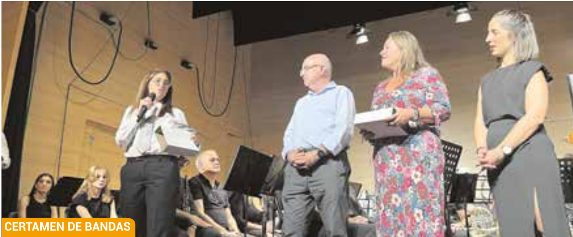
CERTAMEN DE BANDAS

El Ayuntamiento celebró el 12 de Octubre con una conferencia y un acto conjunto en San Juan de Aznalfarache.