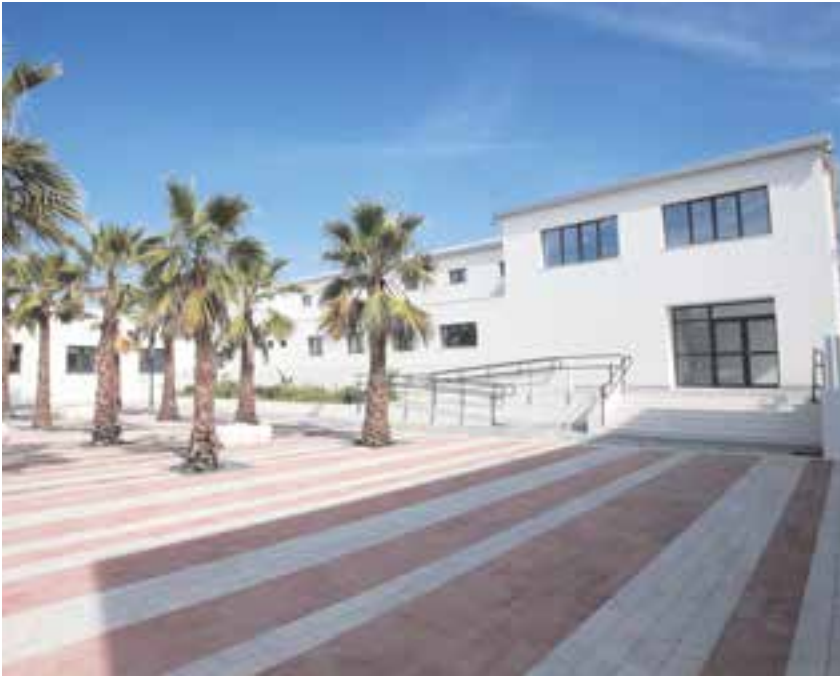
Así luce el ya operativo Centro Cultural "Tomás de Ybarra"