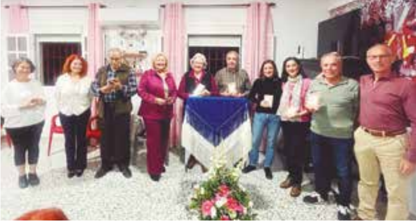
Participantes en el II Recital de Poesía "Memorial Trini Reina"