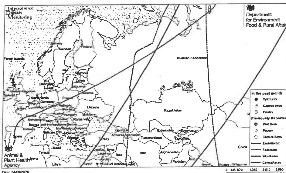
Mapa 1: Focos IAAP Julio-Agosto 2020 y rutas migratorias.

Desde finales de julio de 2020, se ha informado sobre la circulación de Influenza Aviar Altamente Patógena (IAAP) H5N8 en aves de corral domésticas y aves silvestres en el sur de Rusia y en la vecina Kazajistán, lo que podría indicar en base a la experiencia de olas epidémicas anteriores (2005-2006 y 2016-2017) un aumento del riesgo de difusión del virus hacia zonas de Europa septentrional y oriental, dado que desde agosto a principios de diciembre las aves migratorias en estas zonas abandonan sus lugares de reproducción de primavera-verano en busca de áreas de alimentación en lugares más cálidos, deteniéndose en múltiples lugares de descanso en Europa y Asia occidental ( Ver mapa 1 ).